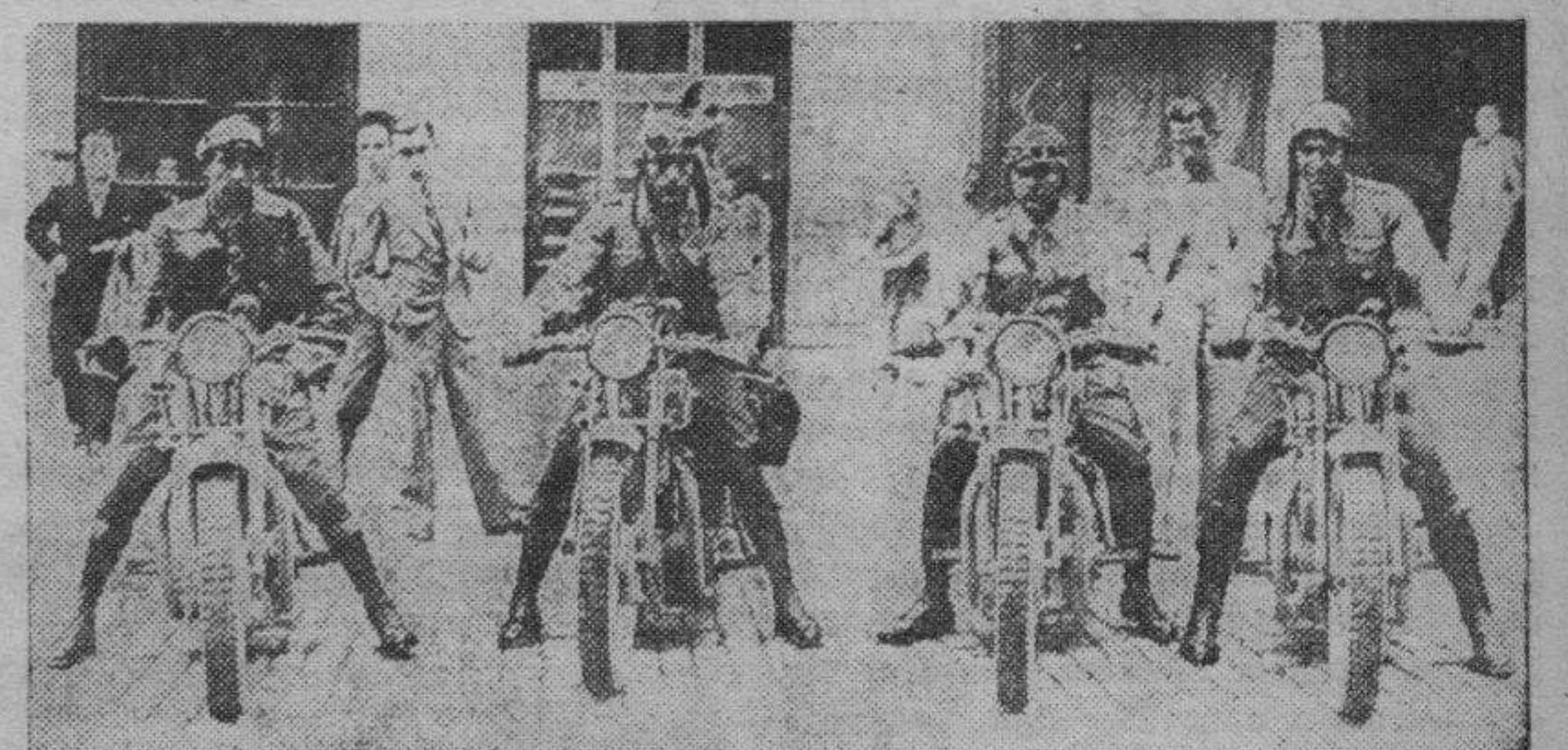
Una sección de los motoristas destinados definitivamente a Zaragoza según reciente disposición.