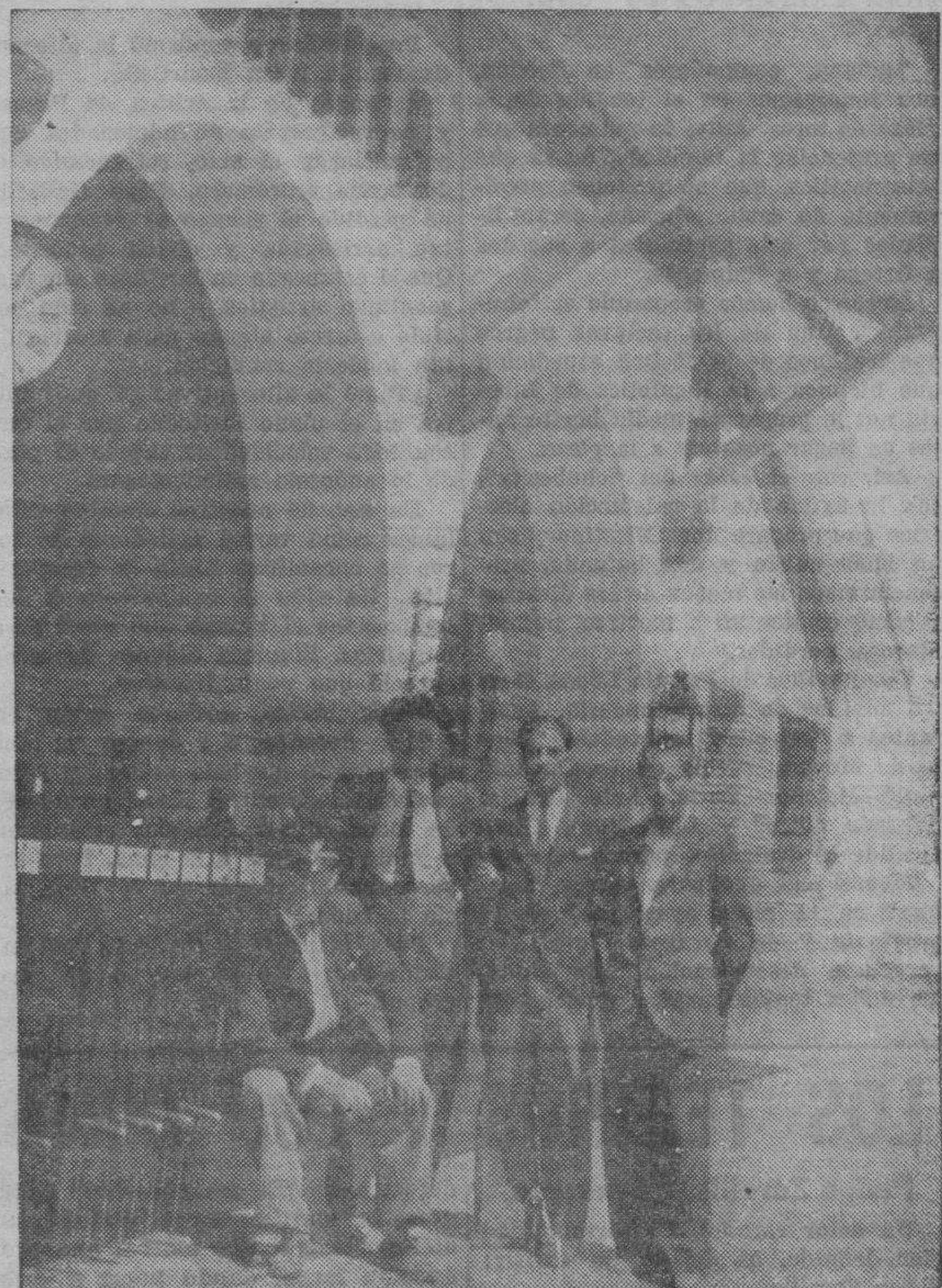
BOTORRITA. — Recientemente fué inaugurado el nuevo edificio-estación, cuya es la vista parcial que publicamos.

La salida será, según costumbre, de la plaza de la Constitución, a las siete y media de la mañana.