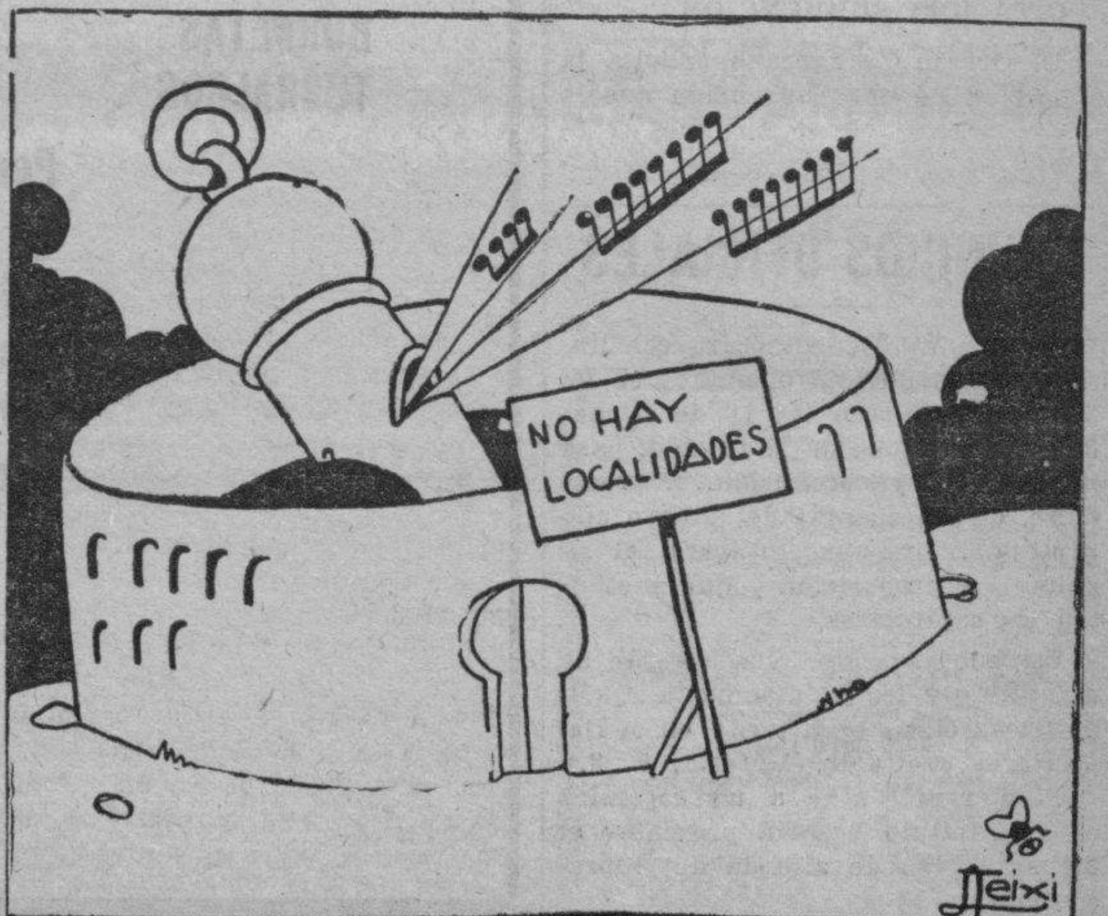
Una de las faenas "cumbres" de Rafael.