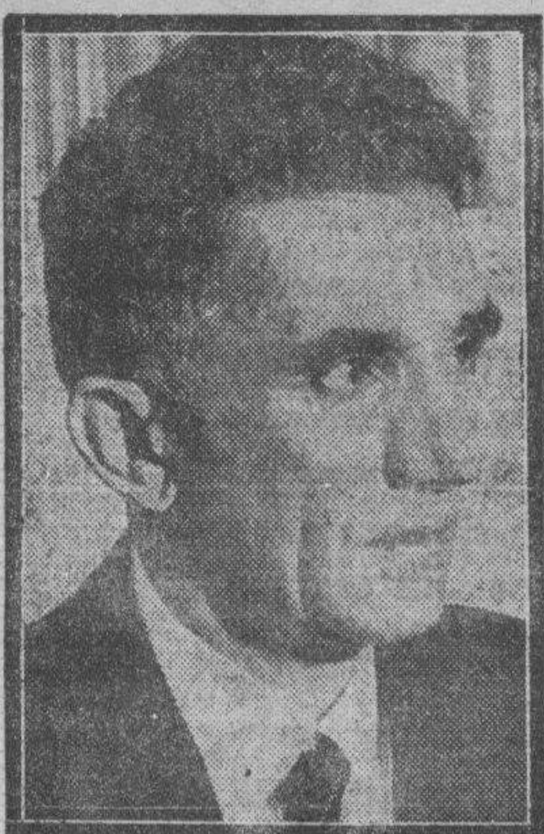
El señor Rico Avella, nuevo Alto Comisario en Marruecos.