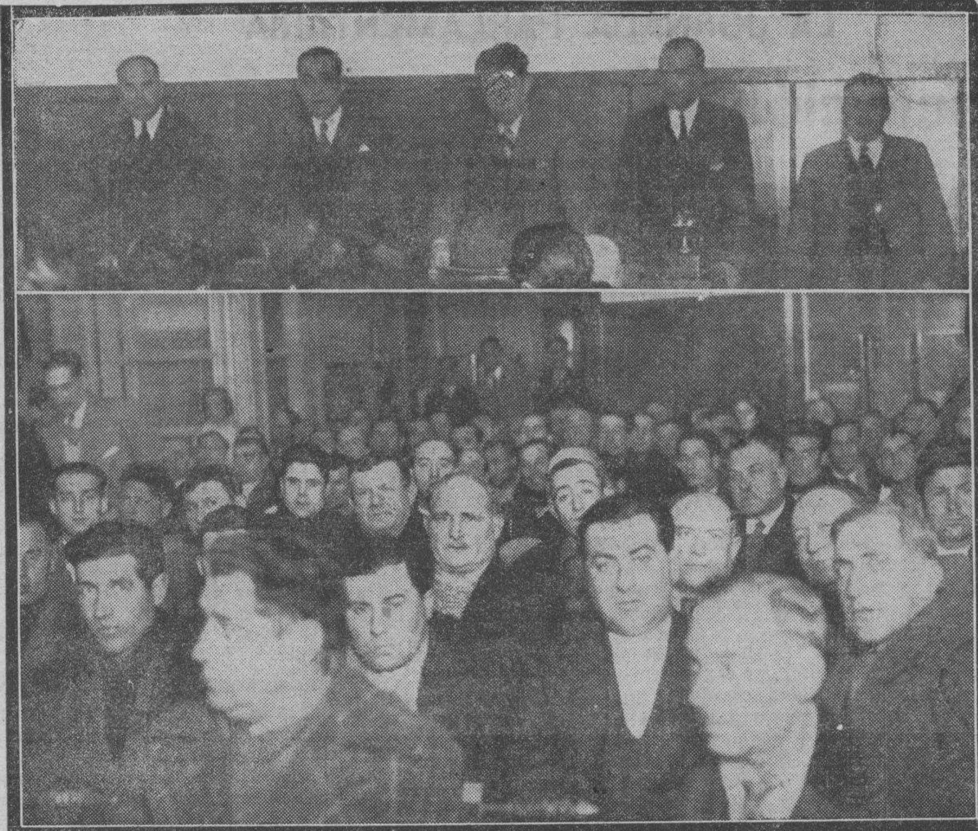
Presidencia de la asamblea y un aspecto del salón.