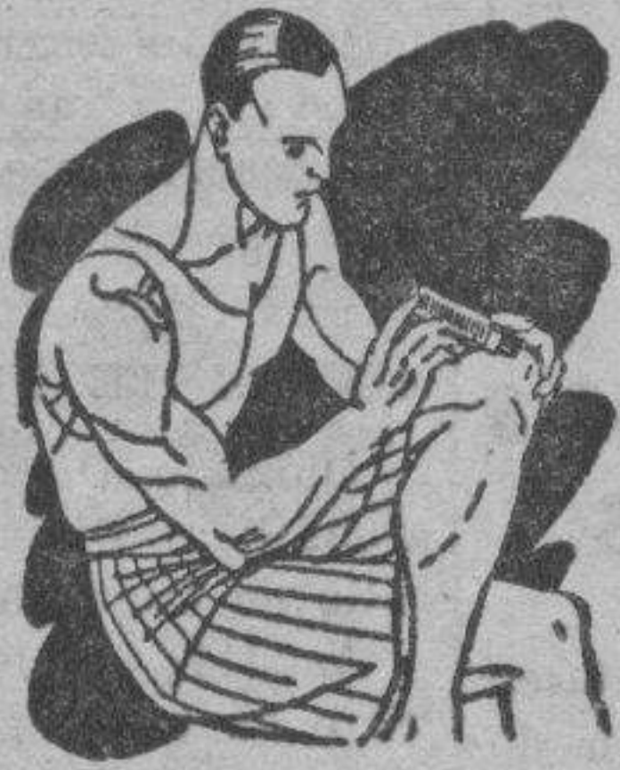
Reuma - Clática Golpes

Preparado en forma de una barrita de facilísimo empleo. Se aplica rápidamente tal como se presenta y sin tener que ensuciar-se las manos.