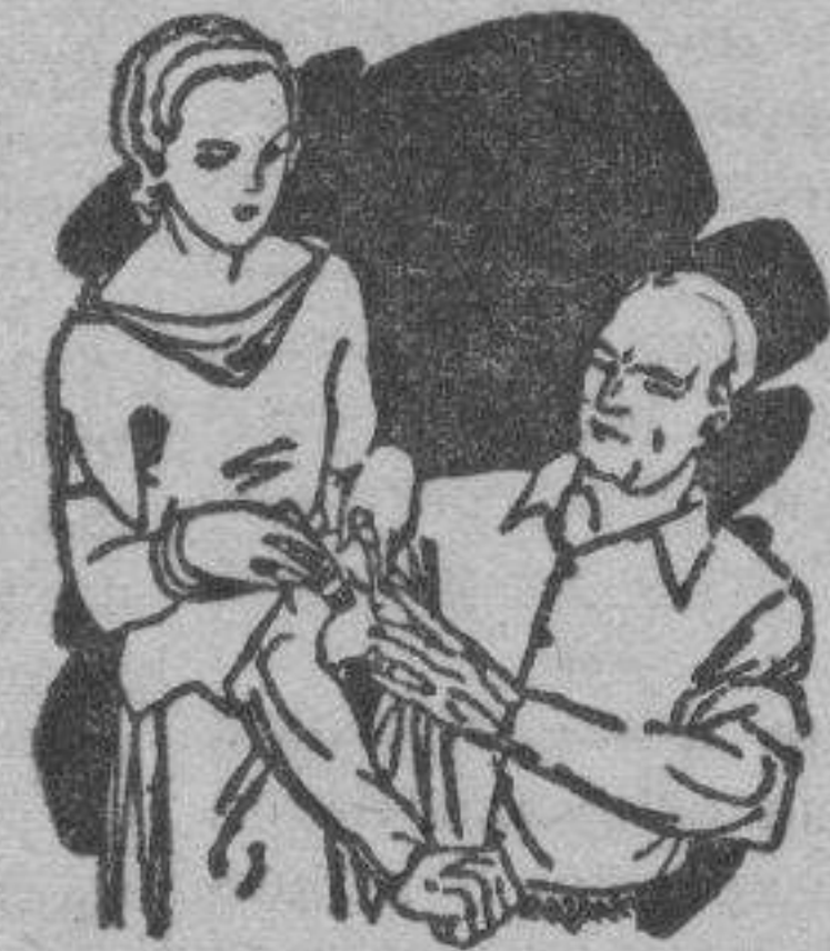
Dolor en las articulaciones Calambres

El LAPIZ TERMOSAN es el Revulsivo más práctico y eficaz contra toda clase de dolores y congestiones.