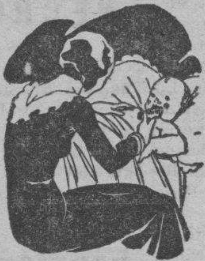
Tos - Catarros - Bronquitis Congestiones