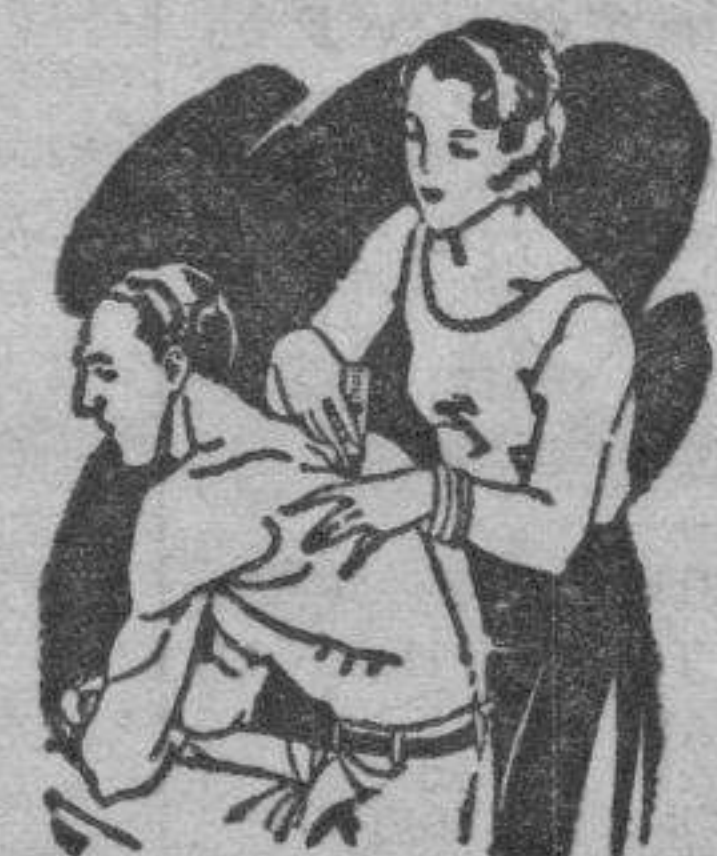
Artritis Dolores de muñeca y brazos Dolores de espalda y riñones

El LAPIZ TERMOSAN se vende en todas las Farmacias y Centros de Específicos a 4'45 pts. el tubo grande, y a 3 pts. el tubo pequeño (Timbres incluidos)