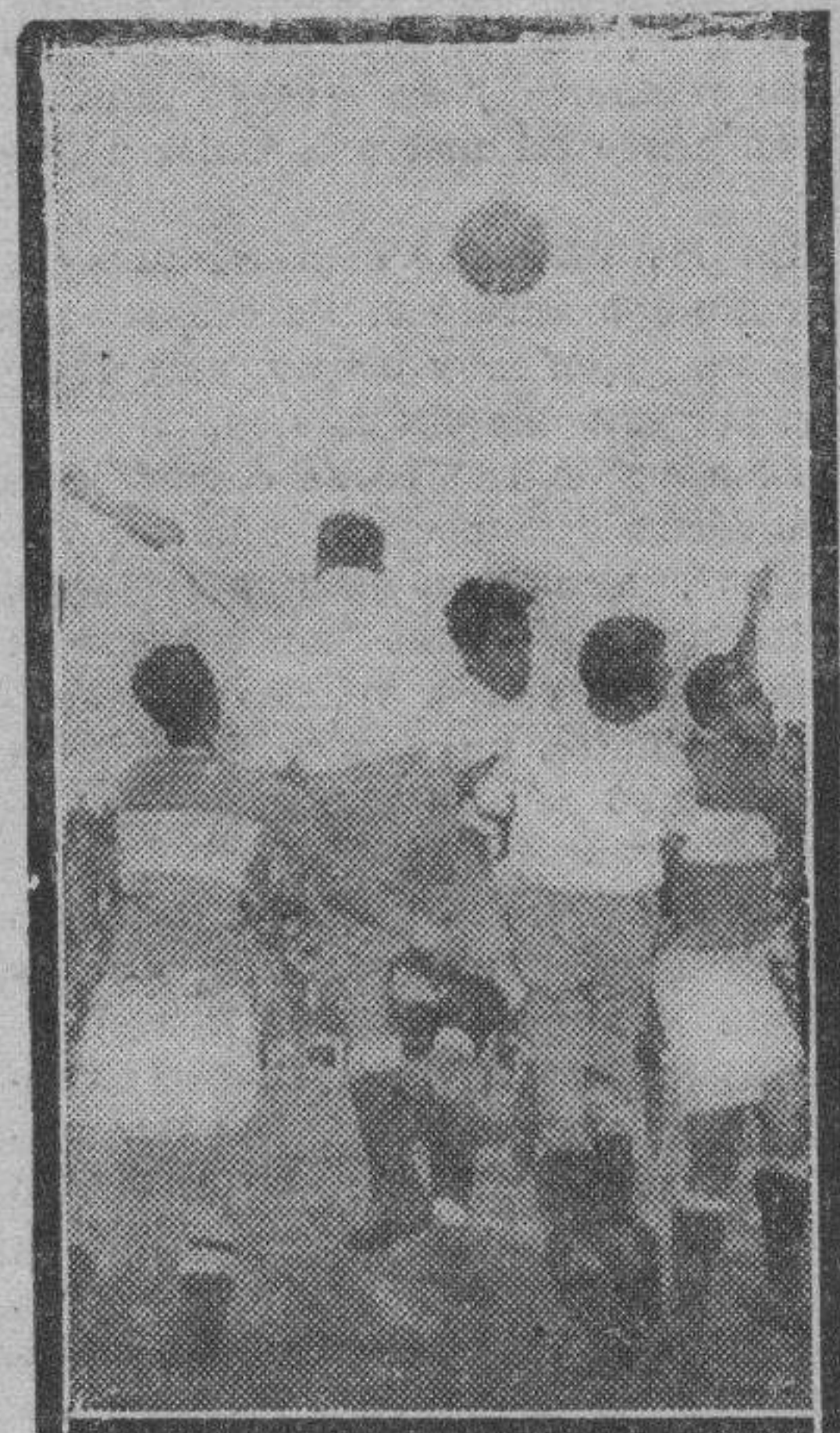
Un balón de los pocos que el domingo se disputaron con coraje en Torrero.

Igual característica tiene la segunda mitad. No se logra el tanto de la victoria hasta pocos minutos antes del fin del encuentro, siendo Arteché, al rematar a la media vuel-