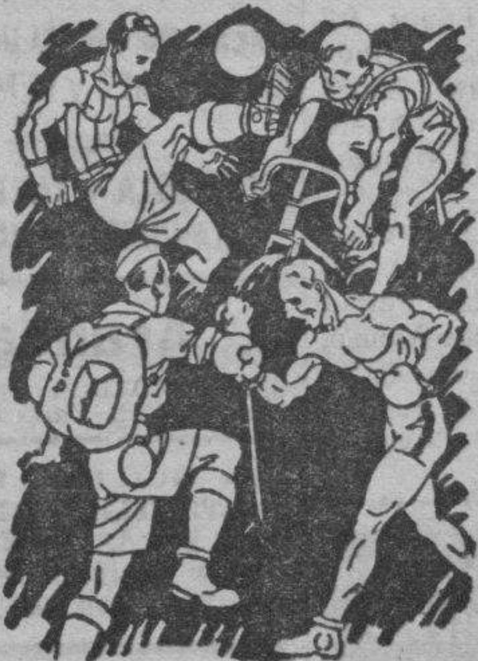
Indispensable para toda clase de sports. No ocupa sitio ni es frágil