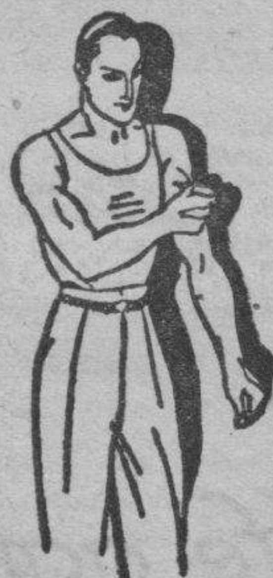
Fatiga muscular Golpes-Torceduras