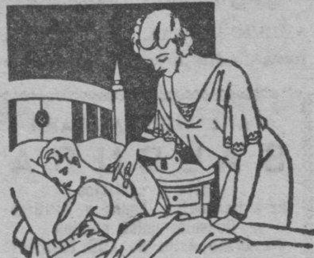
Resfriados - Asma - Pleuresias Congestión pulmonar