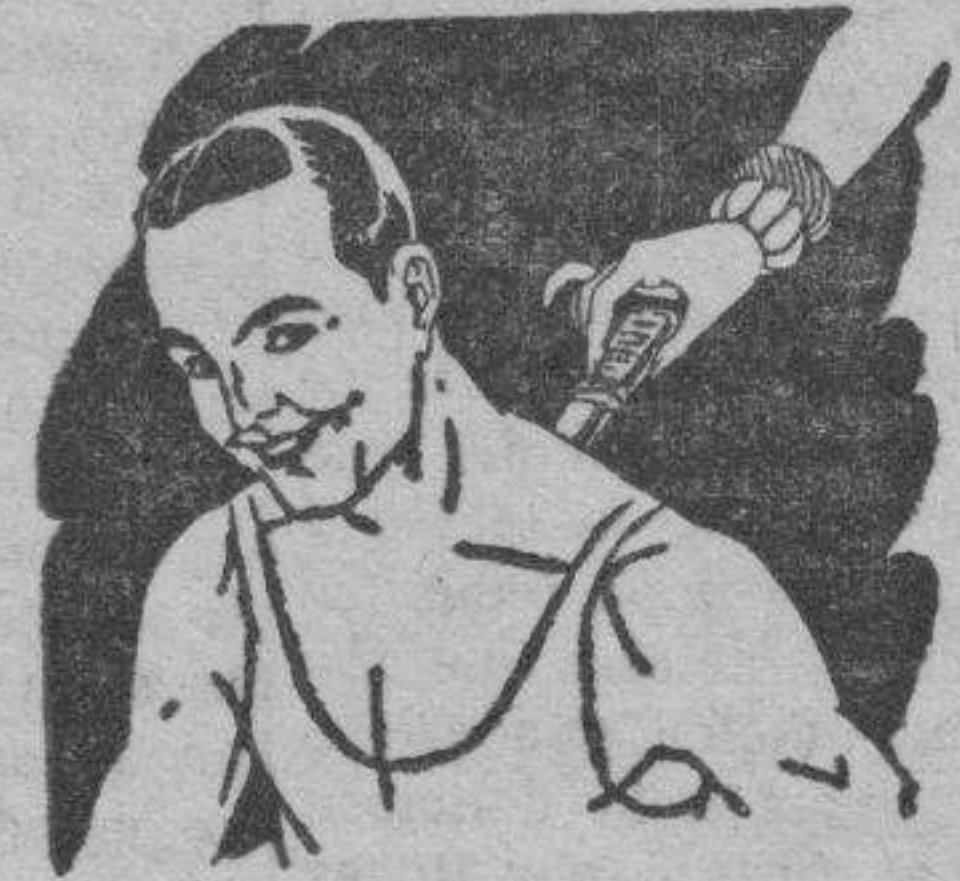
Rigidez del cuello Torticollis