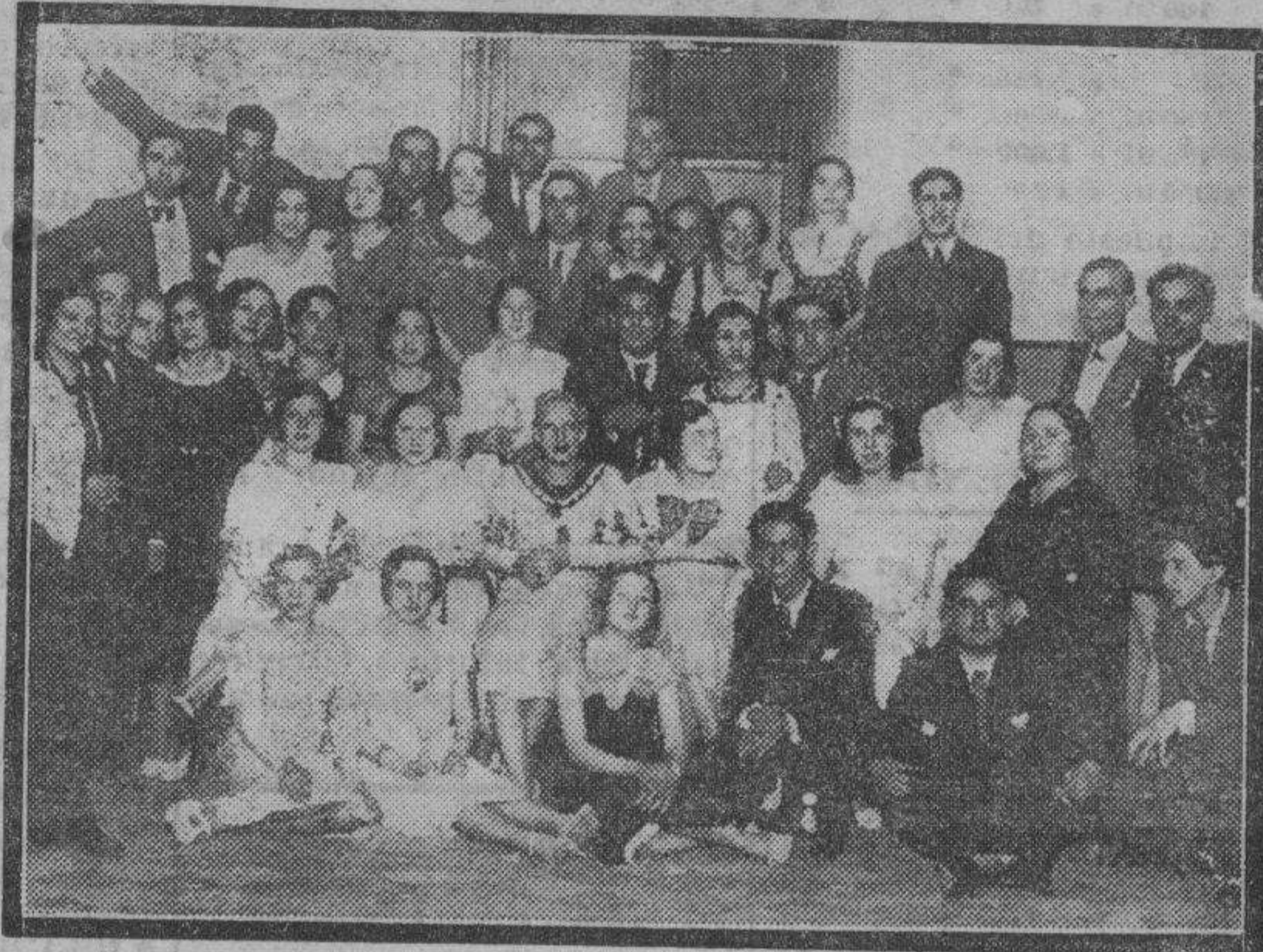
Selecto grupo de gente joven que asistió a la fiesta celebrada anteanoche en el Casino Español, con motivo del concurso de peinados, al que concurren numerosas señoritas.