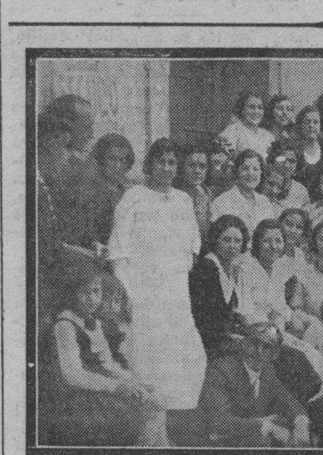
CASTEJON (NAVARRA). — Grupo de bellas muchachas que han dado gran realce a las pasadas fiestas patronales, celebradas con el esplendor tradicional.