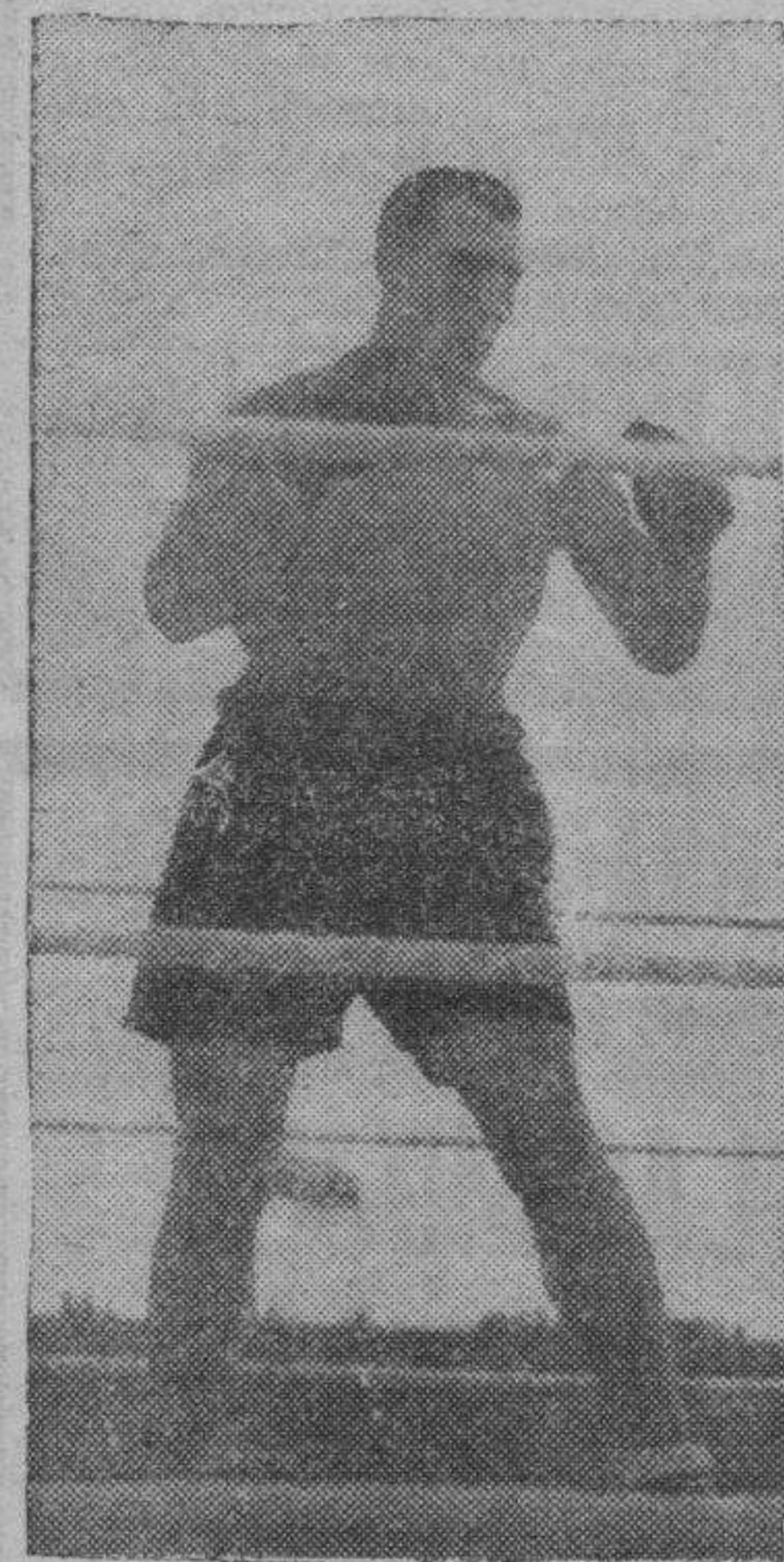
He aquí una "pose" del nuevo campeón mundial del peso máximo. Para quienes creían que era un negado en el arte de los puñetazos queda ese k. o. que ha desposeído del título a Sharkey, nada menos que los paisanos e idólatras de éste

Primer asalto. — Previo unos tanteos, Sharkey coloca tres golpes a la cara y al cuerpo de Carnera, quien contraataca acosando con va-