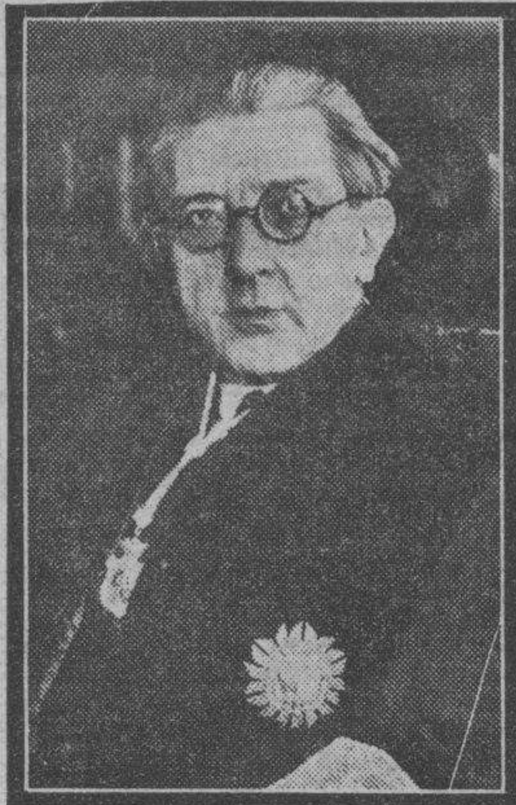
El nuevo fiscal de la República, señor Anguera de Sojo, después del acto de su toma de posesión.

El resultado de las diligencias de hoy permite al señor Llido mostrarse optimista, pero no creía prudente mostrarse más explícito por no retrasar el éxito del sumario. — LA CASA.