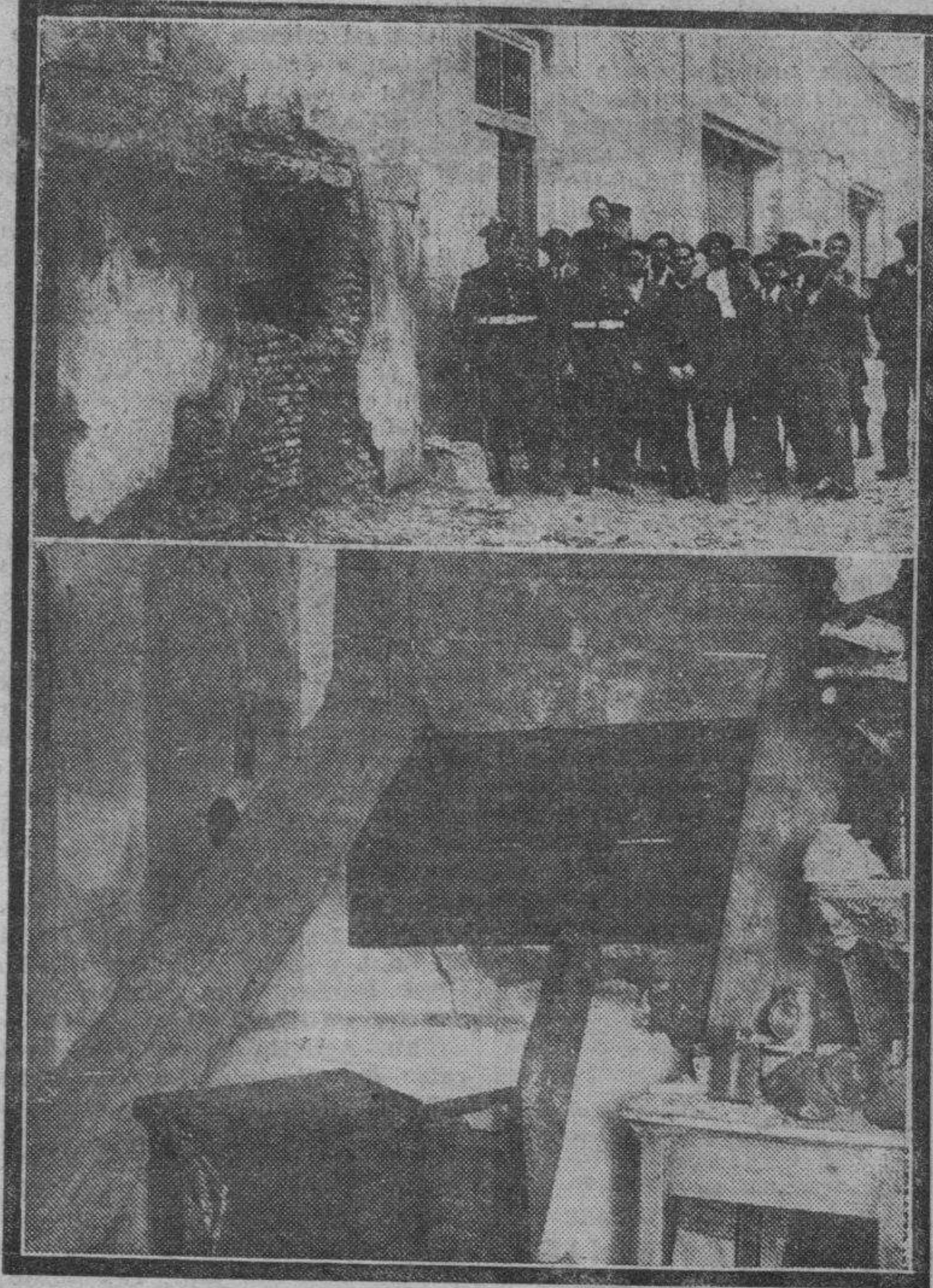
Efectos que produjo el artefacto que estalló en la ventana de una casa del paseo de Sasera a última hora de la tarde del lunes. Arriba: Fachada del edificio. Abajo: Interior de la cocina.

Hubo carreras y acudieron buen número de funcionarios de Vigilancia y guardias de Asalto con sus jefes respectivos.