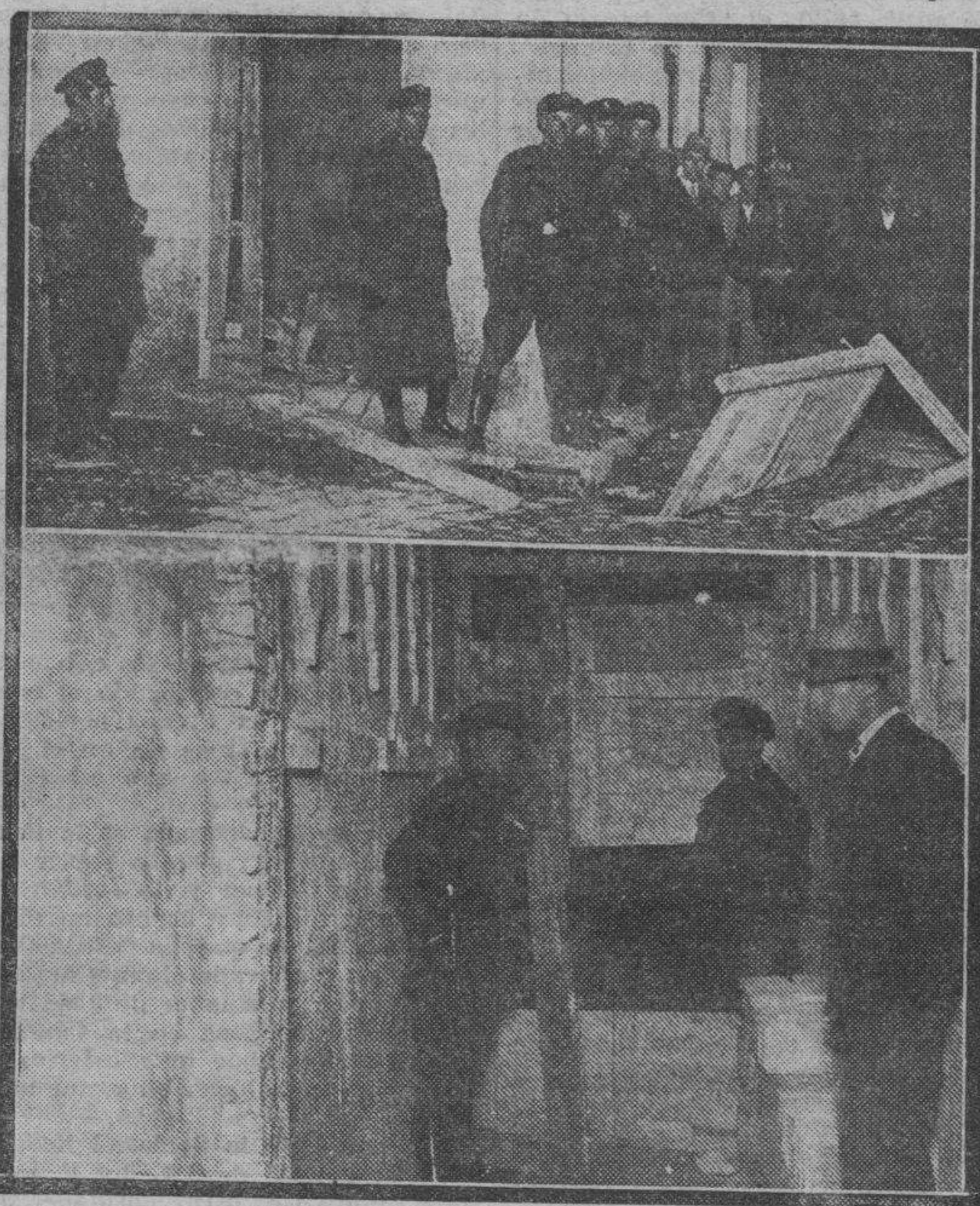
Aspecto interior y exterior de la casa en construcción de la calle de los Graneros, poco después de ocurrir la explosión de un proyectil de Artillería, en las primeras horas de la noche del lunes.