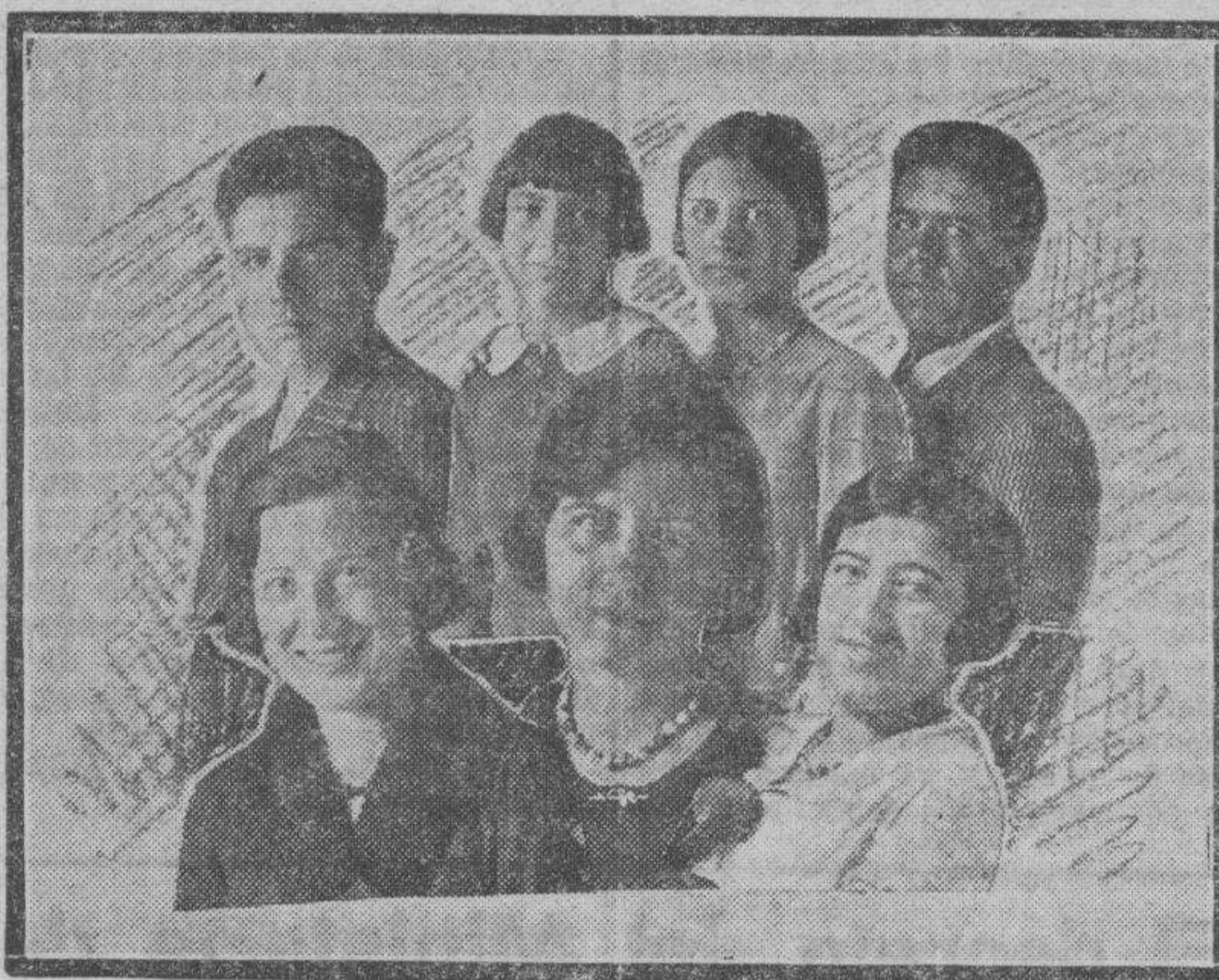
Rostros con la alegría festera riendo en los ojos. Son fisonomías logradas por el fotógrafo Carceller, en las fiestas de Uncastillo.

El día 17 se presentó por segunda vez la Compañía de circo y por la noche dieron fin estas alegres fiestas con baile público, donde la animación no decayó ni por un momento, a pesar de los diez días que llevamos de constante ajeteo, y más que terminar... parecía que comenzaban.—ALFONSO GOMEZ.