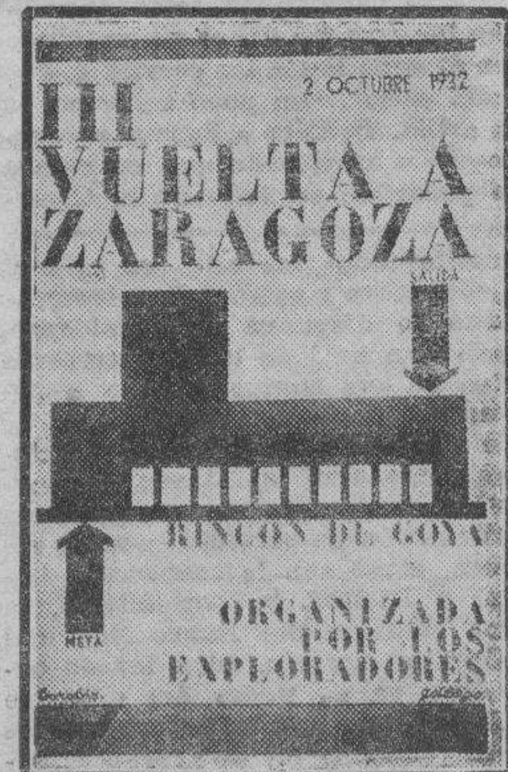
Cartel anunciador de la III Vuelta a Zaragoza, gran prueba pedestre organizada por los Exploradores.