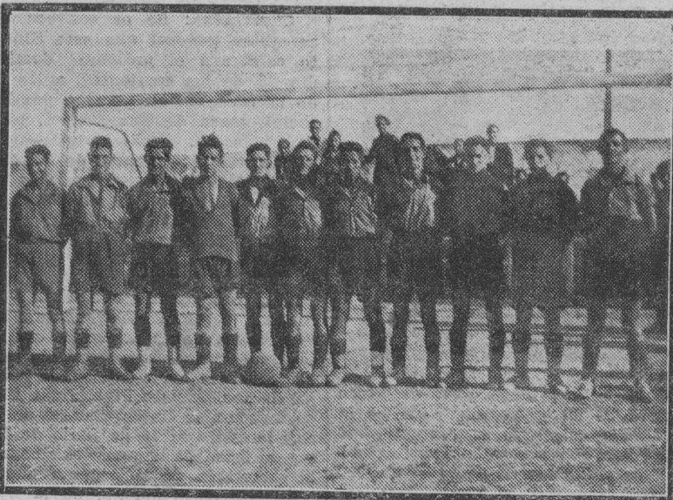
Los muchachos que constituyen el equipo infantil del C. D. Unión Victoria, campeón en el torneo de esa categoría, organizado por el C. D. Español, de Zaragoza.

Esta circunstancia fué la que ocasionó una discusión de aeronautas norteamericanos el verano pasado. En el Concurso Internacional anterior, debido en gran parte a las condiciones económicas y a los grandes gastos que los países competidores tenían, hubo solamente seis inscripciones para las carreras, de las cuales dos eran