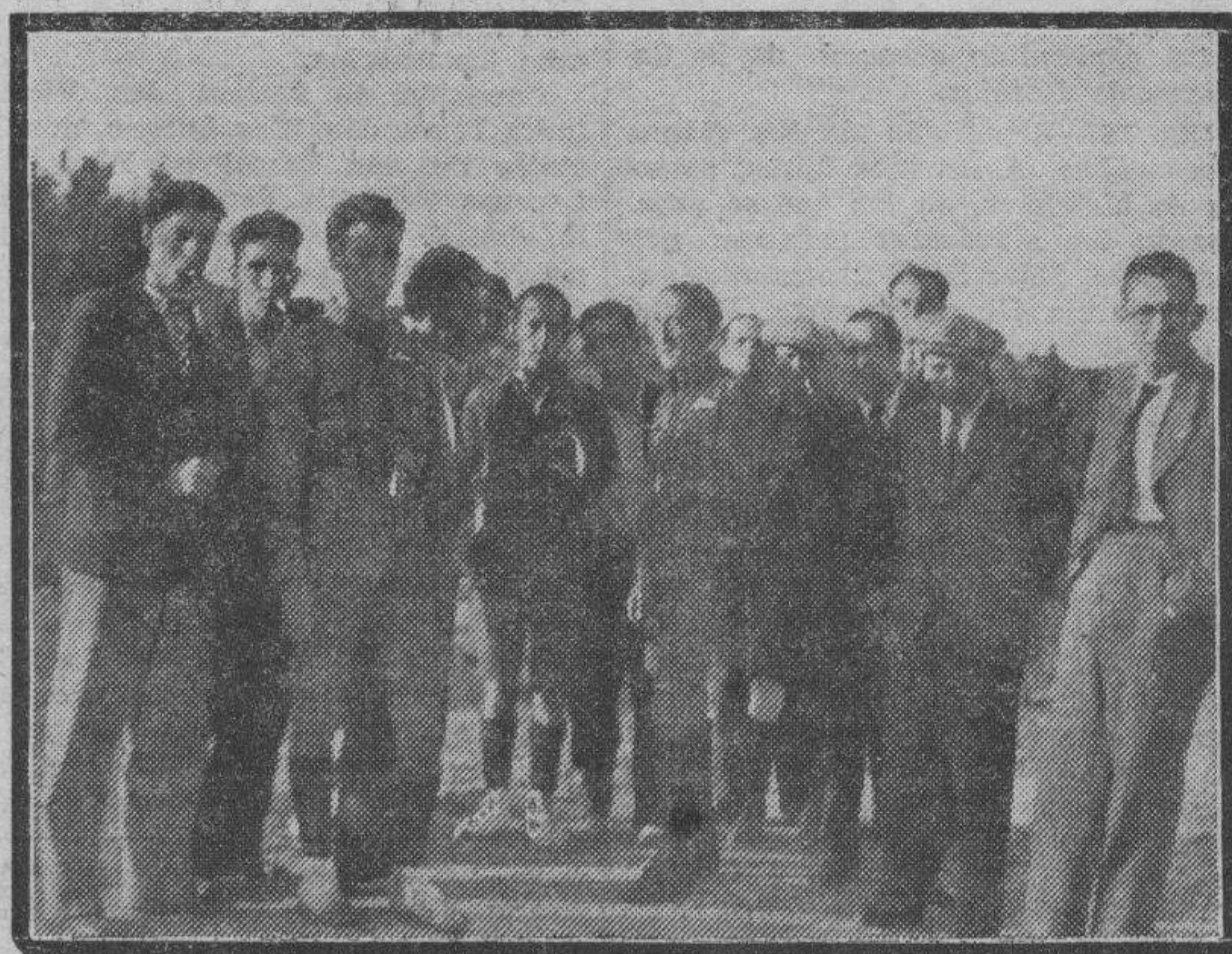
TERUEL. — Los andarines conquenses que hicieron el viaje Cuenca-Teruel en dos etapas, rodeados de un grupo de deportistas terulenses momentos antes de llegar al término de aquel "pasetto".

La absoluta independencia política de este periódico le permite el sereno enjuiciamiento de cuantos hechos se producen, sin sometimientos a banderías de ninguna índole.