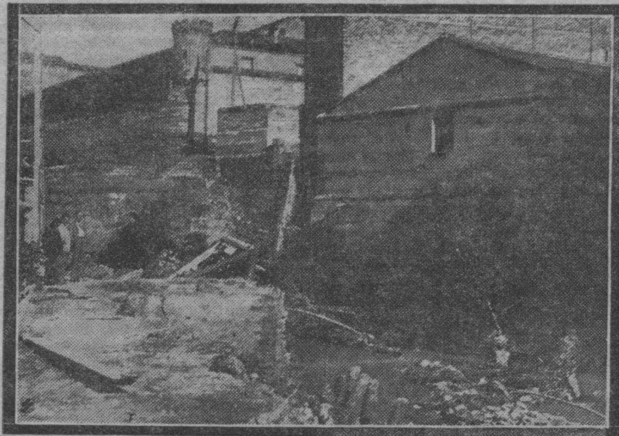
En la fotografía puede apreciarse perfectamente los terribles efectos causados por la inundación en el cauce y márgenes del Huerva a causa del temporal de lluvias sufrido estos días pasados. El lugar reproducido en la foto es el correspondiente a la fábrica de regaliz.

Una excelente cosecha de cereales estaban a punto de coger los cultivadores de Arándiga