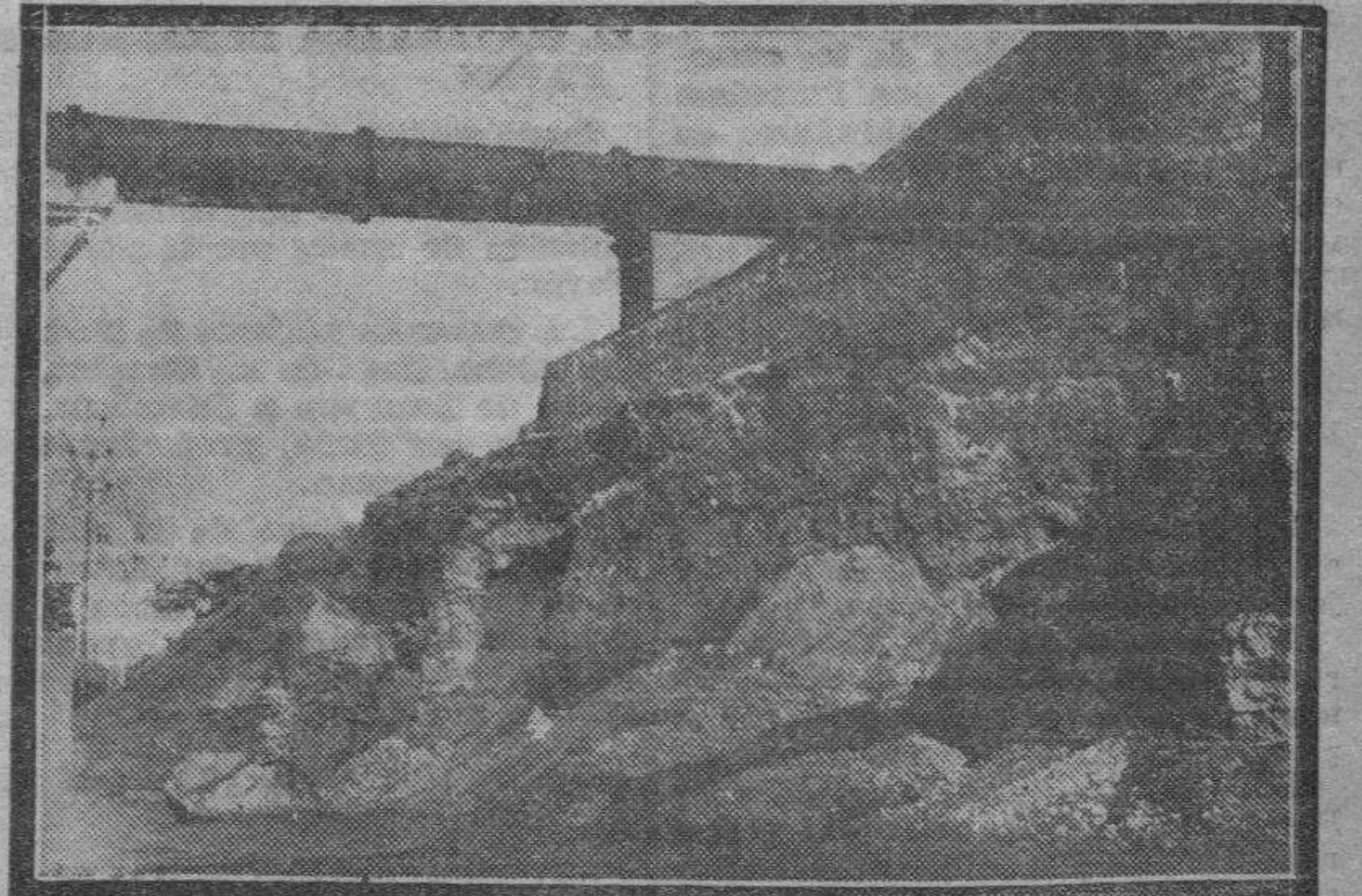
El tubo protector de los cables de energía eléctrica que conduce la electricidad a la vasta barriada del otro lado del Huerva, ha quedado totalmente descubierto a consecuencia de la gran avalancha de agua que ha arrastrado la tierra de las márgenes.

damiento de los tres barrancos que afluyen a calles de Morata de Jalón. Especialmente la calle Mayor de Morata, donde afluyen tres barrancos, ha quedado intransitable.