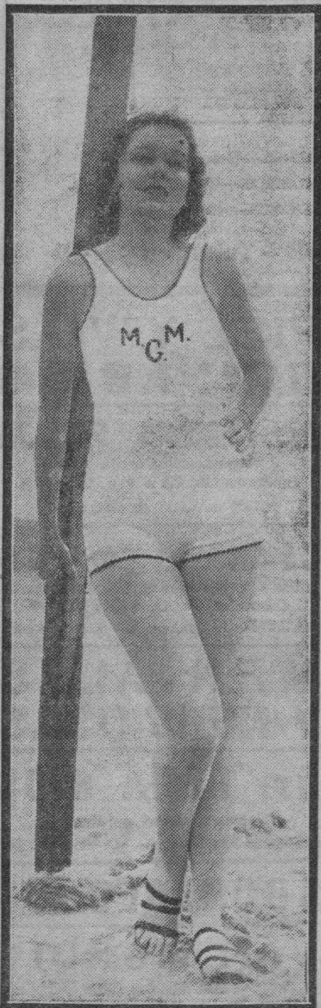
Maureen O'Sullivan, damita de la M. G. M., que está... bueno, que está descansando en la playa. Y no decimos más; el público se encargará de decir lo que guste, porque nosotros... ¡a descansar!