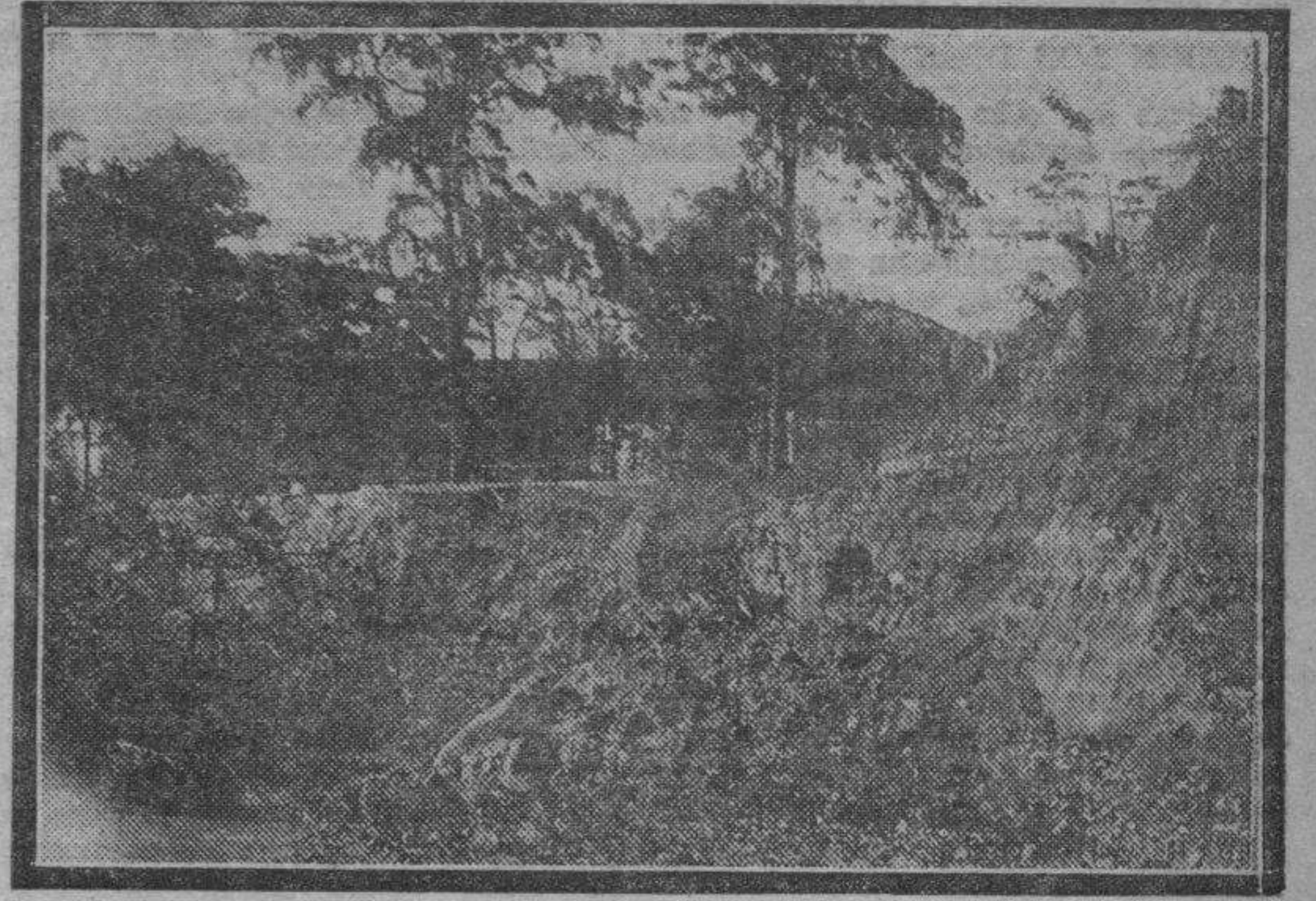
Estado en que ha quedado el camino que conduce a la fábrica de regaliz, situada al otro lado del Huerva, después de la gran avenida sufrida en el cauce del río el pasado miércoles. Como puede apreciarse, el camino ha quedado cortado por las aguas en un gran trecho.

El agua, con impetuosa corriente, arrastraba las mieses y cuanto se oponía a su paso.