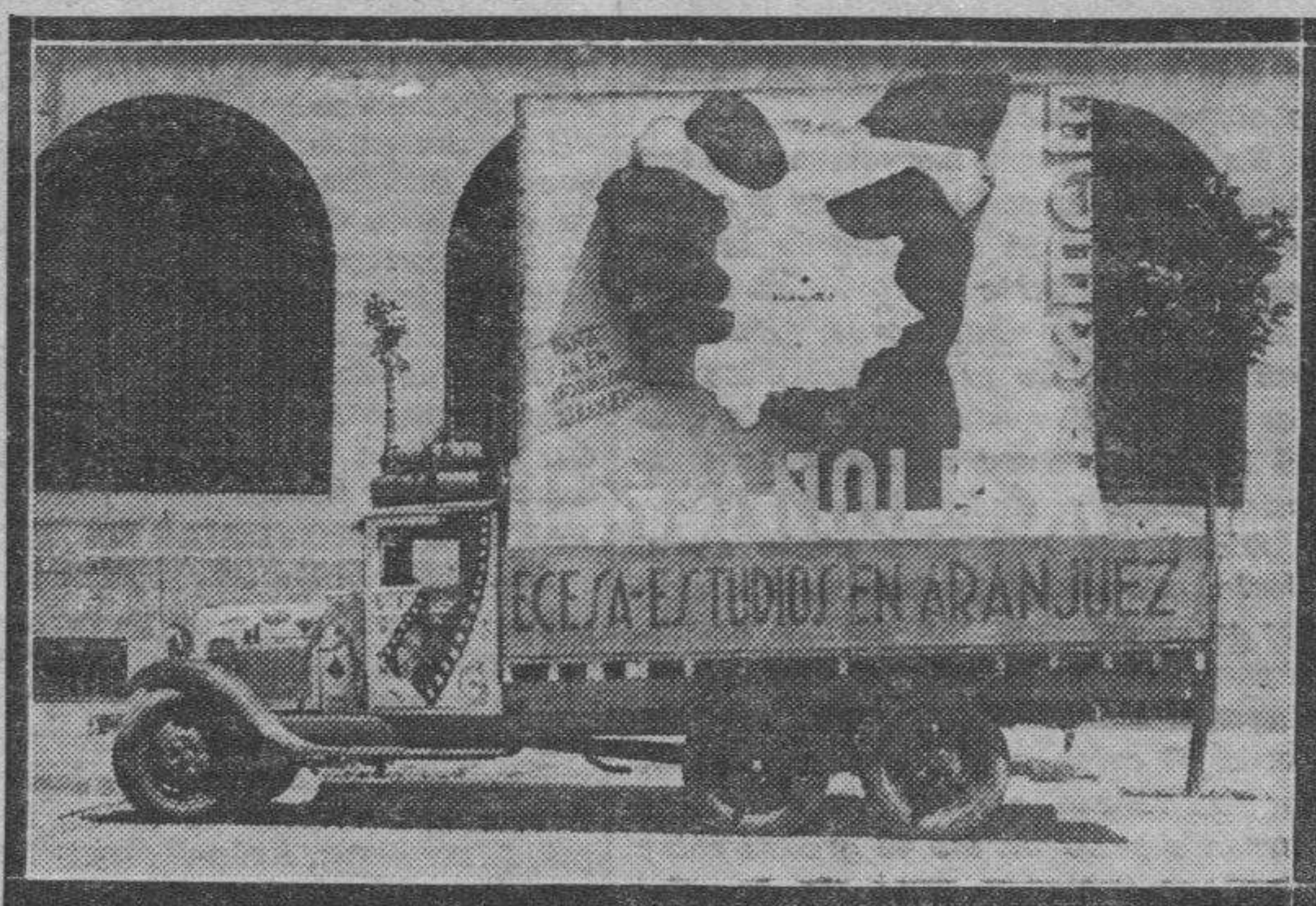
El camión en cuyo interior hay una casa ambulante, la de los señores Miquel y Viola, que van en viaje de propaganda de la cinematografía española.