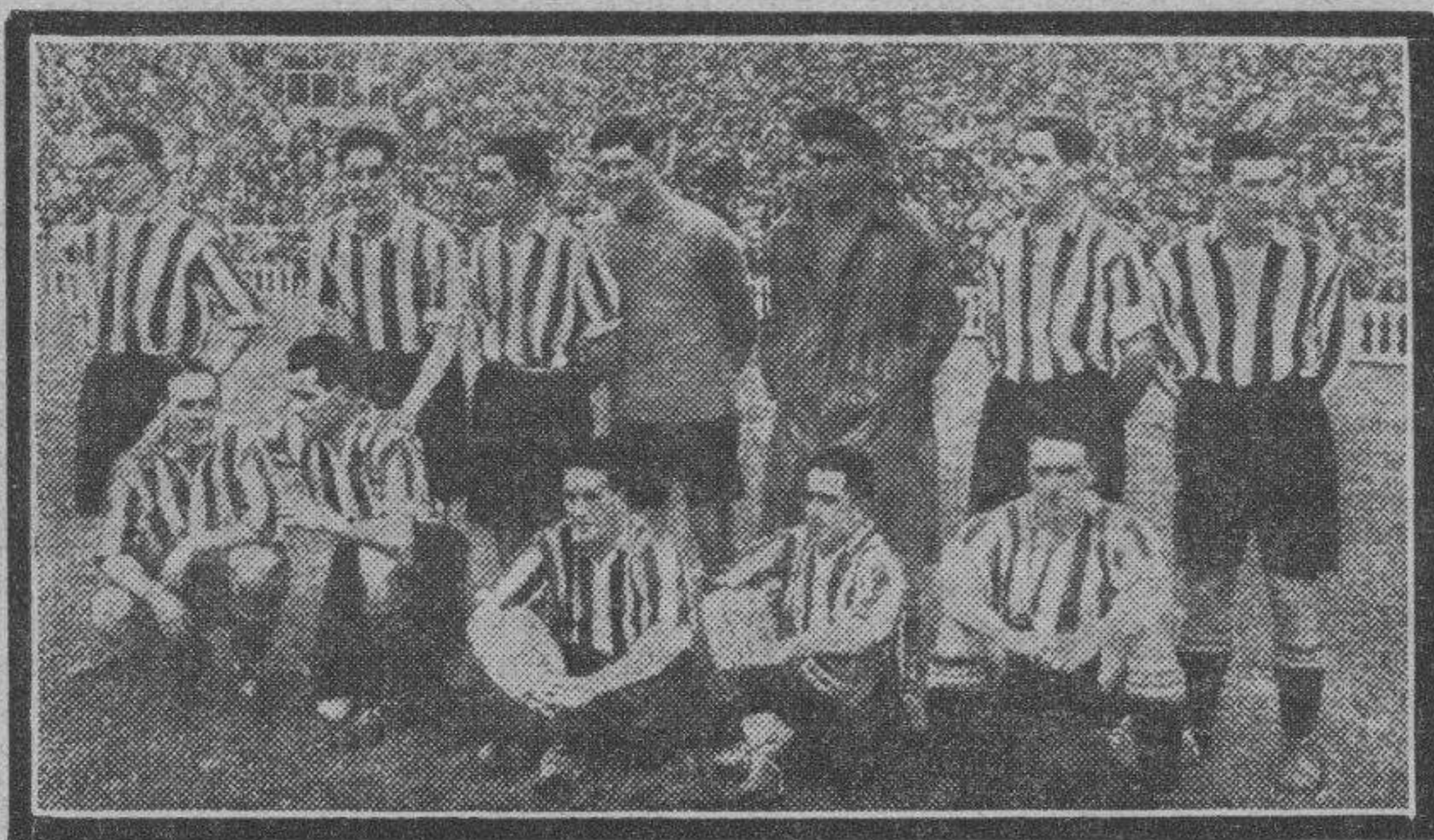
Después de su copiosa victoria sobre el Español, el Athlétic bilbaíno puede ya considerarse como finalista en el campeonato "Copa de España".

a lo contrario, comienza a realizar avances de gran ímpetu y durante algunos minutos presiona fuertemente. Da la impresión de gran contrincante y el gran dominador además. Frente a la meta se estrellan todos los esfuerzos. En varias ocasiones vemos a Blasco titubear y producen las jugadas emoción, pero no traen resultado positivo, pues los tiros siguen siendo lamentables.