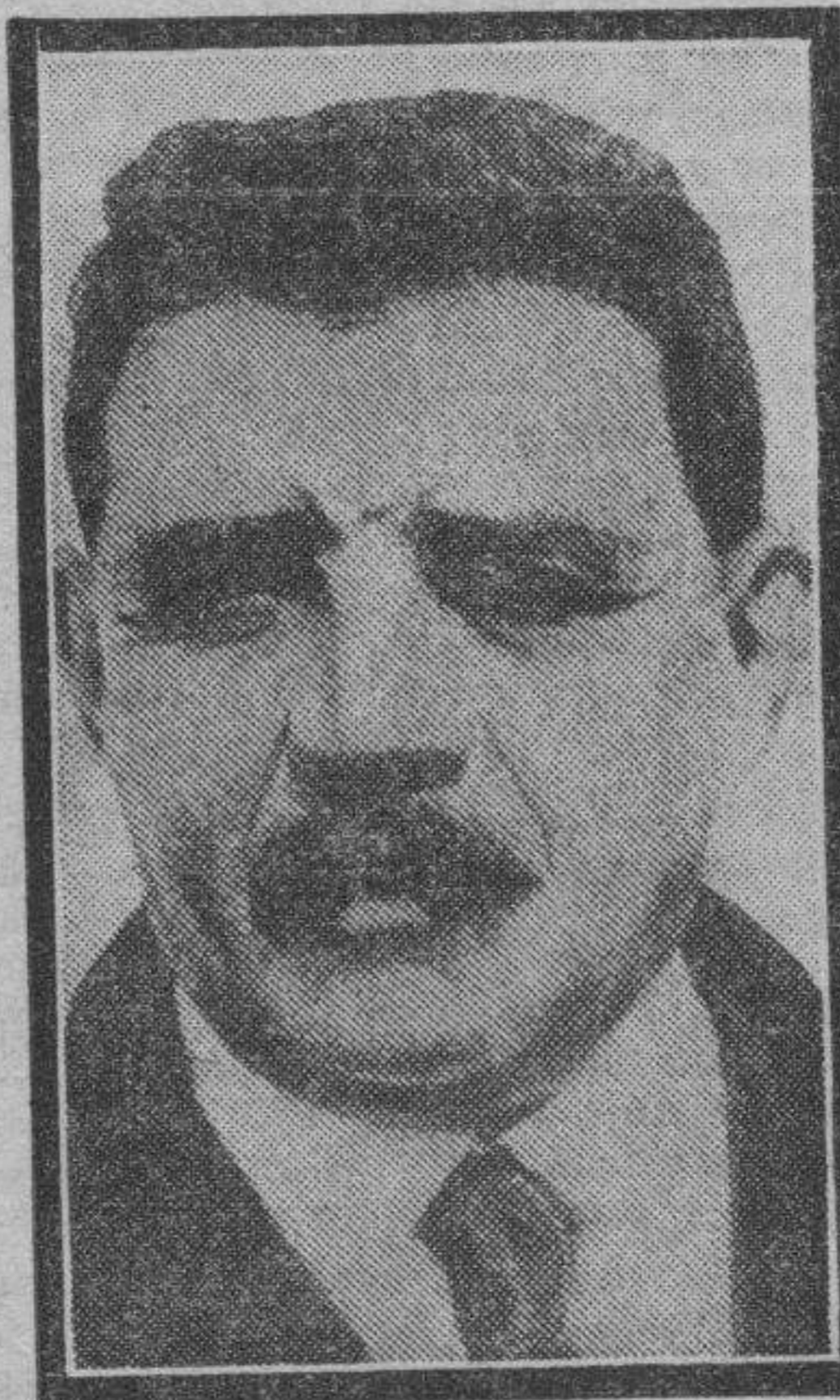
Monsieur Herriot, presidente del nuevo Gobierno francés, que hoy, martes, va a presentarse ante las Cámaras.