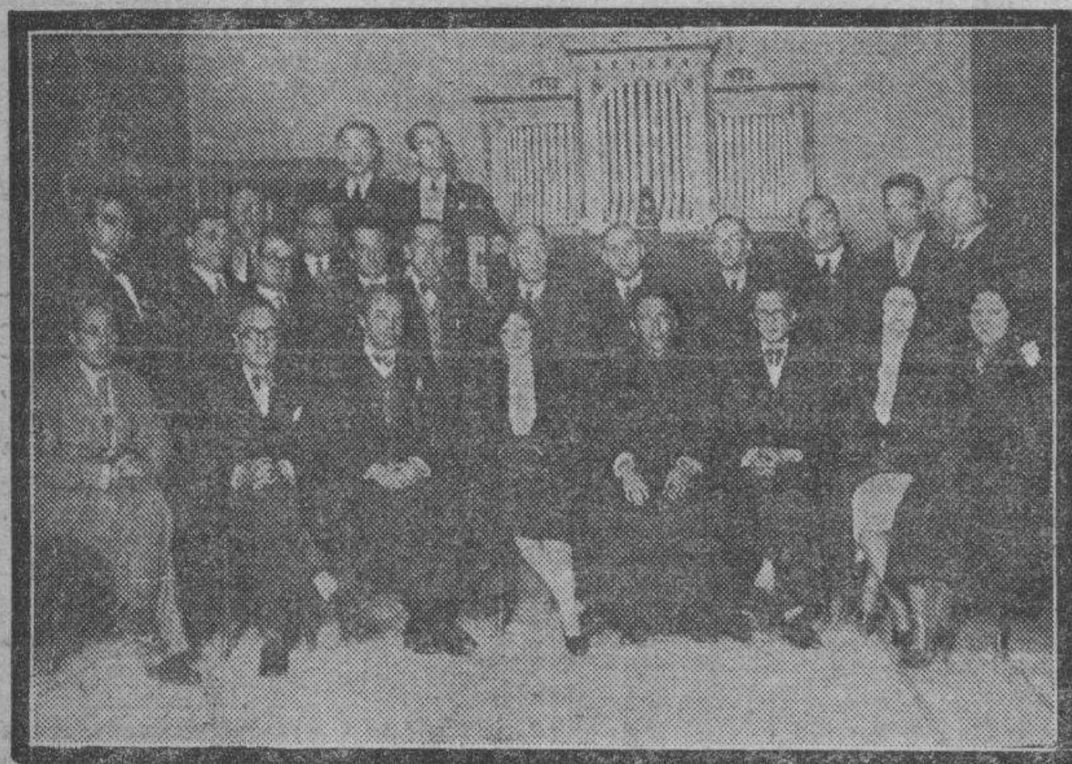
Grupo de invitados al acto inaugural de los locales del Conservatorio Aragonés de Música y Declamación, con el claustro de profesores del mismo.

En sus magníficos locales de la calle de Méndez Núñez, número 38, tuvo lugar ayer tarde la inauguración del Conservatorio Aragonés de Música y Declamación.