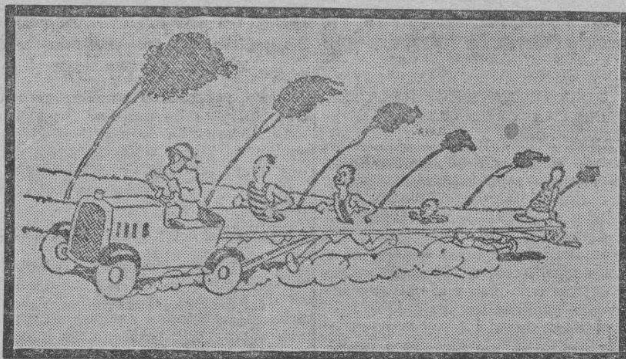
Nuevo método de entrenamiento para corredores pedestres.

Ahí está el más popular de los deportes, el fútbol, arrojando un balance con déficit. Déficit deportivo, déficit —muy lamentado ¡ay! por los clubs lanzados de lleno en el camino