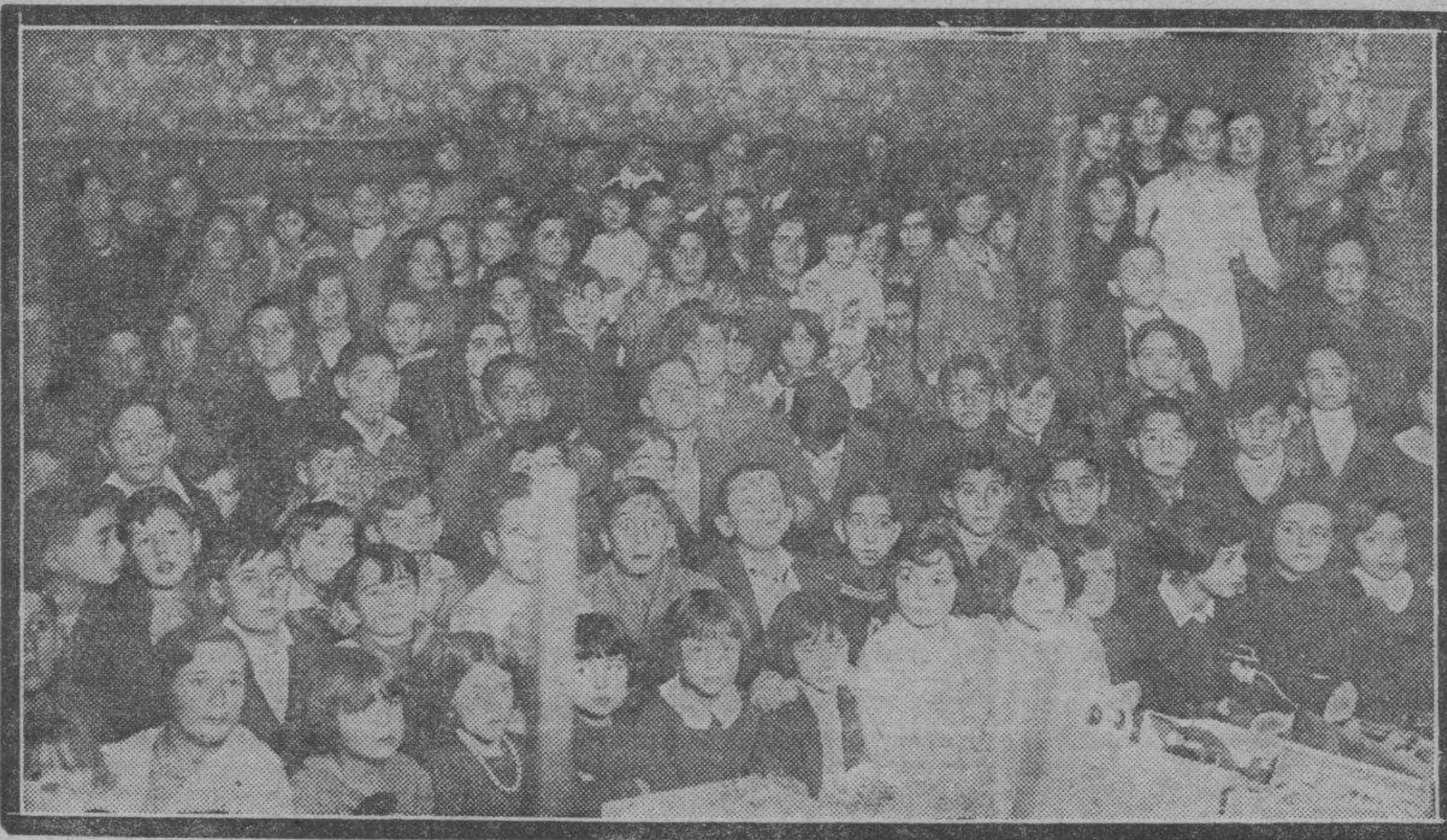
Niñas y niños que asisten a las escuelas que sostiene el Centro Ferroviario del Norte, poco después del reparto de juguetes verificado ayer.