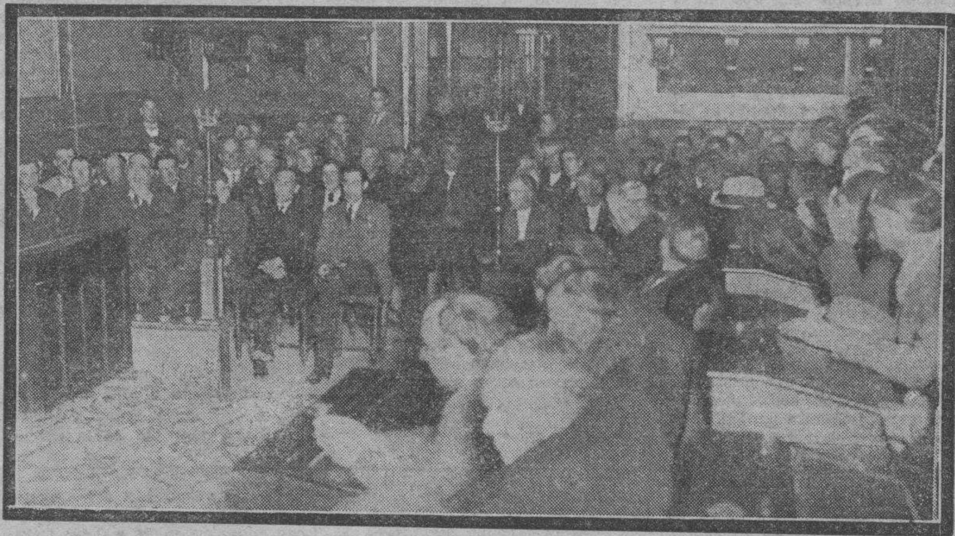
Un aspecto del salón de sesiones de la Diputación provincial durante el acto vitícola.