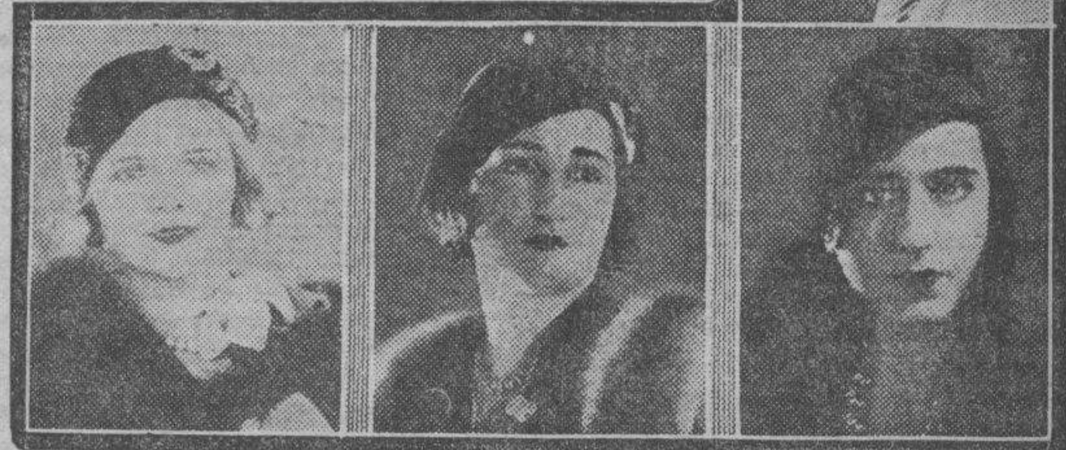
Algo de dulce exotismo tiene este bonito gorro, hecho de pallason negro, distinción y elegancia sobria en la fórmula del modelo que lleva esta señorita. Esta señorita realza su belleza con un modelo ideado en "taupé" color negro. Igual consecuencia con la moda se observa en este — el de arriba — sombrero color gris perla con una pluma del mismo tono.

Infiere ella las saludables caracterizaciones de un oasis apacible en mitad del desierto moral en que actualmente se halla buena parte del mundo. Debemos, pues, acoger con nuestro mejor entusiasmo todas estas exhumaciones del pasado. Poco importa que algunas no consulten por completo nuestros gustos. La intención que las provoca es noble; ello debe bastarnos por ahora.