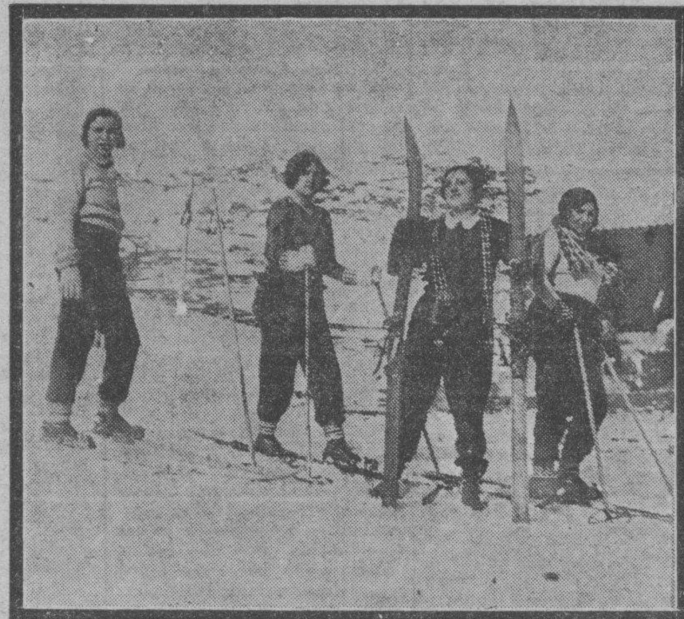
Un grupo de bellas esquiadoras, entregadas a la práctica del deporte alpino en las pistas pirenaicas, disfrutando de las delicias del último domingo primaveral con que la Naturaleza nos obsequia en los comienzos del año.