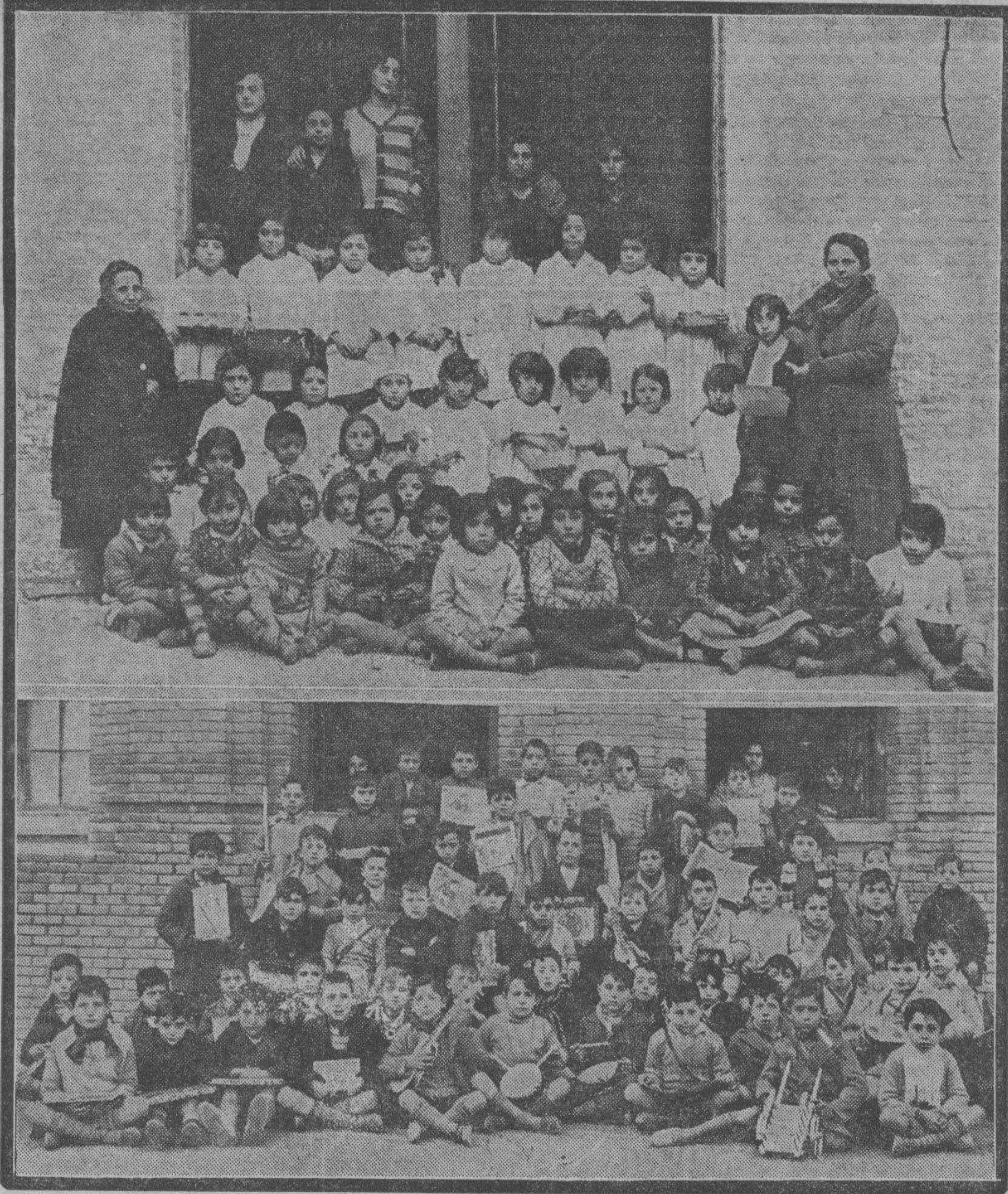
Arriba: Un grupo de niñas de la escuela de San Agustín, posando después del reparto de juguetes verificado ayer mañana bajo los auspicios del Ayuntamiento. Abajo: Un numeroso grupo de niños del grupo escolar de Gascón y Marín, recibiendo los juguetes con que fueron obsequiados ayer.