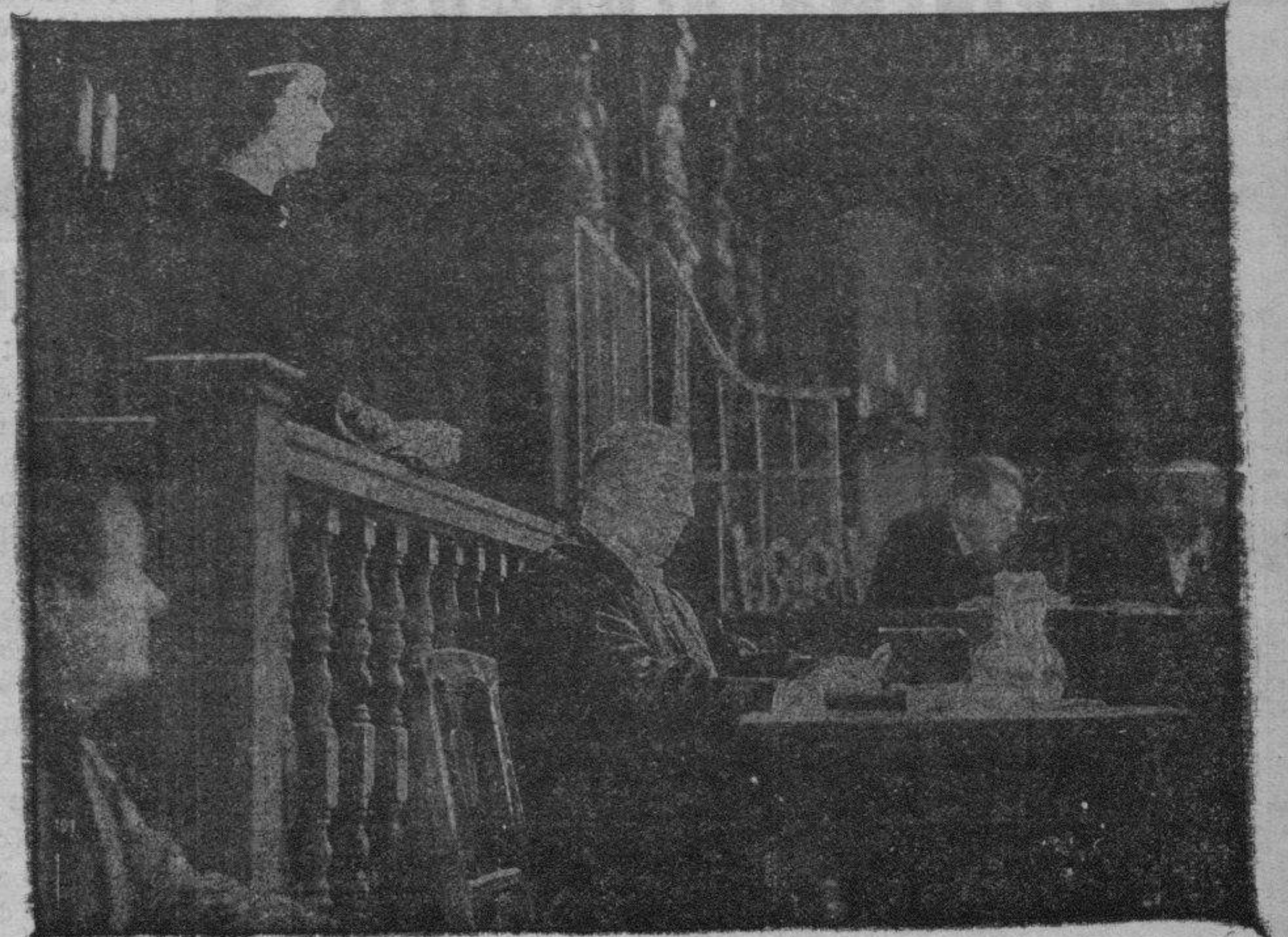
I. — Una interesante escena de la película "El sargento Crischa", adaptación cinematográfica de la novela de Arnol Zweig, que tanta sensación produjo en Europa y América, es esta película un documento de inestimable valor, que describe, con pinceladas maestras, el horror y crueldad de la guerra, desarrollándose al mismo tiempo una conmovedora historia de amor y abnegación, interpretada por Chester Morris, Betty y Jean Hersholt. II. — Una escena de la película de la Casa Cines, titulada "Hay una mujer", e interpretada admirablemente por Iván Petrovich y Lill Dagover. De estas películas es de esperar un pronto estreno en nuestra ciudad.