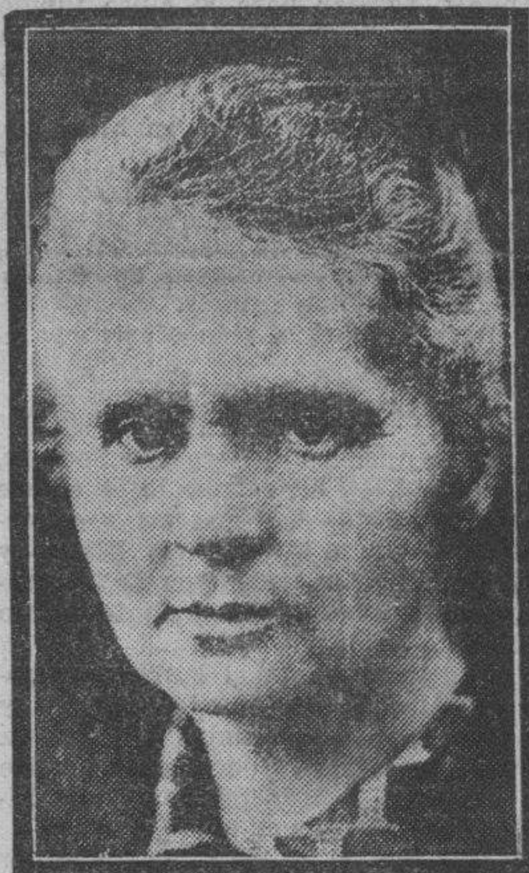
La ilustre inventora madame Curie, que ha llegado a Madrid para dar dos conferencias científicas.