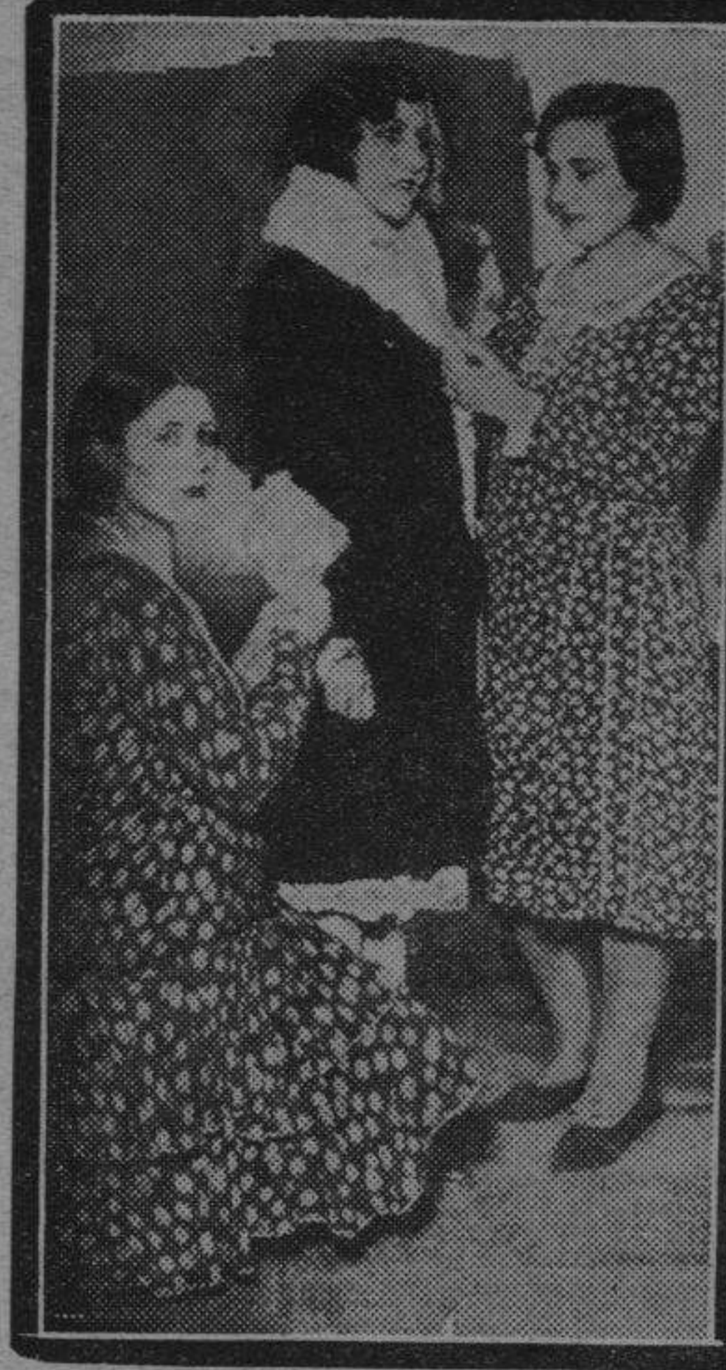
Es preciso un maniquí de la belleza de ésta y unas maestras como las que prueban la prenda, para que el abrigo adquiera la exquisita feminidad que requiere.

En este mismo inmueble se encuentra la Unión General de Trabajadores,