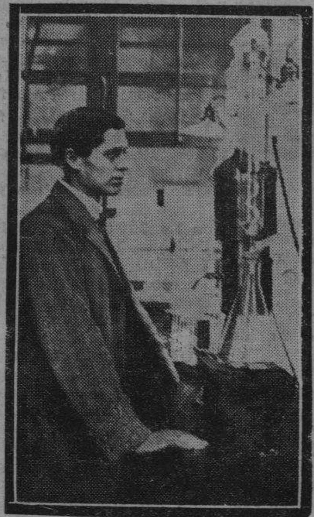
El hombre que ha salvado al mundo la obra póstuma de Andrée. El profesor Hertzberg de Upsala, Premio Nobel, hombre de fama mundial.

Aunque la concurrencia de artistas al II Salón no fué lo numerosa que hubiera sido de desear, en el más importante certamen artístico regional se exhiben hasta 130 obras, de cuyo mérito hablaremos en días sucesivos.