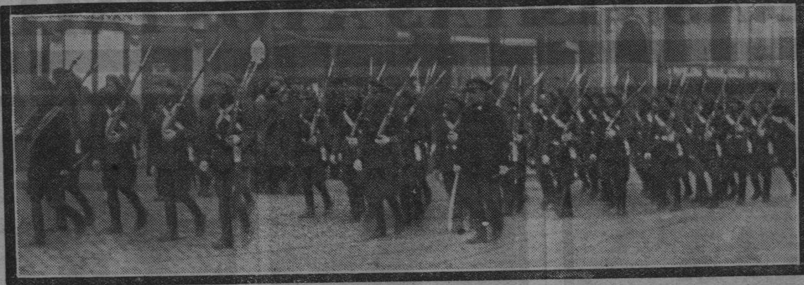
Con motivo de la festividad de Santa Bárbara, las tropas del Arma de Artillería desfilaron por las calles de la ciudad, dando una nota de marcial colorido.