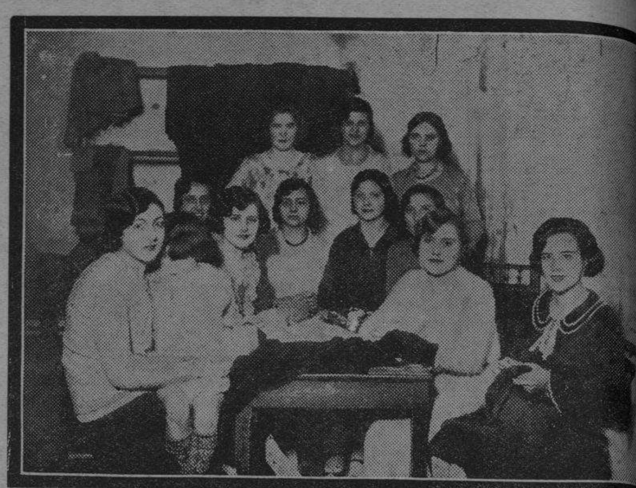
Ahora es el momento de trabajar, y las modistas ponen todo su entusiasmo en la delicada faena confiada a sus habilidosas manos.

En la fecha citada actúa en el teatro del Paseo un cuadro de variedades. A su cargo corre, pues, una gran parte del programa. Y de fijo que ha de ser grato a las modistas, pues hay en ese cuadro números de verdadera atracción, entre ellos el de esos inmensos clowns que se llaman Pompof