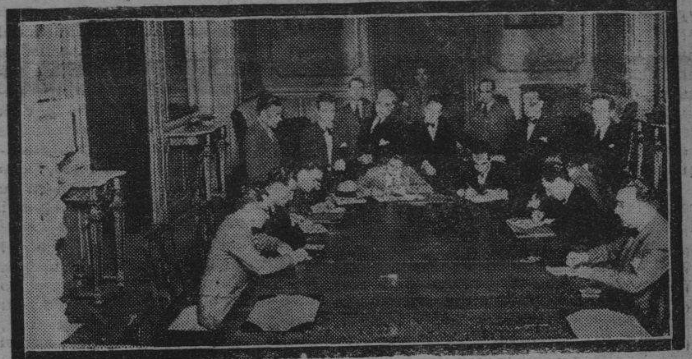
Los periodistas en la mesa de trabajo donde hacen su información antes de ser recibidos por el presidente.