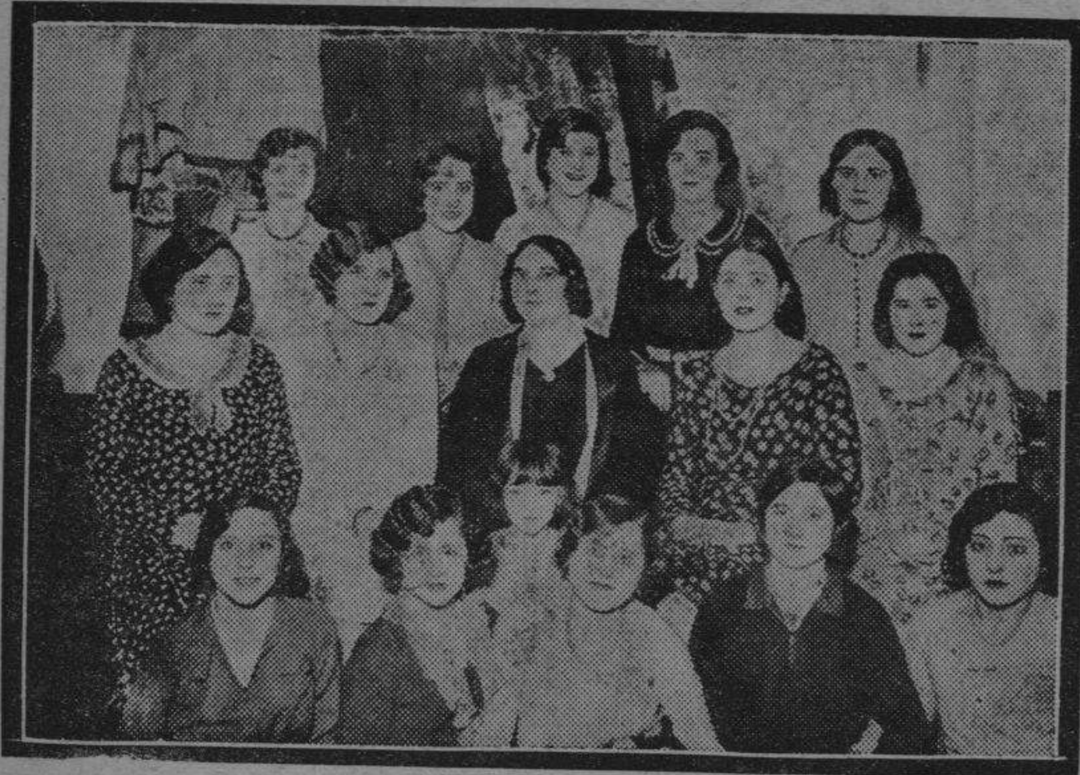
Agrupadas alrededor de la maestra, las modistas sonríen en el momento culminante en que la coquetería se pone en juego al disparo del magnesio.