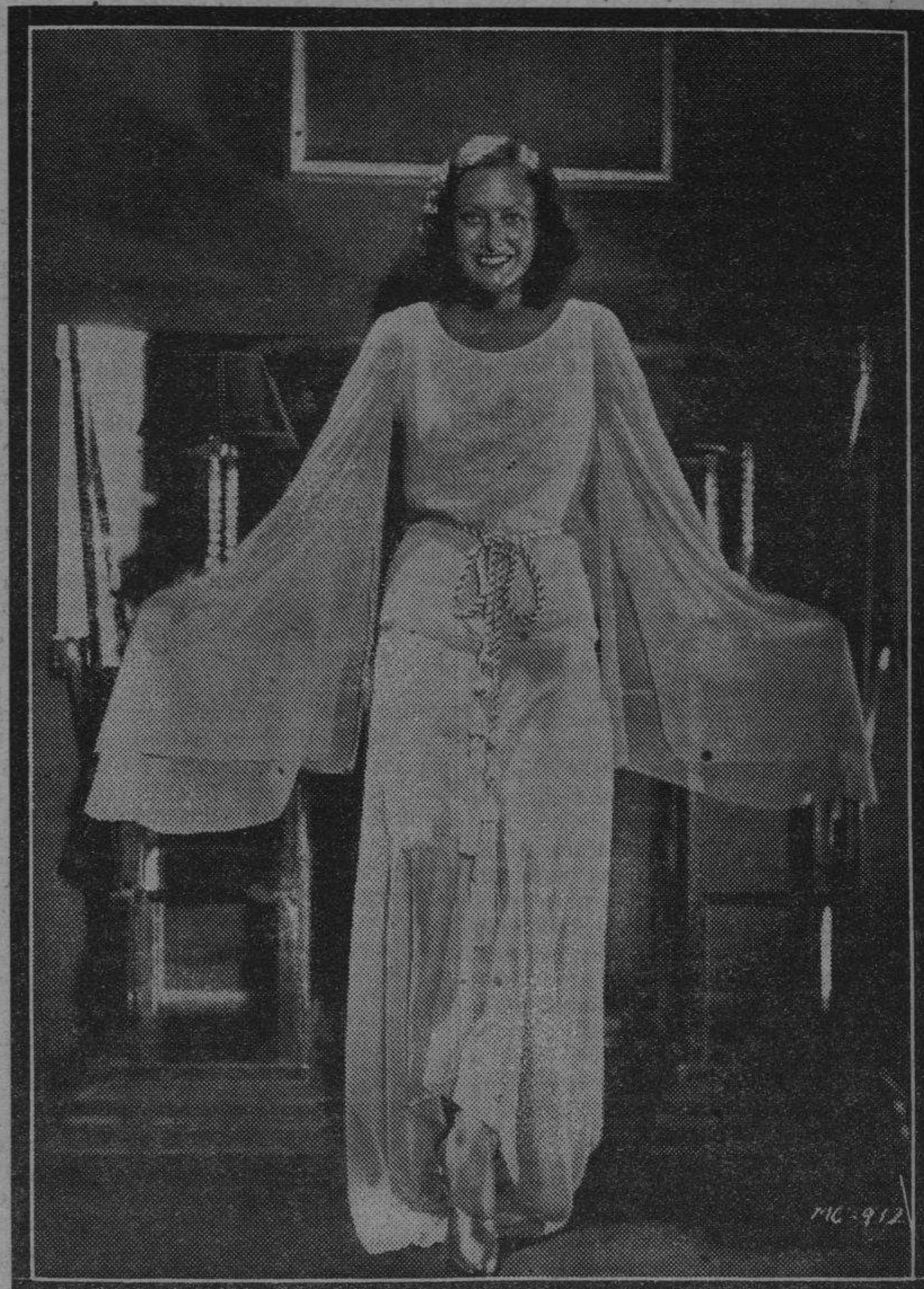
Joan Crawford, la hermosísima "star" de la Metro-Goldwyn-Mayer, en el retiro de su elegante "boudoir".

sus riquezas naturales y prescindir en absoluto de los empréstitos.