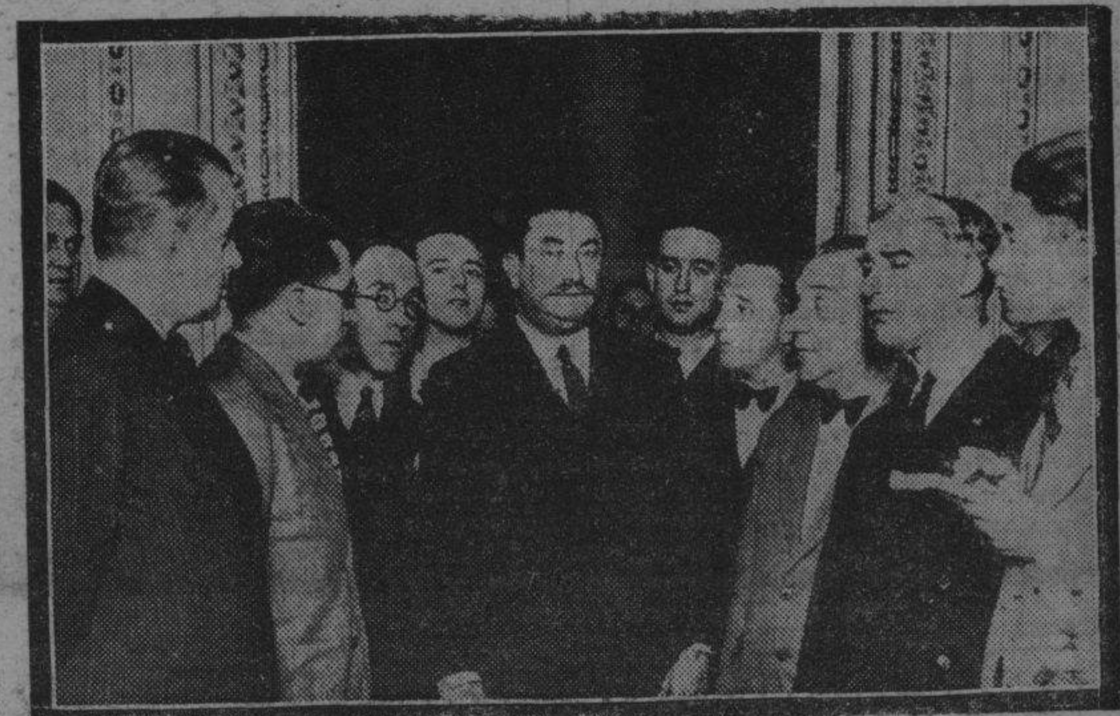
El presidente del Consejo, rodeado por los periodistas en la misma estancia en que tuvo lugar el suceso.