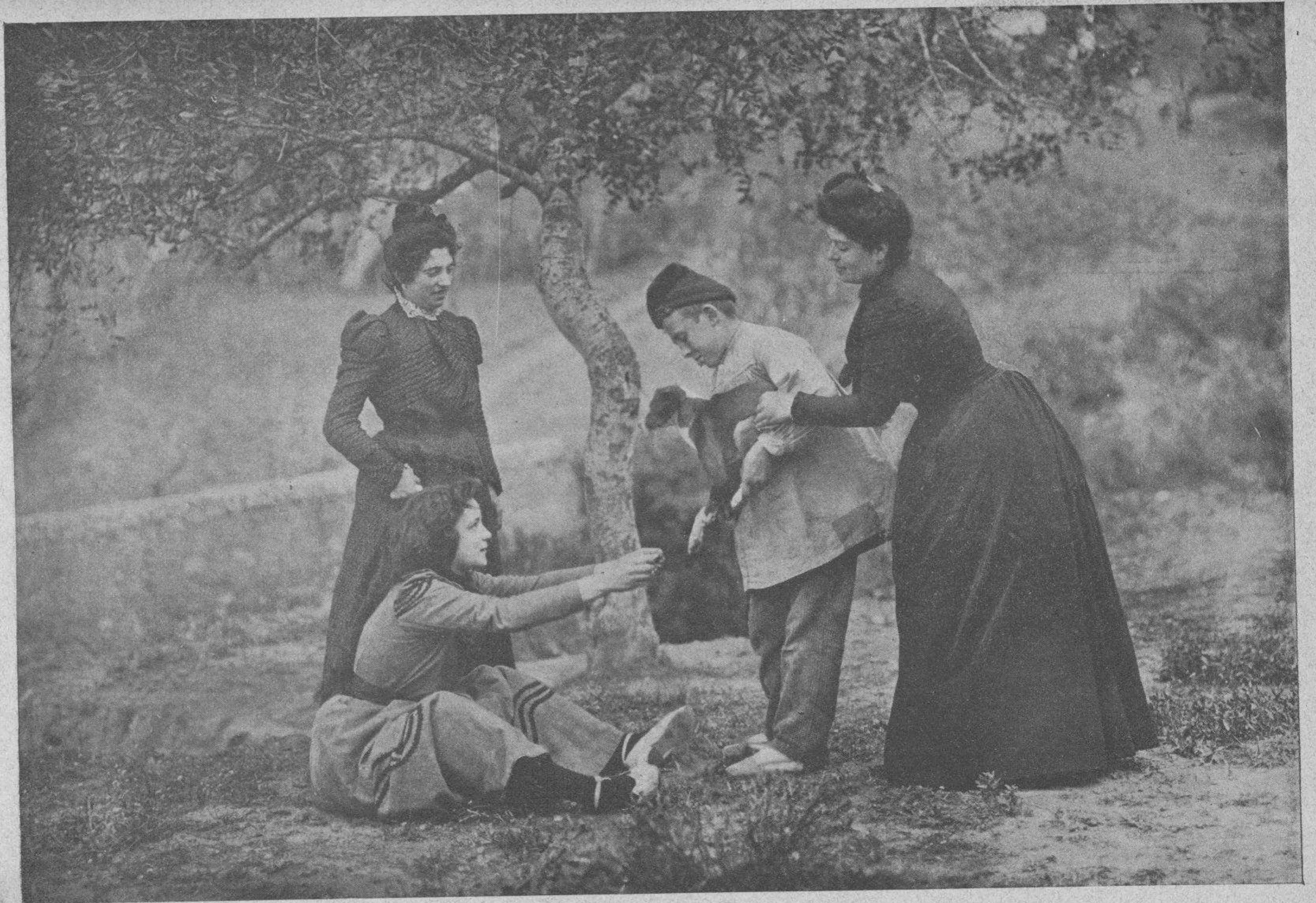
Disputándose las caricias del amigo del hombre.