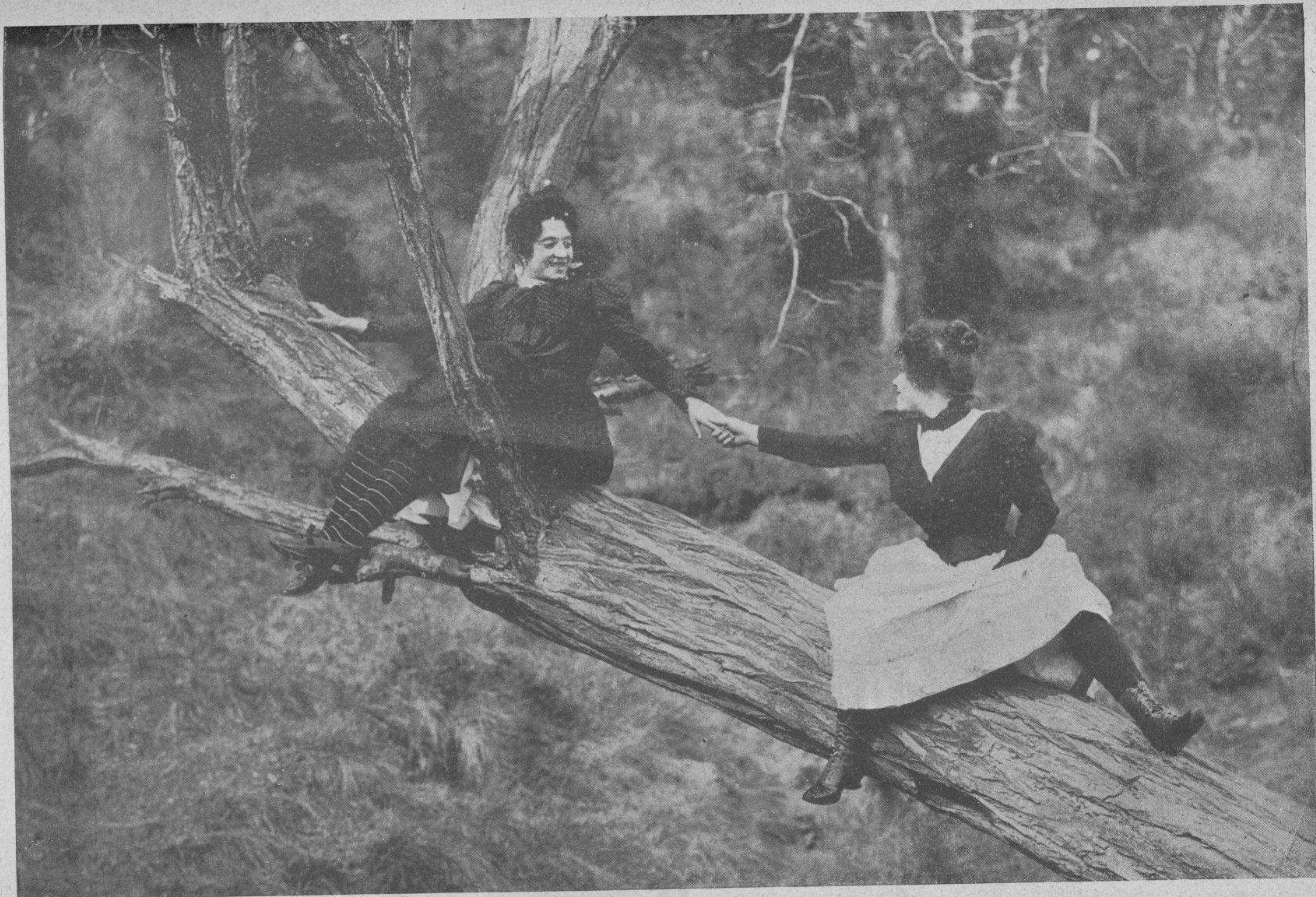
Un escaleo atrevido