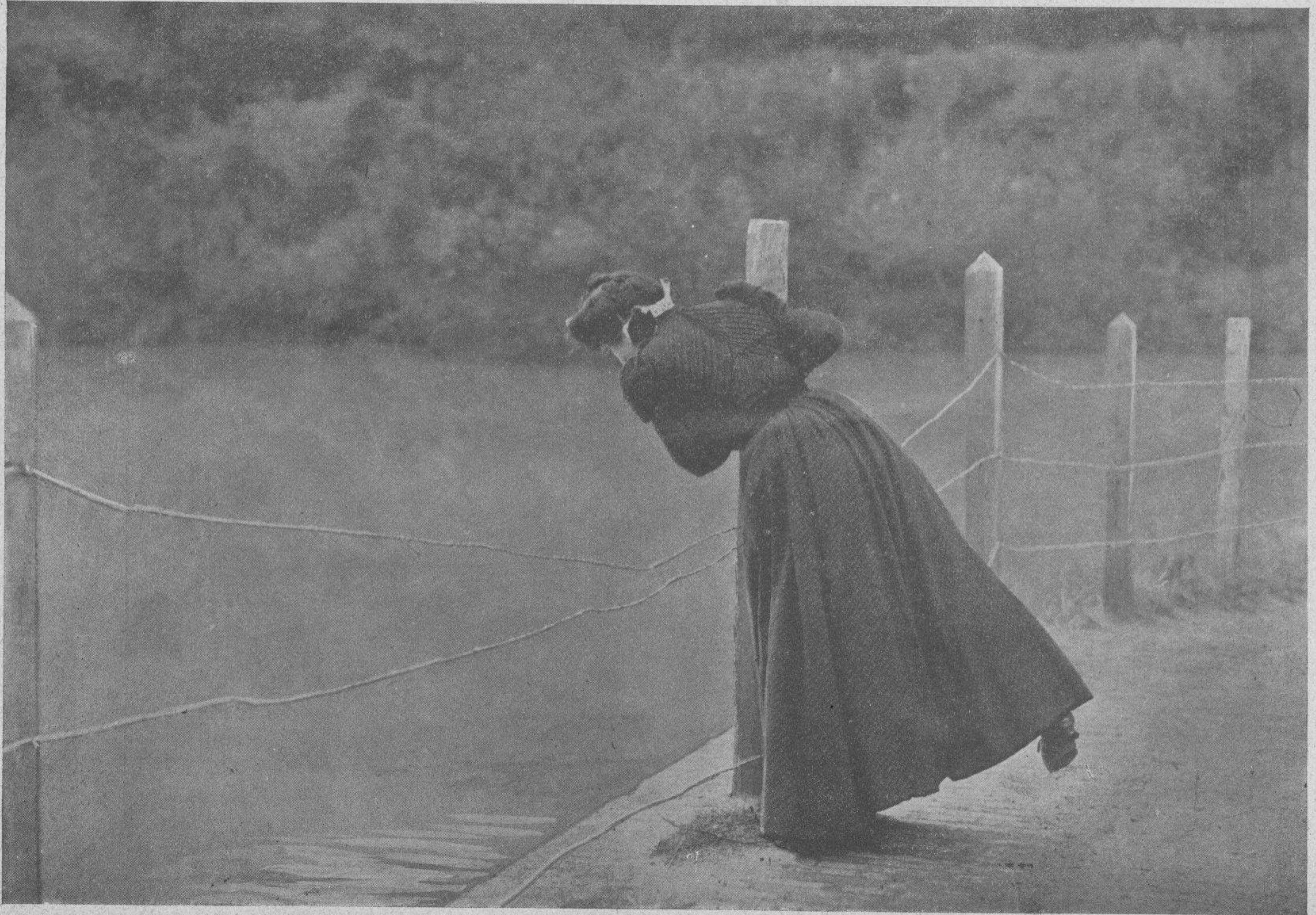
Mirándose en el lago