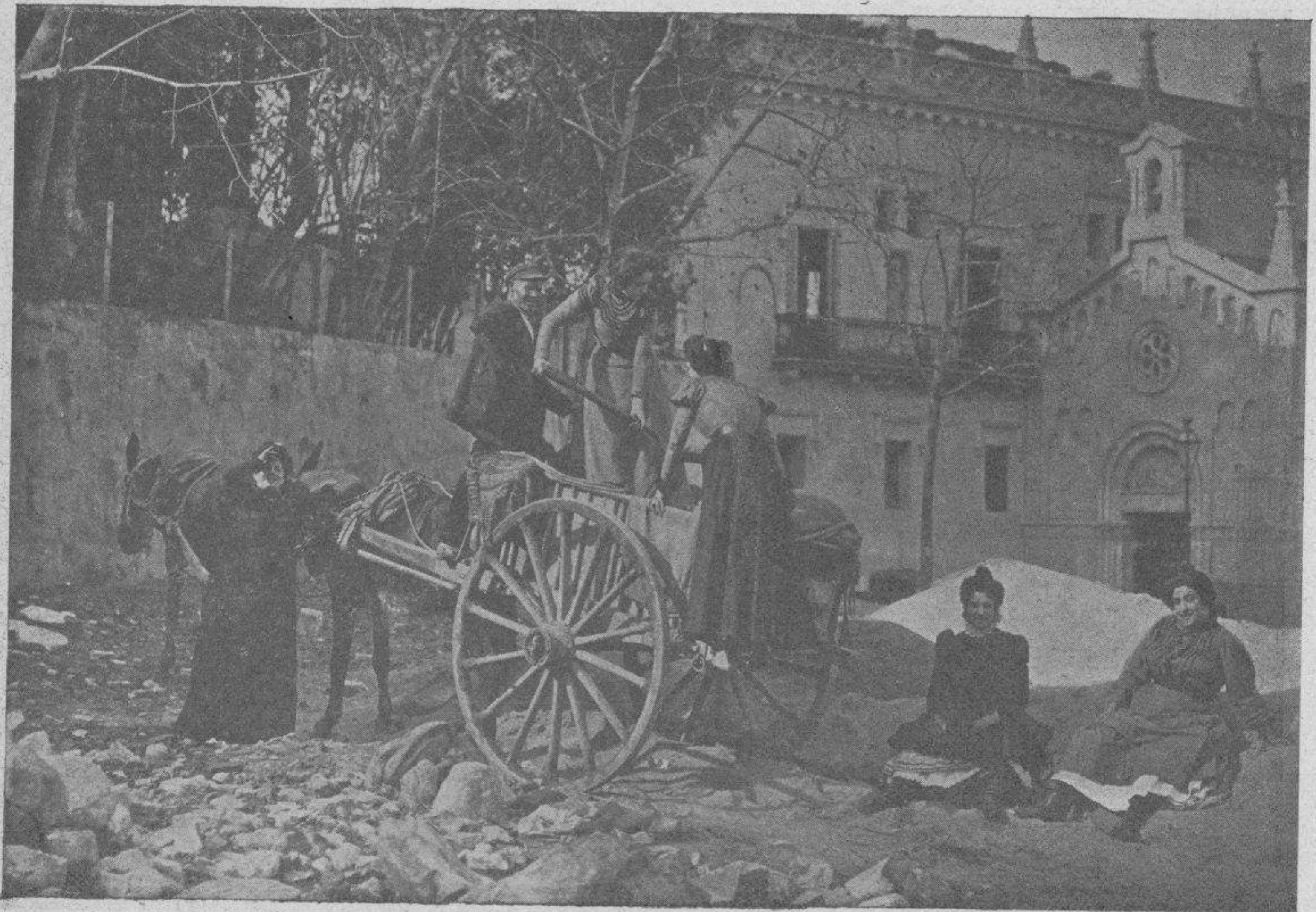
Mira tú si servimos, que te hacemos las faenas mismitas que hace el hombre.

—Pero yo la amaba, no vivía más que para ella y empecé á enfermar de la rabia y los celos que me produjo su negativa. Pensé emprender un viaje con