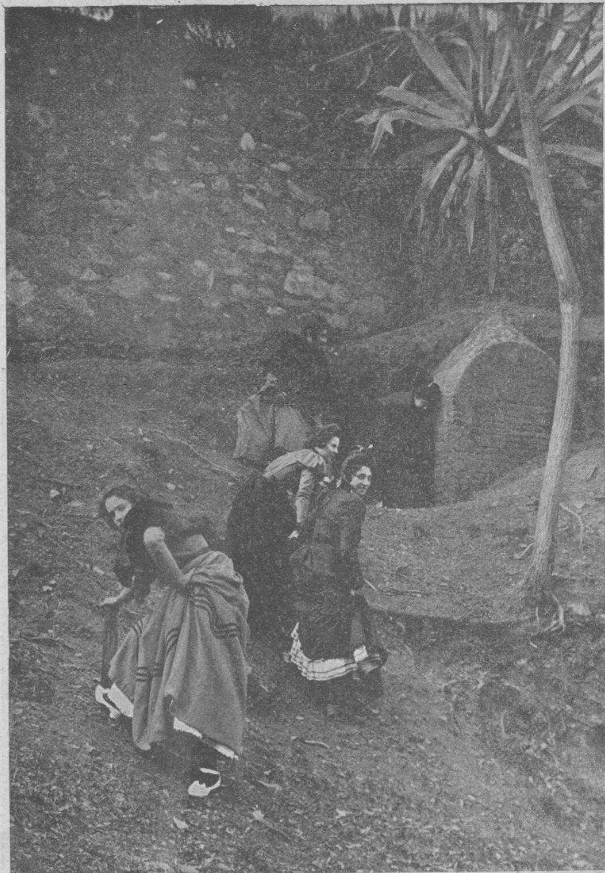
—Esta maldita peña ✱ descubre los secretos. —No quiero yo acercarme ✱ ¡Jesús qué miedo!

Sánchez.—La otra noche, la caída mía en «La Cuneta» fué por una frase menos fuerte que esa.