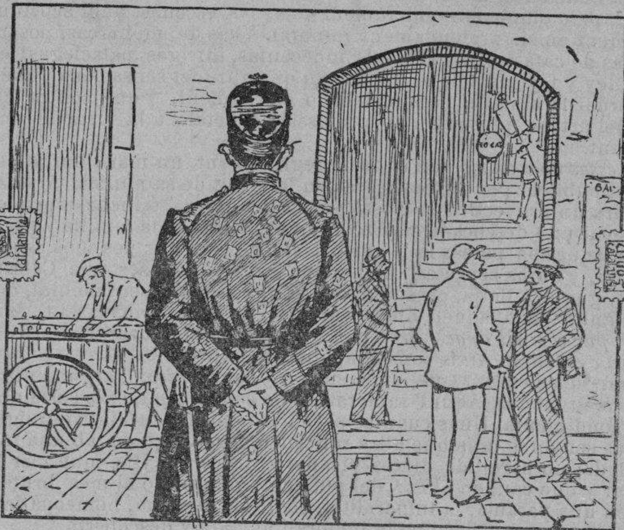
¡Després dirán que dormim!