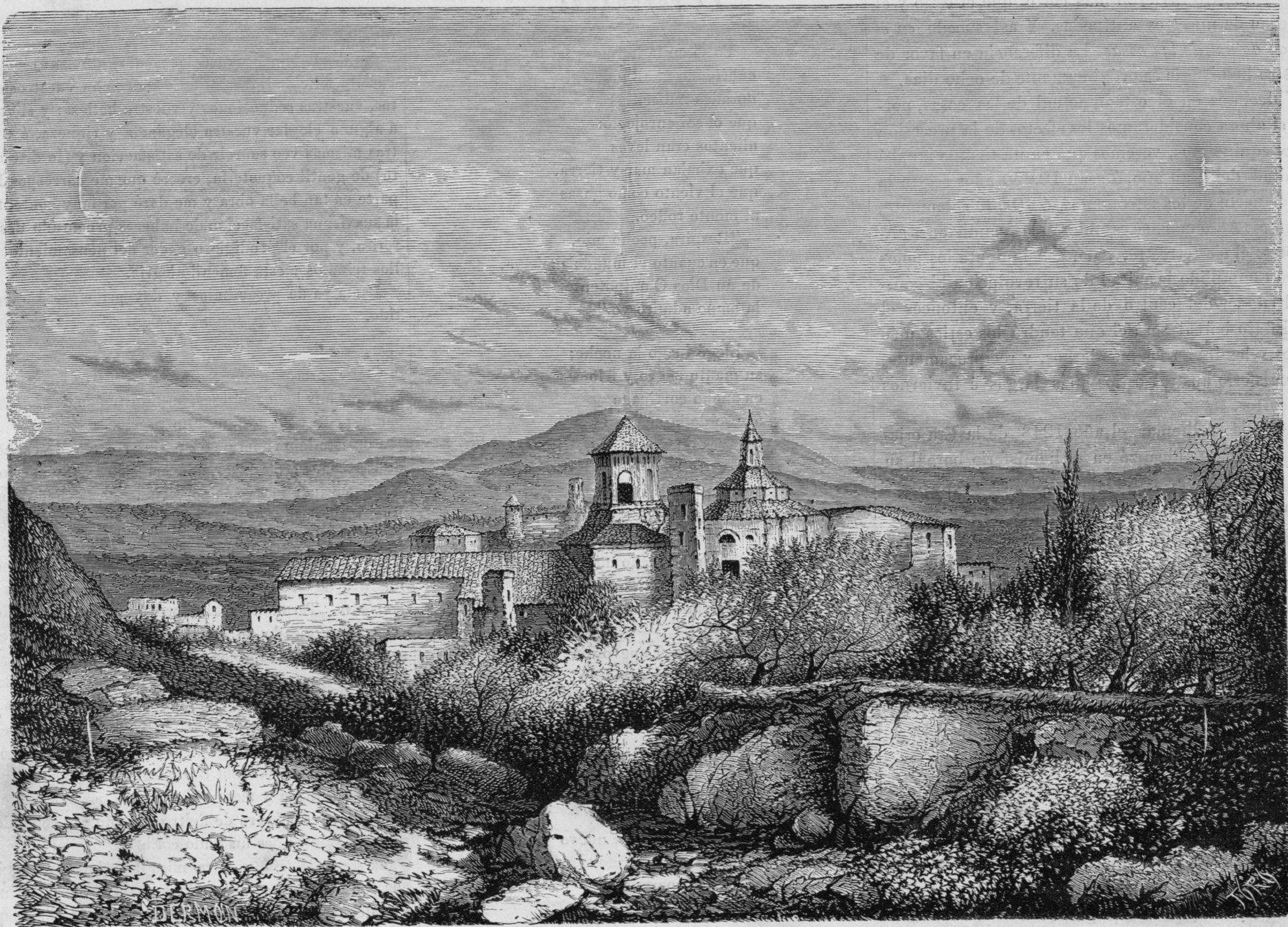
( TARRAGONA. ) MONASTERIO DE POBLIT.

vertido antes, el eje terrestre se conserva siempre paralelo á sí mismo, la línea equinoccial pasará siempre por el mismo punto de la superficie del globo. Pero no sucede absolutamente así; el paralelismo del eje de la Tierra se destruye lentamente, muy lentamente, por un movimiento particular que Arago comparaba muy ingeniosamente al giro inclinado de un trompo, y que segun la mayor parte de los astrónomos, se cumple en 25.800 años próximamente. Este movimiento tiene por efecto hacer retroceder hácia el oriente de año en año los puntos equinociales de la superficie del globo, porque la línea equinoccial, despues de su revolucion ánuua, no coincide exactamente con su posicion anterior. De modo que al fin de 25.800 años (M. Adhemar dice solamente 21.000) el punto equinoccial dá literalmente la vuelta al globo y llega á la misma posicion que ocupaba al co-