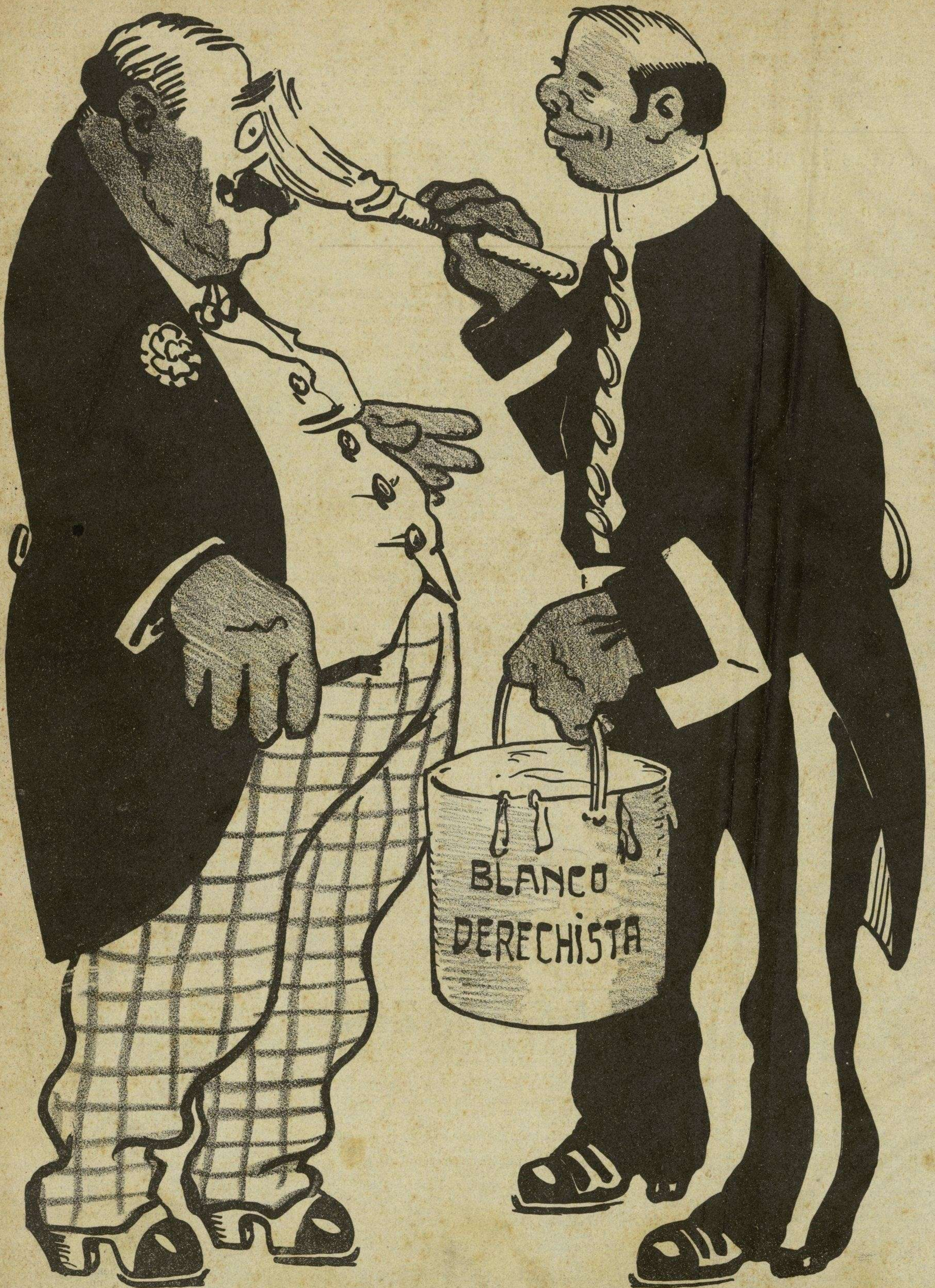
REFORMAS EN LA FACHADA