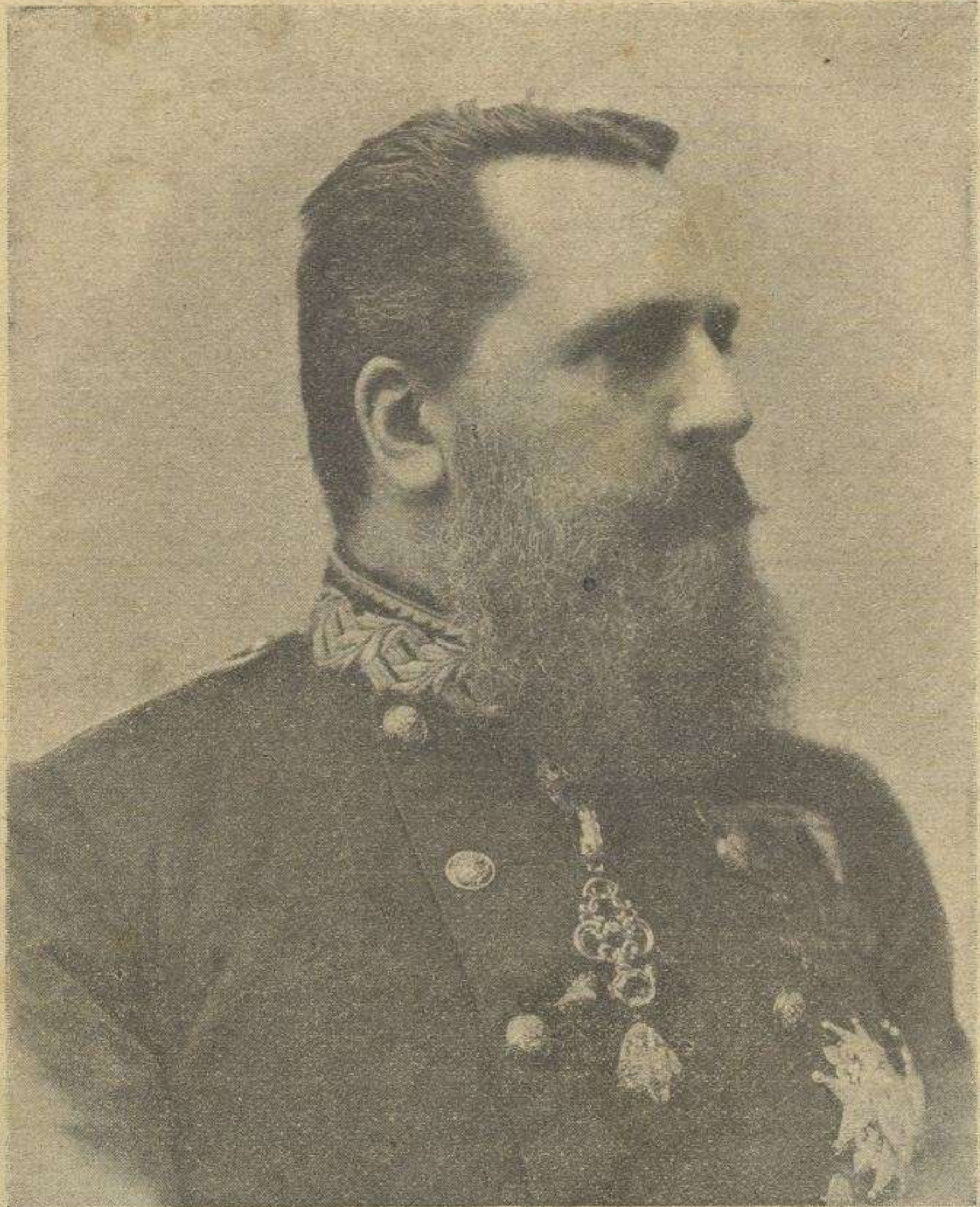
D. CARLOS DE BORBÓN