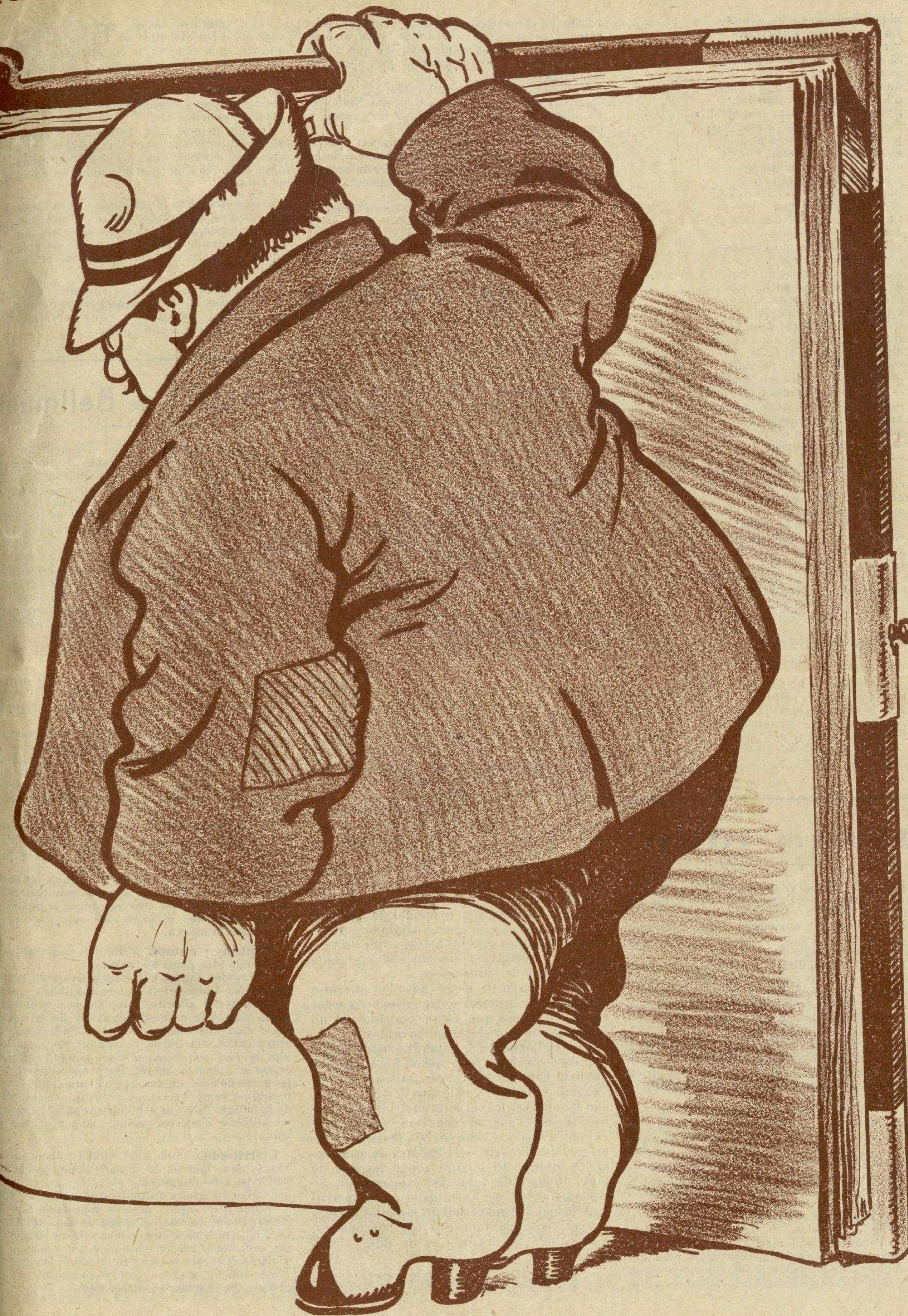
El "Llibre d'Or" nosaltres li regalém

VIII. Jamás seas farsante y embaucador. ~~~~~