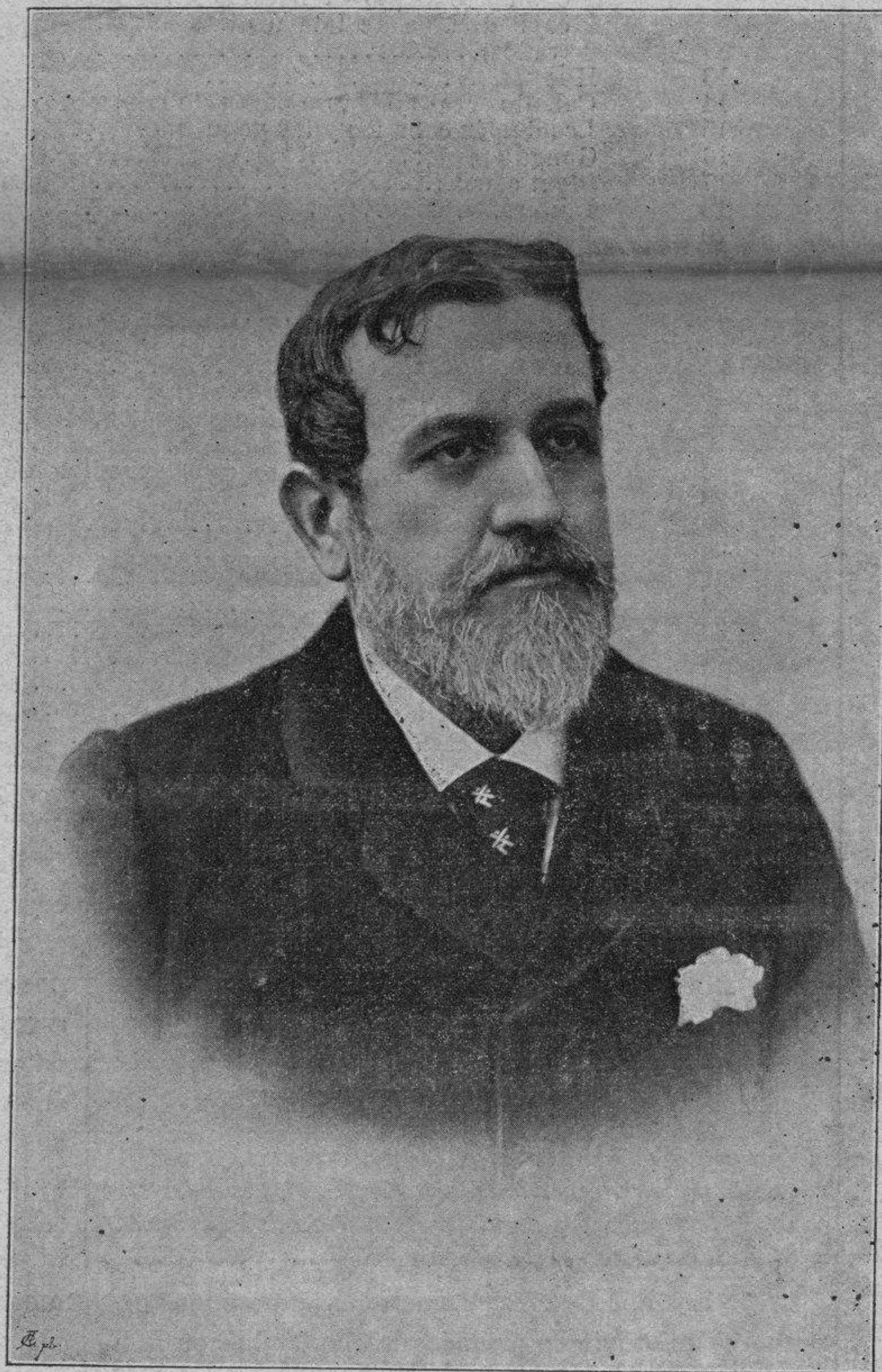
Excmo. Sr. Marqués de Montoro.

El País , de la Habana, dedica en sus columnas calurosos elogios al Sr. Montoro por su gestión como gobernante y por el gran impulso que está dando al mejoramiento del puerto de Cienfuegos, y por los proyectos que tiene en cartera, debidos á su talento é iniciativas. En las circunstancias actuales, el Marqués de Montoro es una esperanza para la patria, porque representa en Cuba algo así como un Castelar en la Península, esto es, el nombre que en momentos de angustias y peligros agruparía en torno suyo las fuerzas vivas de aquel país. ¿Llegará el caso? ¿Habrá tiempo?