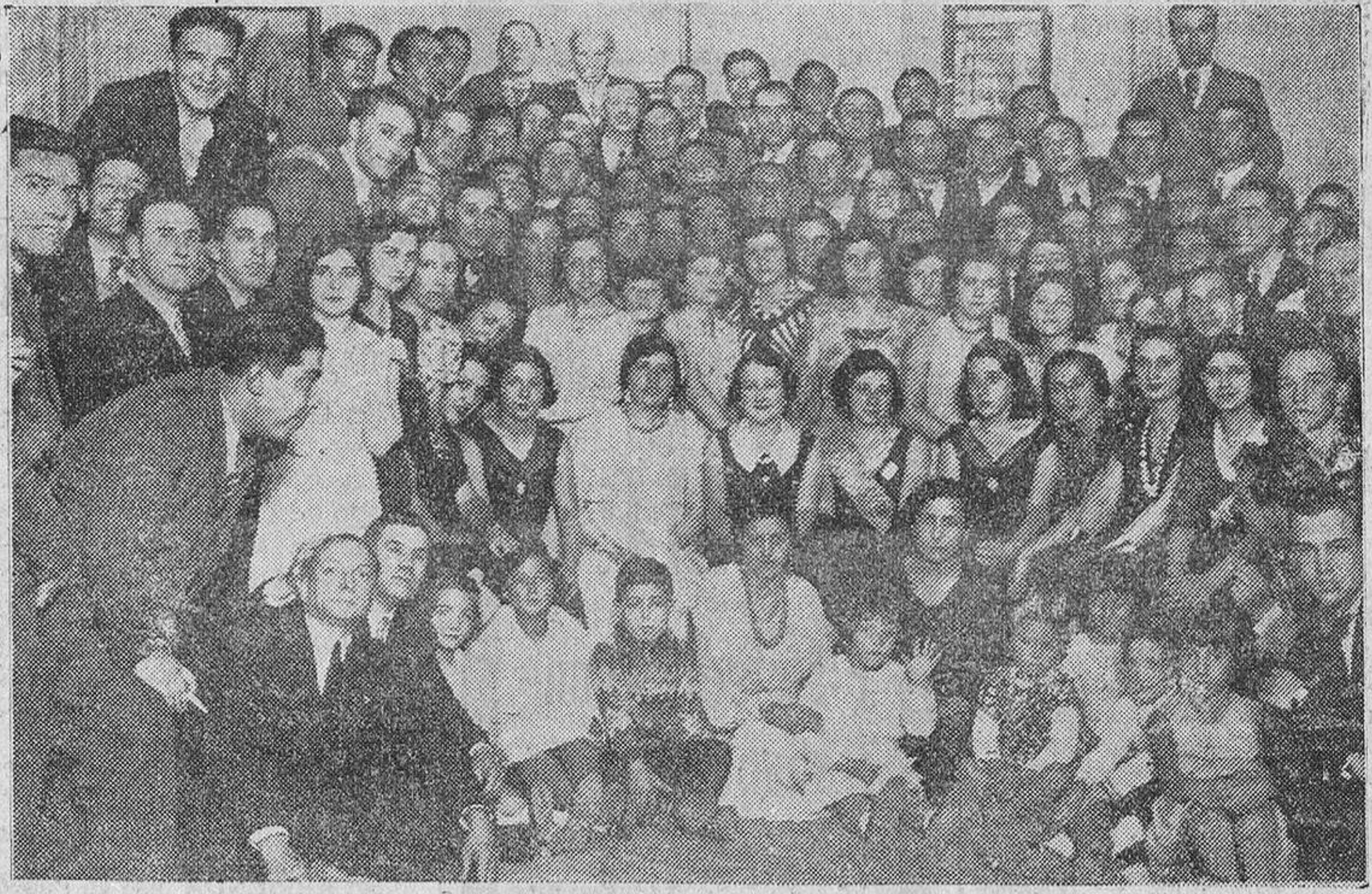
La "moza charra" rodeada de un grupo de concurrentes a la fiesta.