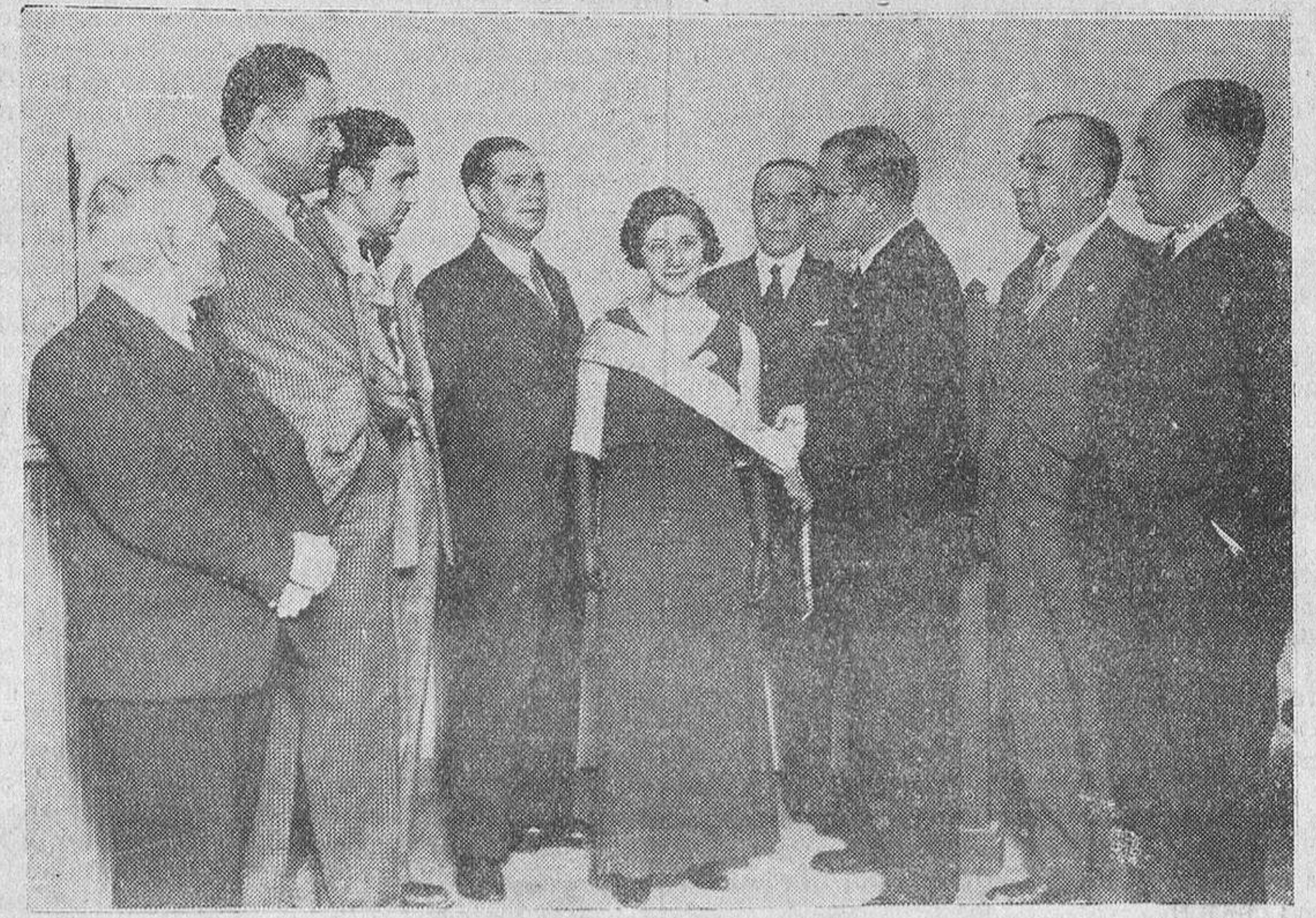
La junta directiva imponiendo la banda a la "moza charra"..

A lo que estábamos ¡Bueno! Pues verás... si es que escucharme quieres tan sólo un momento. Madrid, este pueblo hermoso que a todos acoge lleno de cariño y de alegría y pa todos tie elementos, va perdiendo su carácter,