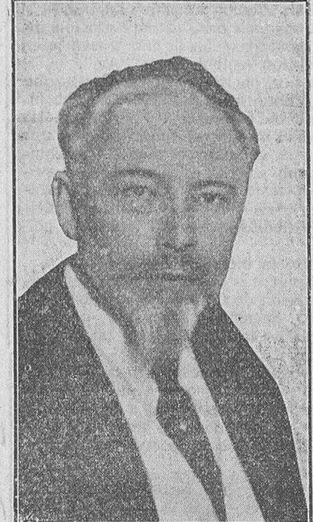
los problemas espirituales se convierten en materiales para los hombres cuya vida está llena de dificultades.