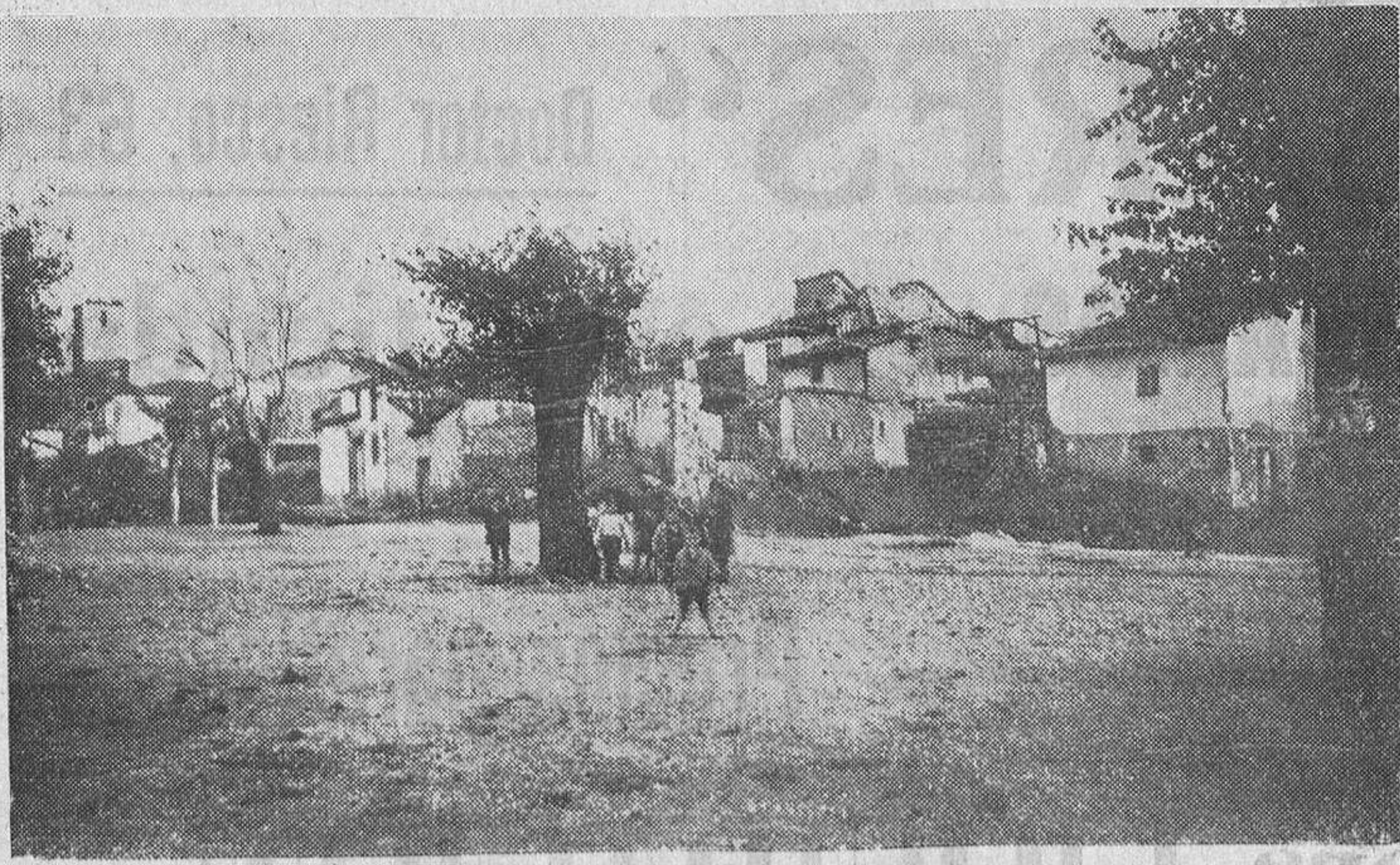
"La Antigua", el viejo barrio que se va desmorinando y al que sucederá otro de casas alegres, limpias, soleadas... (Foto J. Requena).

Enseñanza se gestiona por el Ayuntamiento pensando que era necesario crear en Béjar un núcleo de cultura desinteresada, absolutamente preciso, por otra parte, donde la lucha social entre capital y trabajo es tan áspera. Así quedaba asegurada, para el porvenir, una acción armoniosa de enseñanza sobre todos los sectores sociales, con Escuela primaria de gran envergadura, Escuela de Trabajo de preparación para la clase obrera e Instituto Nacional de Segunda Enseñanza con su acción formativa sobre