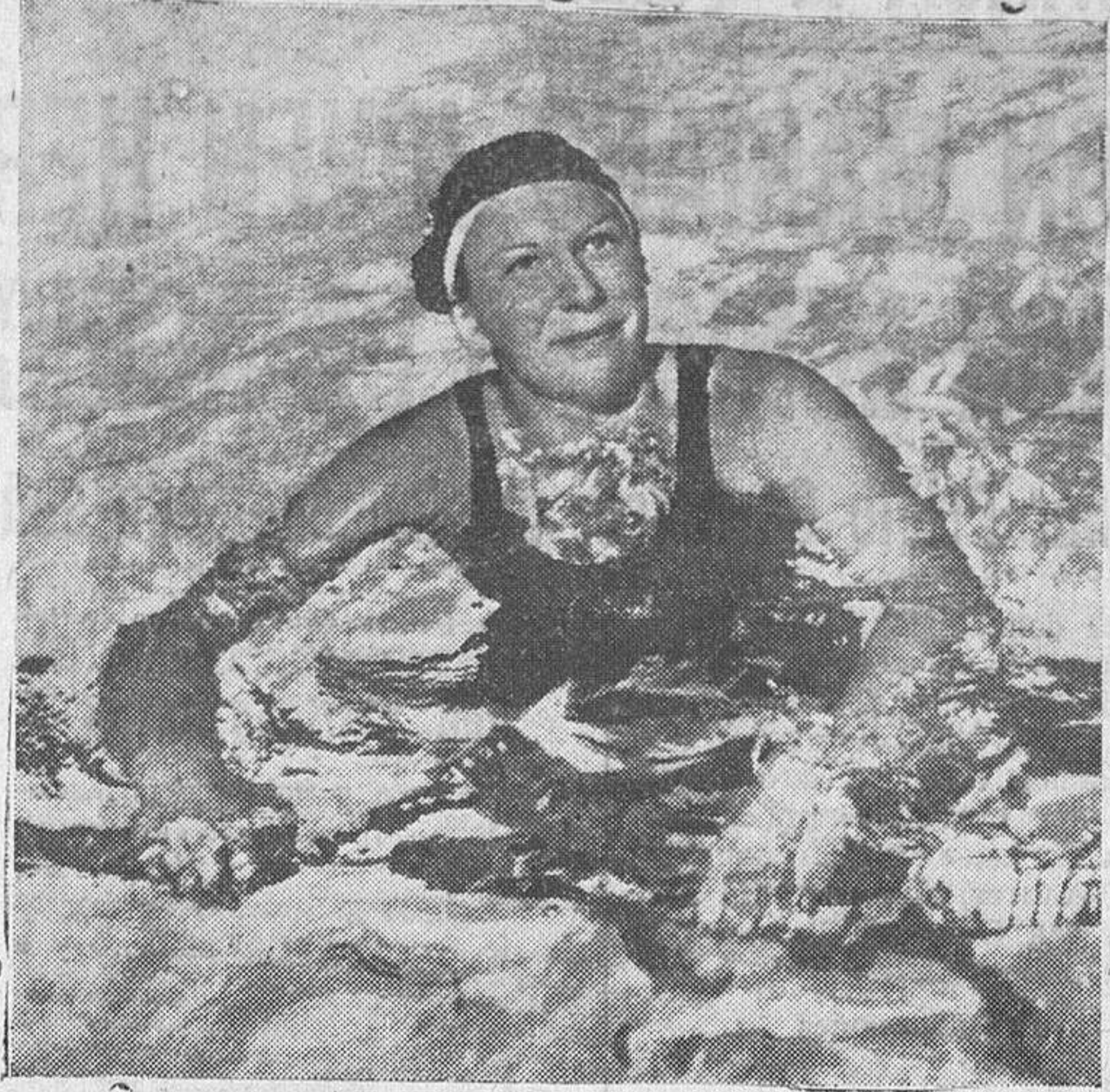
Helena Madison, norteamericana, ganadora del Campeonato Olímpico de los 100 metros de natación...