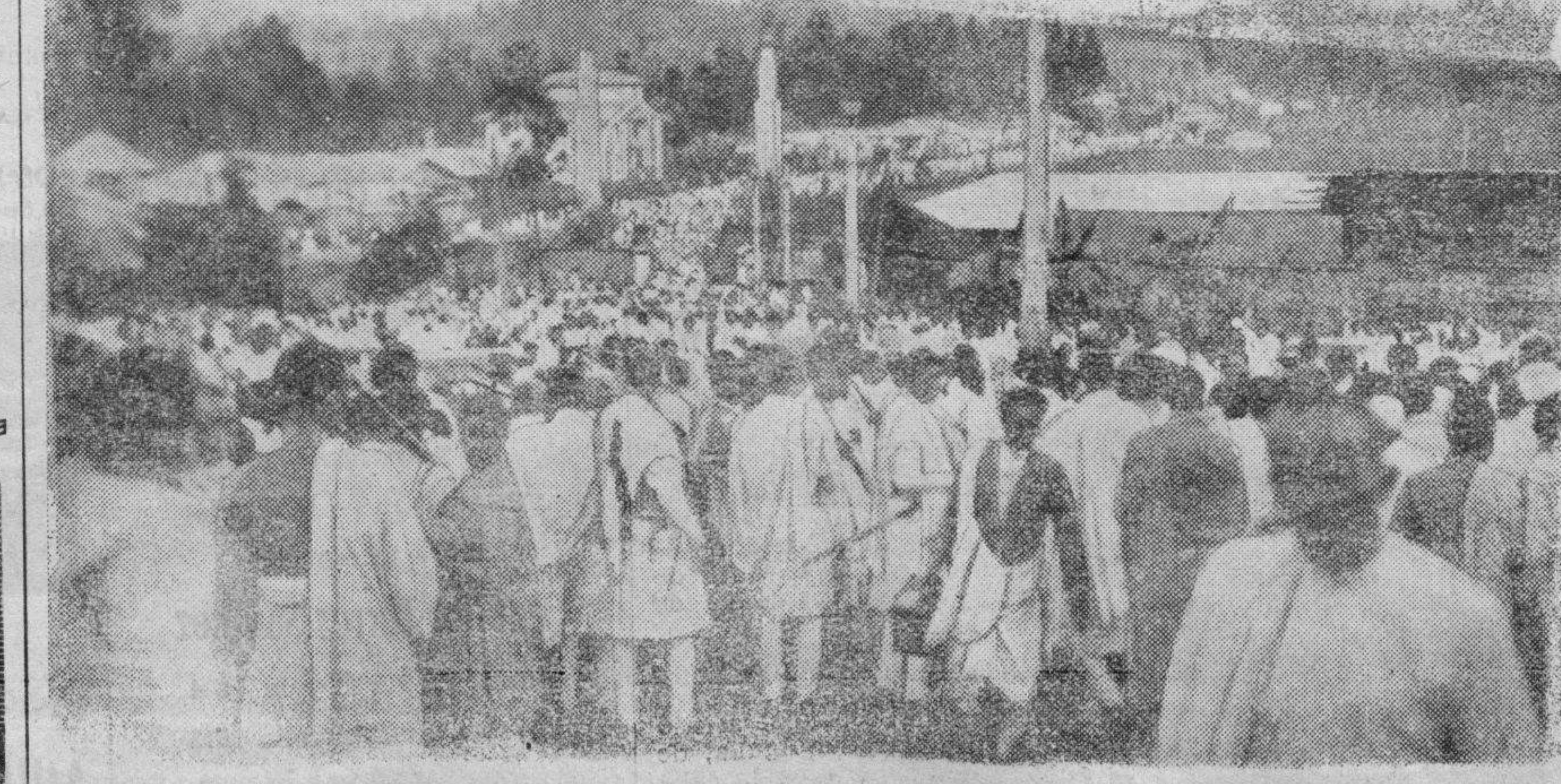
Ante el temor de que Addis Abeba sea tomada por los italianos, los guerreros etíopes se marchan de la capital de Abisinia

"¡LA VUELTA CICLISTA A ESPAÑA" ¡Almerienses! ¡Deportistas! ¡Contribuid con vuestros donativos,