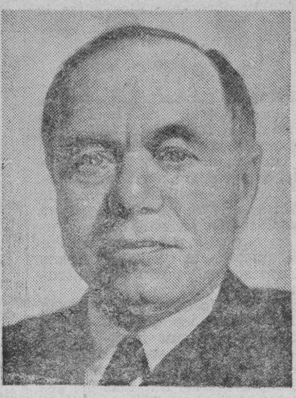
LORD BEAVERBROOK el rey de la prensa inglesa que aumenta en los últimos días extremadamente la oposición contra el primer ministro de la Gran Bretaña, Stanley Baldwin y su gabinete