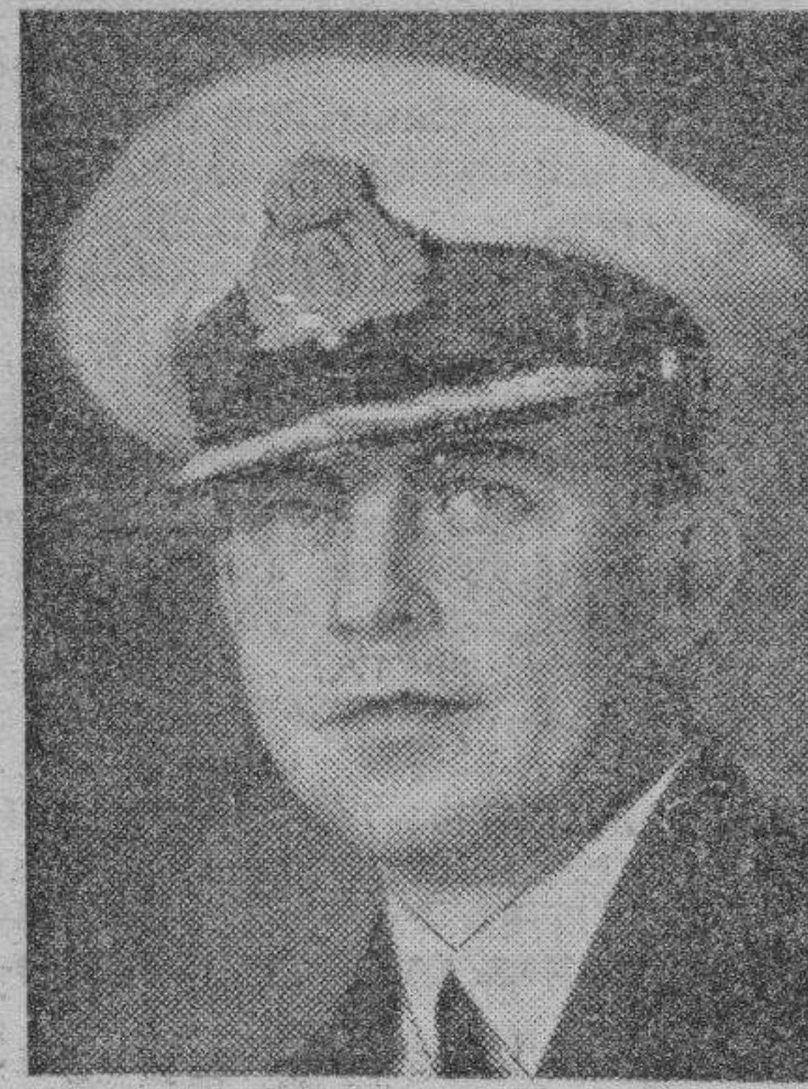
PRINCIPE PABLO DE GRECIA heredero del trono y hermano del rey actual, que en calidad de Presidente del comité olímpico griego, acompañará a los atletas de su país a los juegos olímpicos de Berlín.

Se suspende la sesión a las siete y cinco de la tarde.