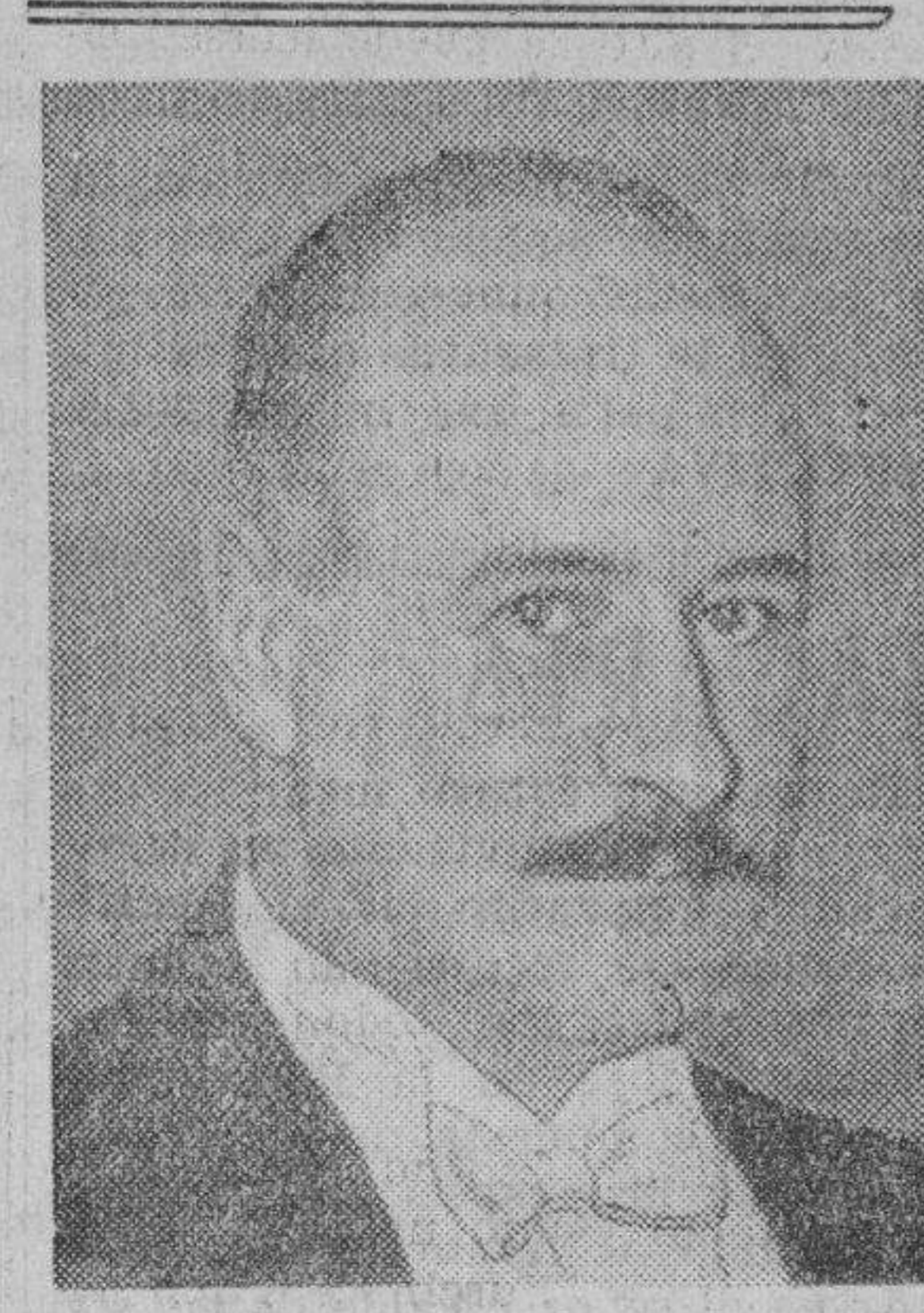
FRANCOIS PONCET Ministro de Francia en Berlin

El señor PÉREZ MADRIGAL, al abandonar su escaño dice: —El primer pastel de la temporada... Esta frase produce una gran indignación en las minorías gubernamentales, produciéndose un verdadero escándalo, llegando hasta agredirse Pérez Madrigo con el