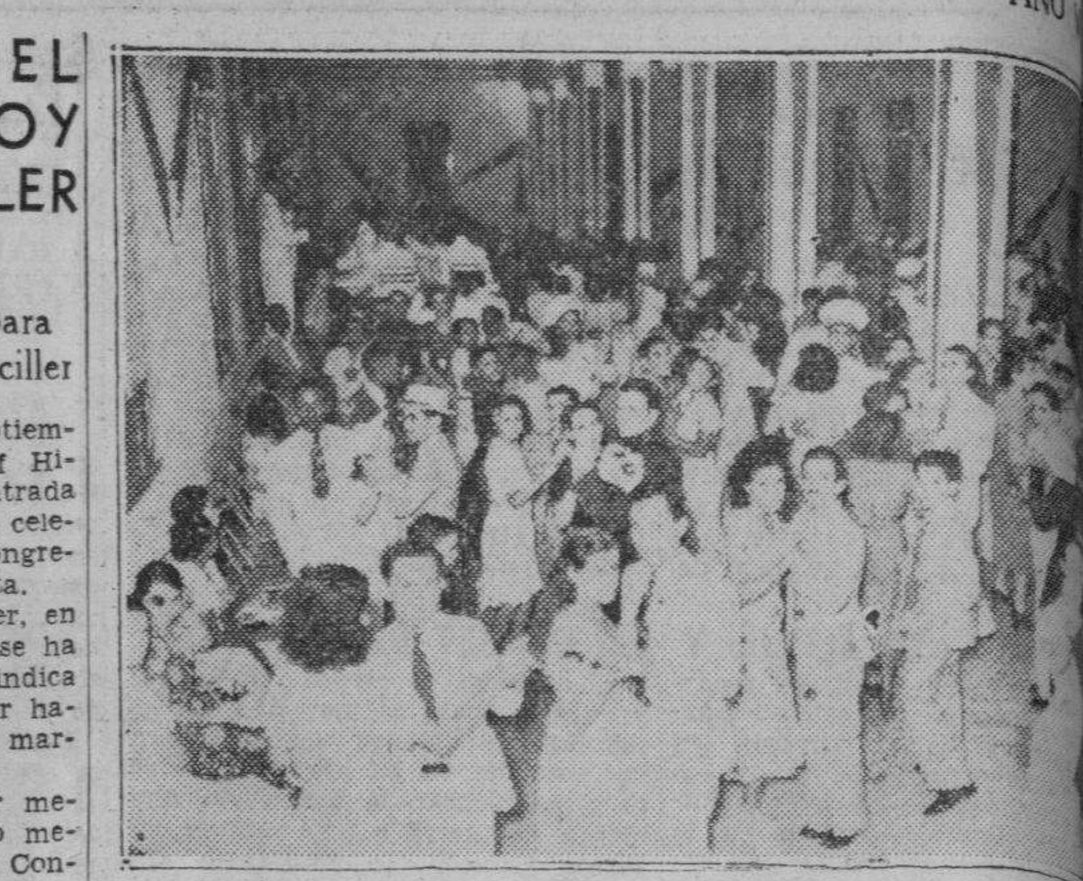
Una parte de la concurrencia a la fiesta bailable ofrecida en la Estación, en la noche de ayer.

«Claro. Mi marido es el futbolista, el héroe de la obra.»