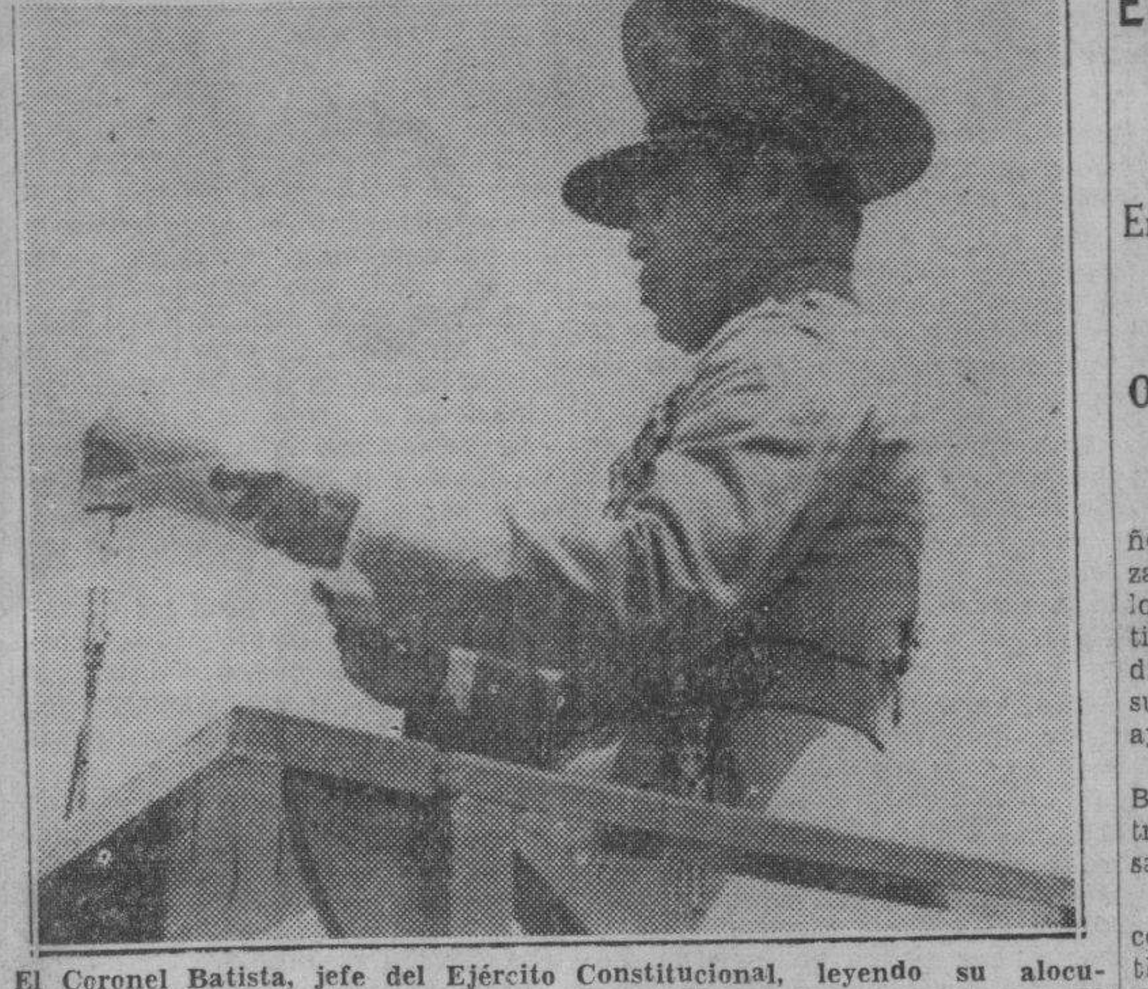
El Coronel Batista, jefe del Ejército Constitucional, leyendo su alocución a las Fuerzas Armadas y al pueblo de Cuba en la gran glorieta de la Ciudad Militar.

TOKIO, septiembre 4. (Havas).—La agencia noticiera «Doms», dice que el volcán Asama, el único activo de la cadena volcánica que forma la columna vertebral del Norte del Japón, inició hoy espectacularmente una gran erupción.