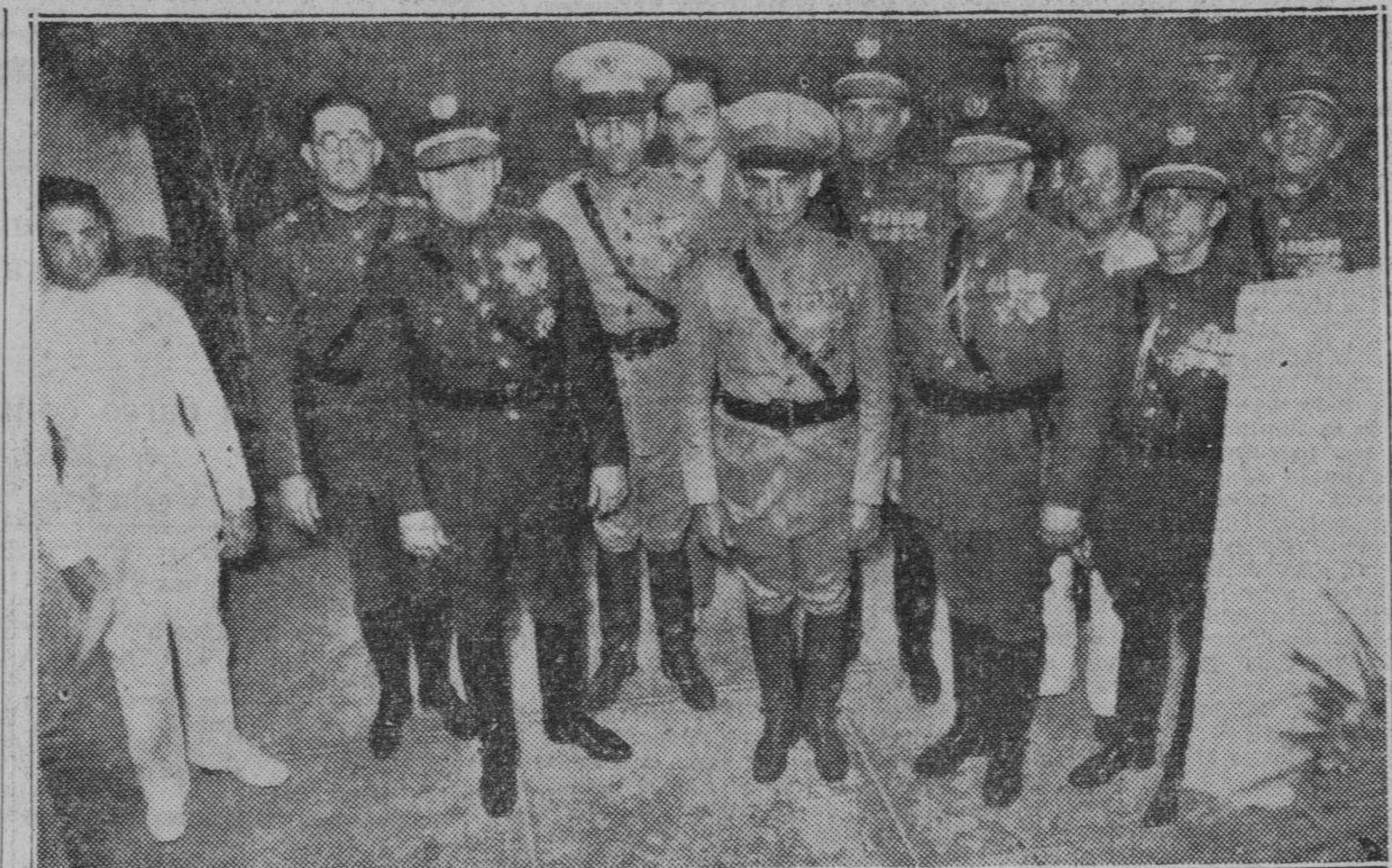
1 Coronel Pedraza, Jefe de la Policía Nacional, acompañado de la Piana Mayor del Cuerpo, en la Novena estación, cuando recorría las dependencias de la misa para conocer el desenvolvimiento de los actos que celebraban con motivo del quinto aniversario del 4 de Septiembre.

Inauguración de un parque Al fondo de la doce estación, donde existían unos placeres vermos, fué construido un bello parque infantil con una magnífica pista para patinadores, de ochenta metros de largo, que fué inaugurado en el día de ayer.