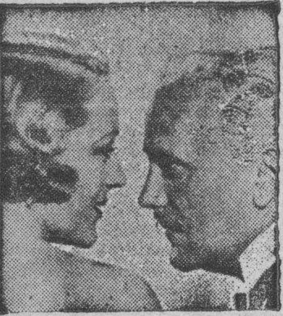
Sally Eilers y Ralph Morgan en «Murallas de Oro».

oficina. En parte por rendición ante el halago en parte también para evitar las represalias del tío, que arrullaban el porvenir del muchacho, ella se deja querer y se casa con el magnate.