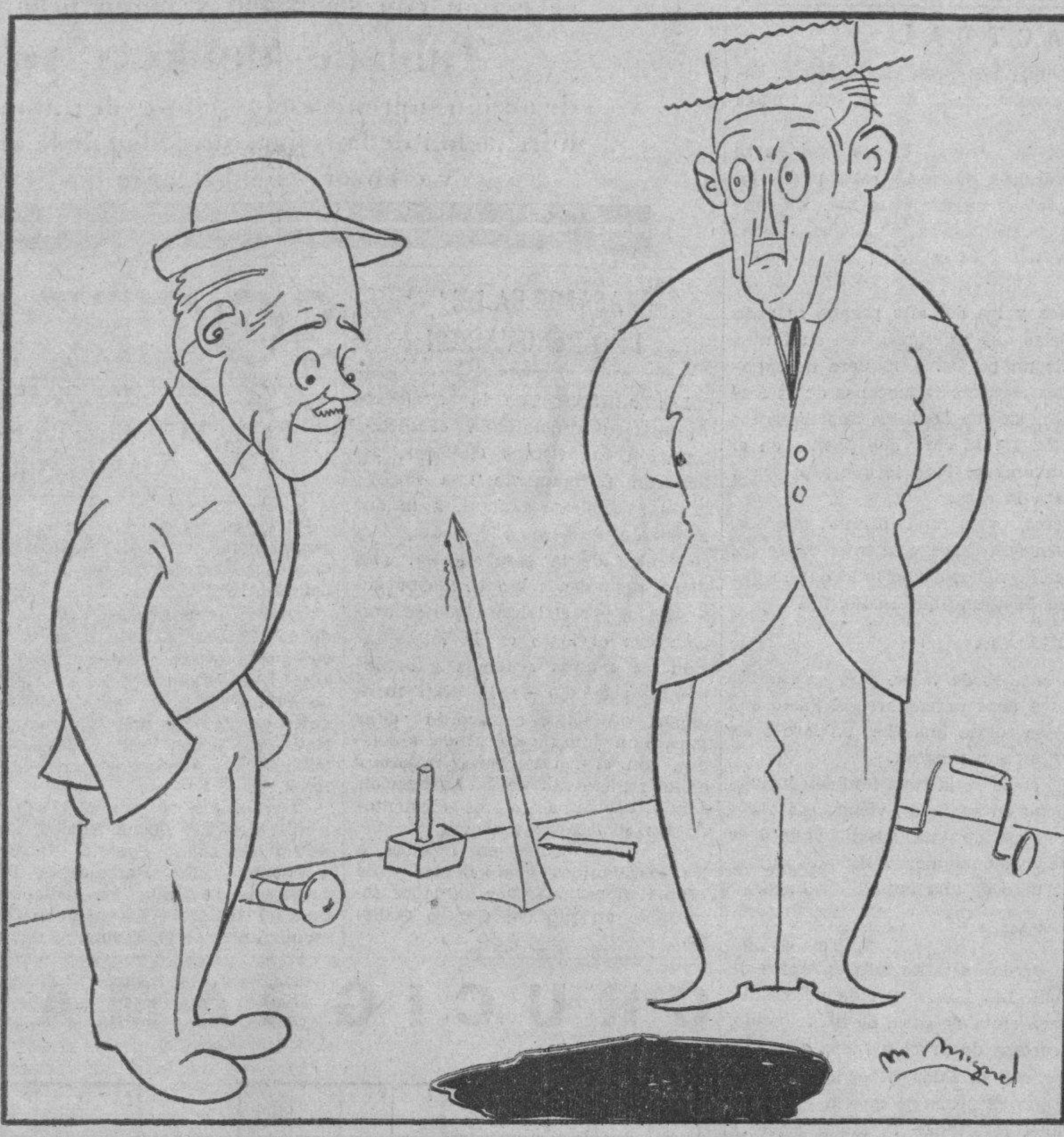
—¿Has visto, dos meses de trabajo! —Sí; lo que trabajan los hombres para no trabajar.