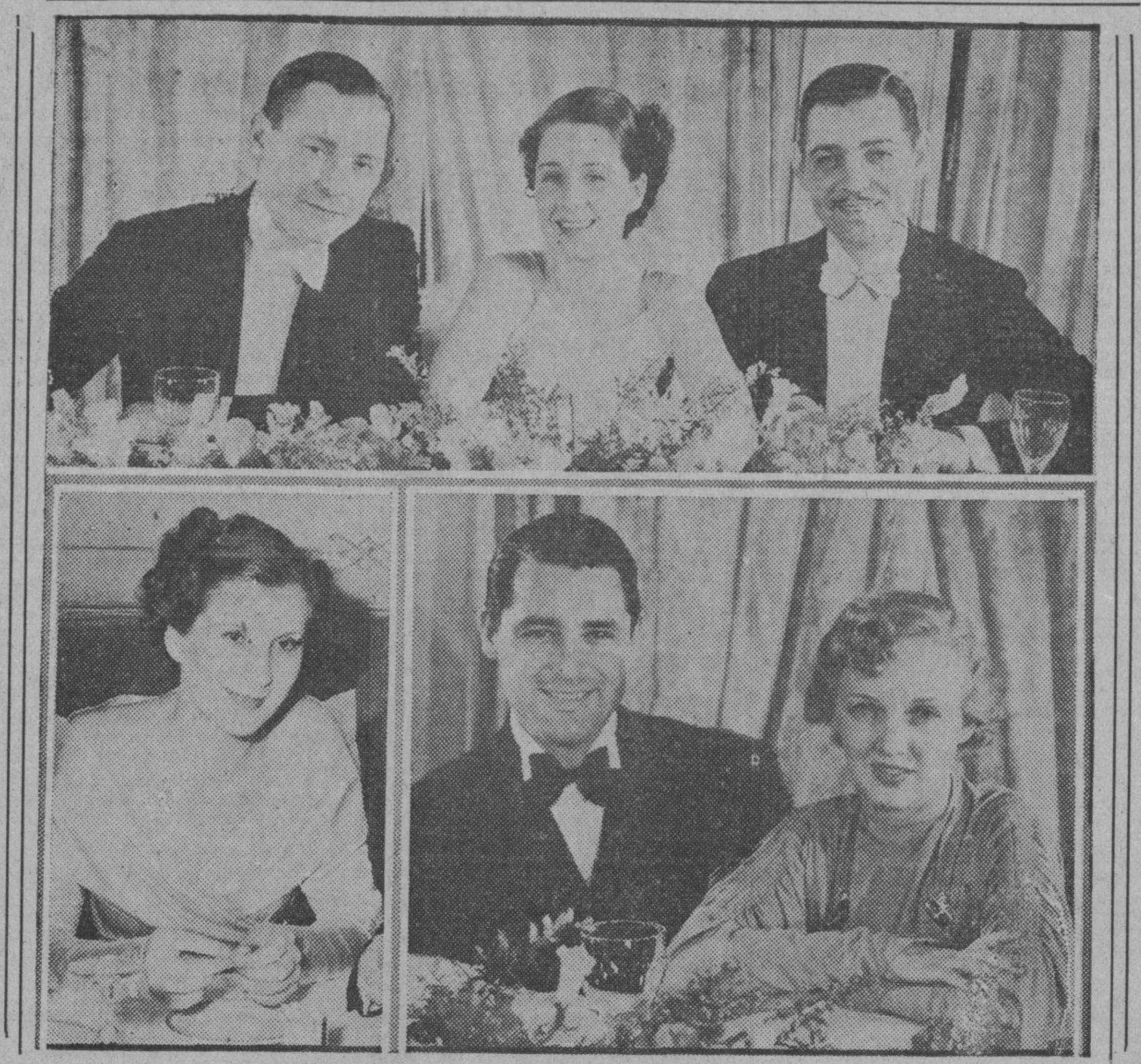
La mayoría de las estrellas de la pantalla brillaron en el banquete anual de la Academia de Ciencias Cinematográficas celebrado en Los Angeles, durante el cual se dió a conocer los laudos de la Academia acerca de las mejores obras y artistas de 1933. Los dos artistas que ganaron los laureles fueron Katherine Hepburn y Charles Laughton, que no se hallaban presentes. En la foto aparecen algunos de los que concurren al banquete, y son: arriba, de derecha a izquierda, Herbert Marshall; Norma Shearer y Clark Gable. Debajo: Diana Wyndyard; Cary Grant y Virginia Cherrill.