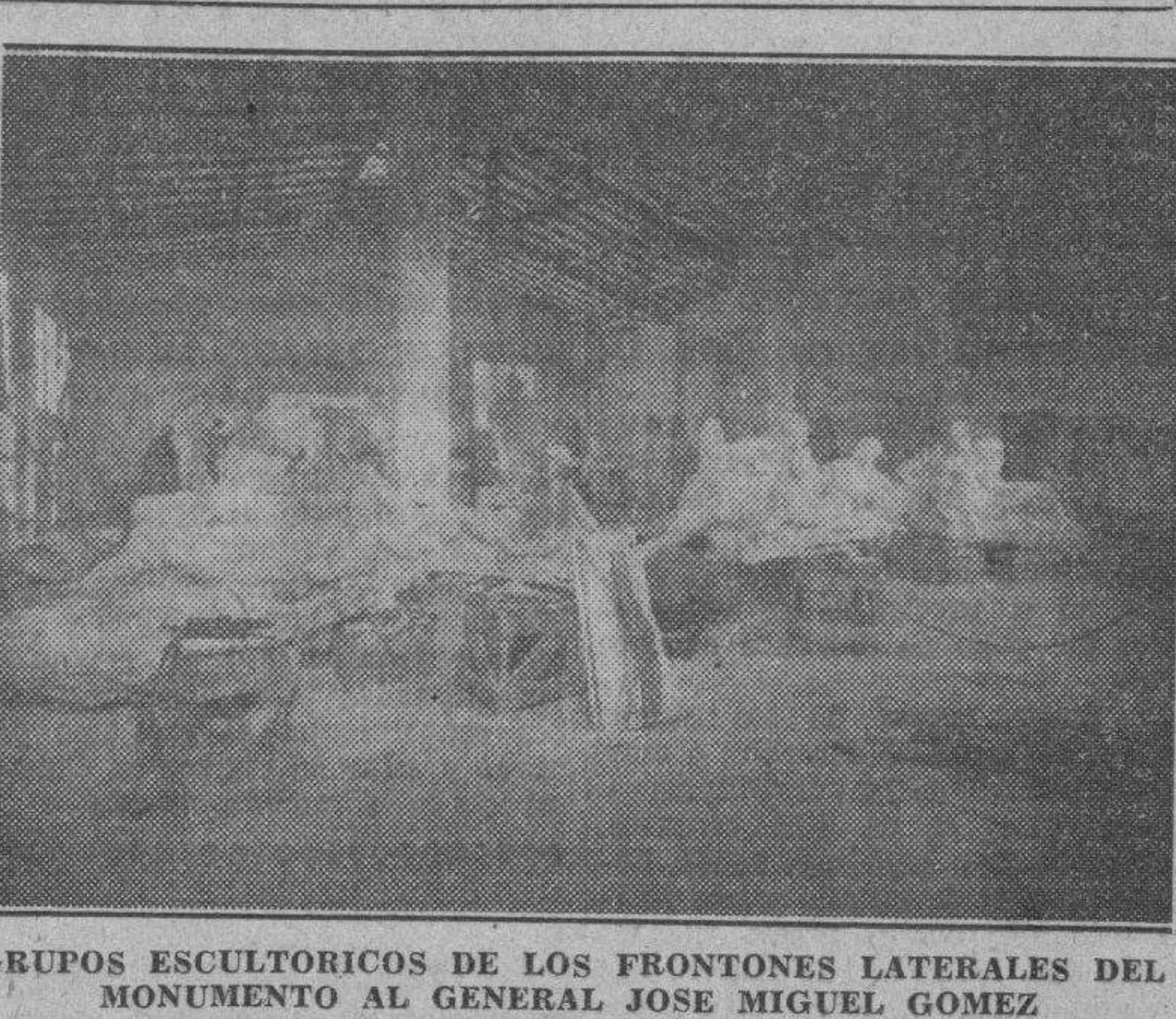
GRUPOS ESCULTORICOS DE LOS FRONTONES LATERALES DEL MONUMENTO AL GENERAL JOSE MIGUEL GOMEZ