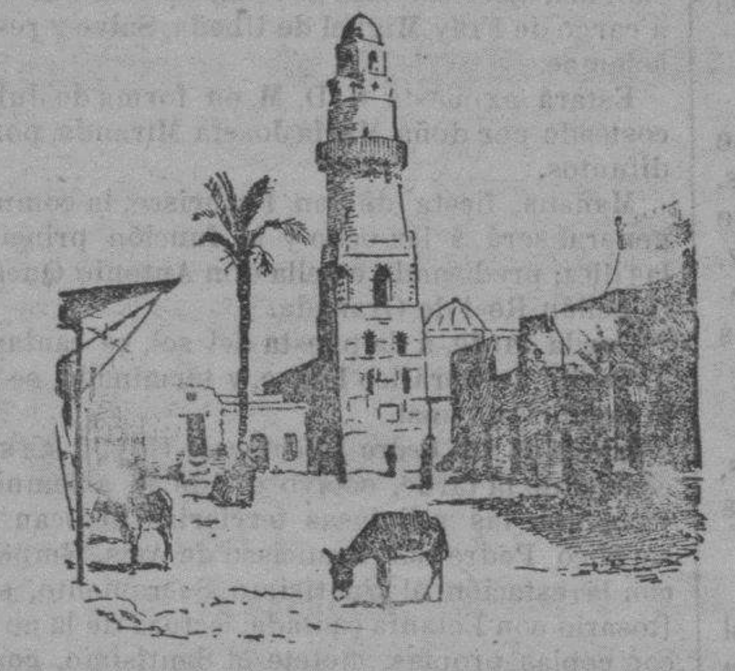
El conflicto italo-turco.—Una calle de Beni-Ghassi (Cirenaica) cuyo puerto es uno de los elegidos para el desembarco de las tropas italianas.