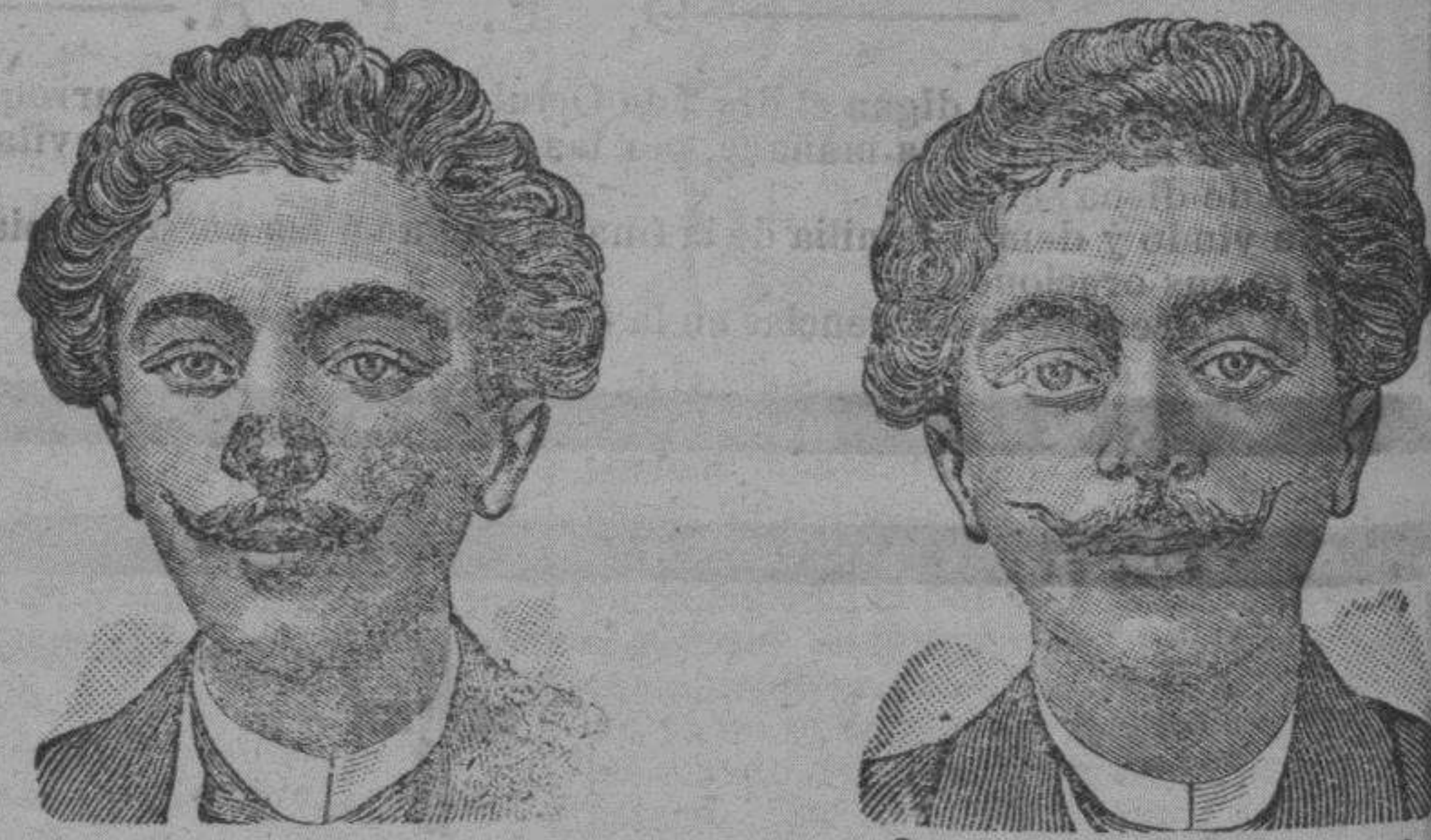
Antes de la curación.