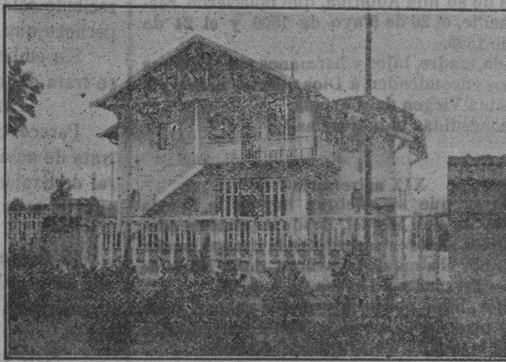
Fotografía del Chalet de S. de Orive