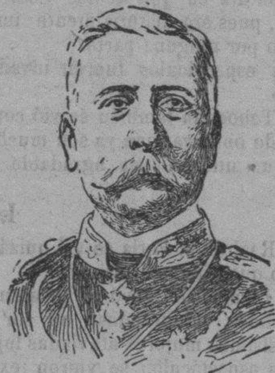
General Porfirio Díaz

Dejando á un lado pasiones y egotismos y procurando solamente el bienestar de la patria por medio de la paz, el general Porfirio Díaz ha presentado al fin su dimisión de la presidencia de la República de Méjico.