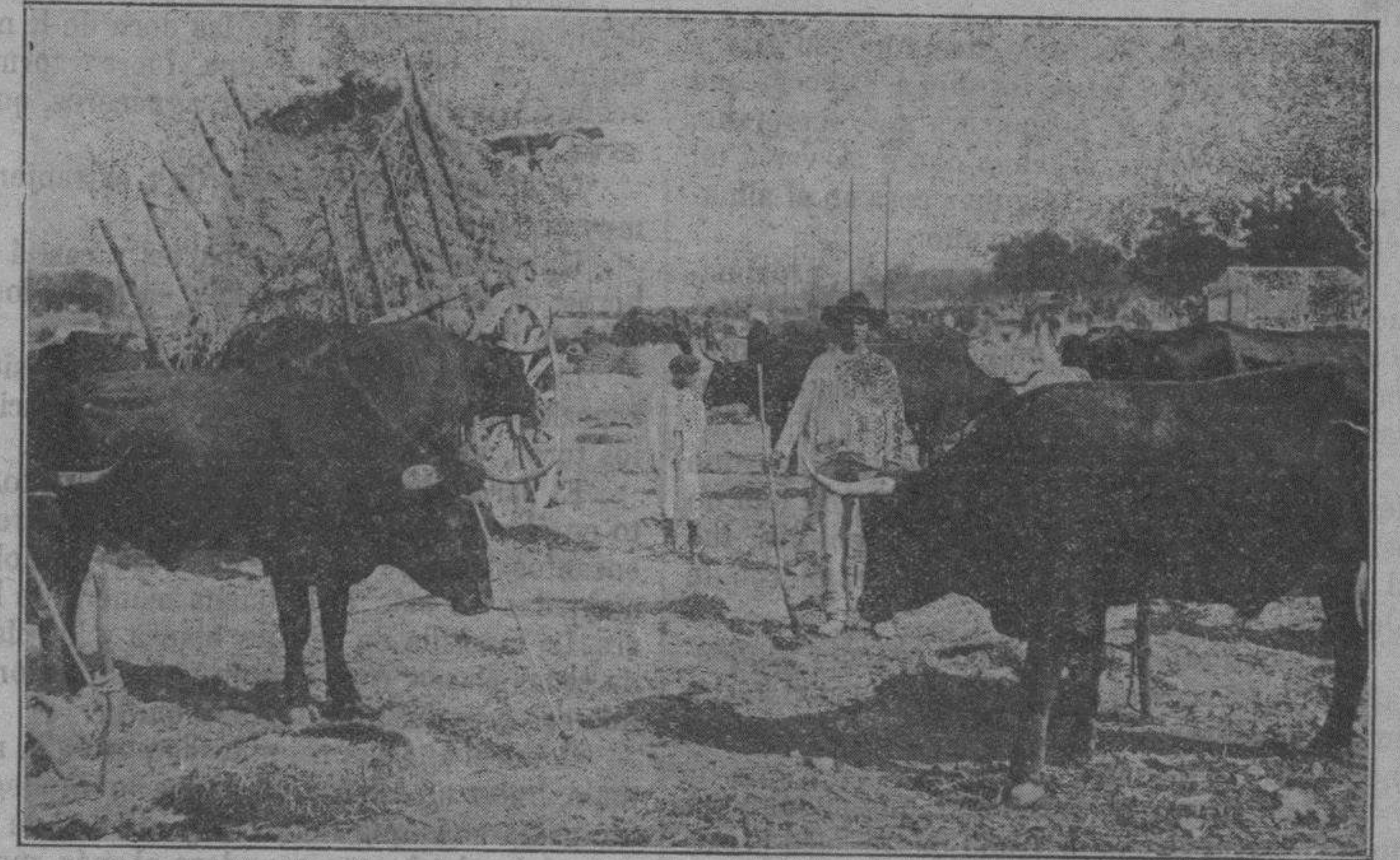
El mercado de ganado.