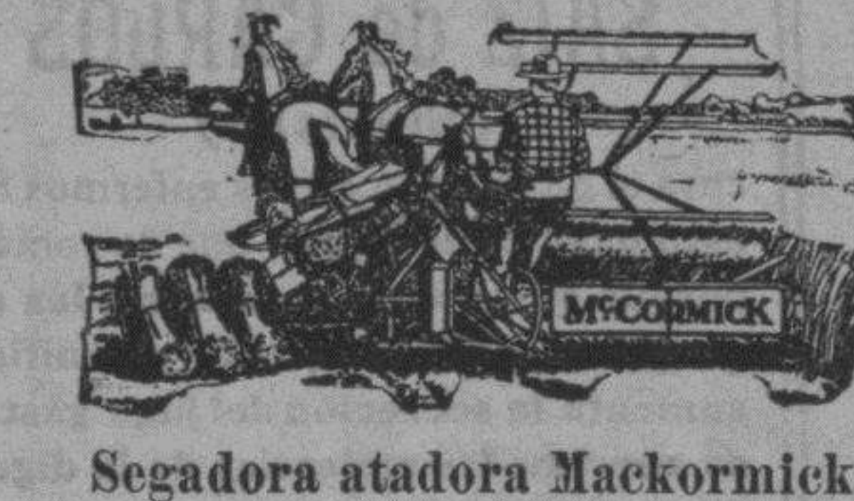
Segadora agavilladora Mackormick