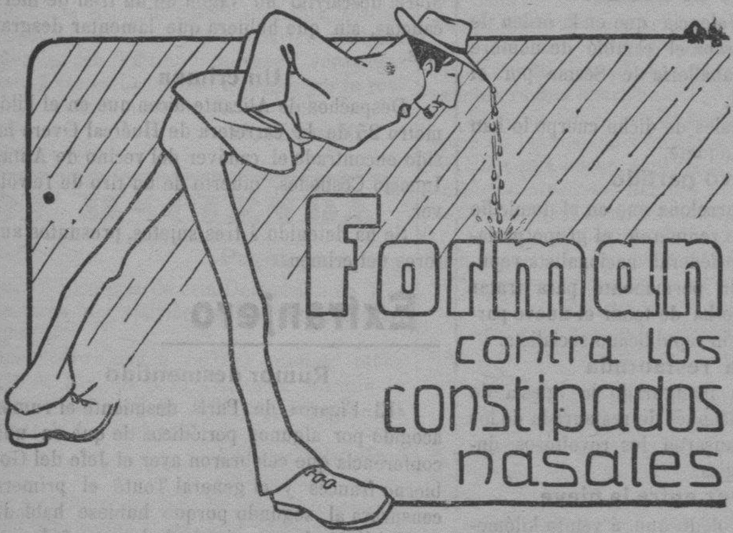
Precio de la caja, 0'75 pesetas. De venta en Farmacias.

DEPOSITO CENTRAL: Laboratorio Químico-Farmacéutico de F. del Río Guerrero, sucesor de González Marfil, Málaga.