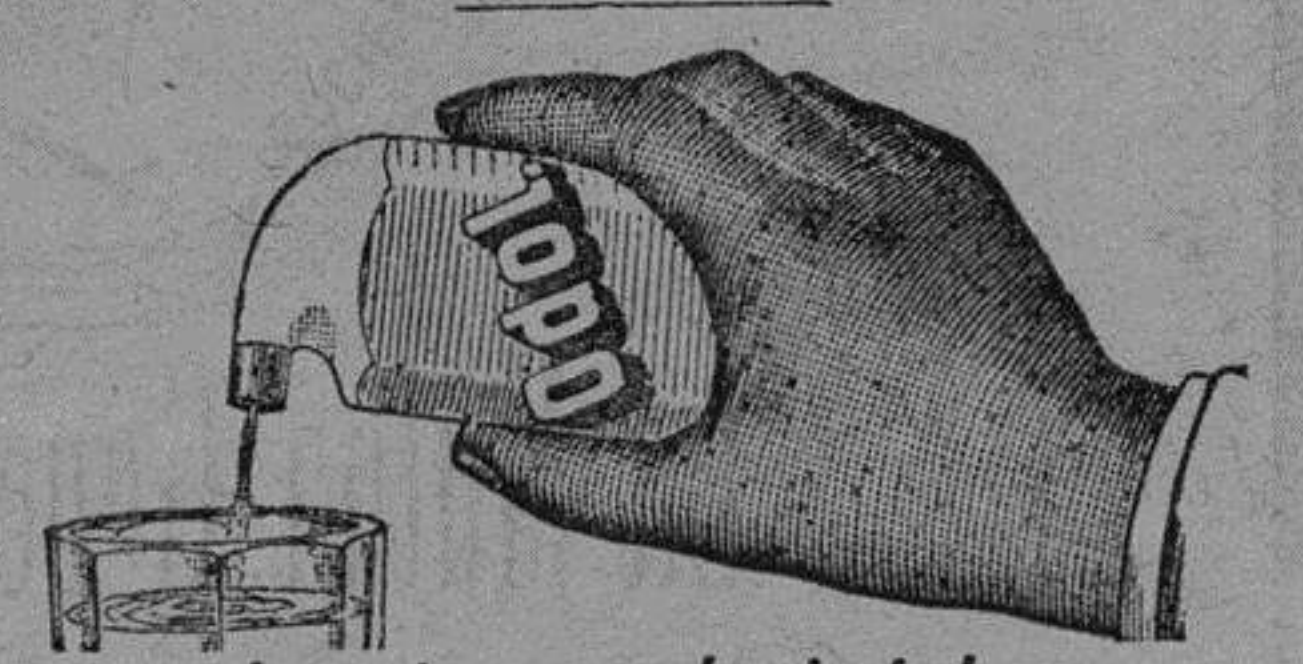
lo mejor para la dentadura