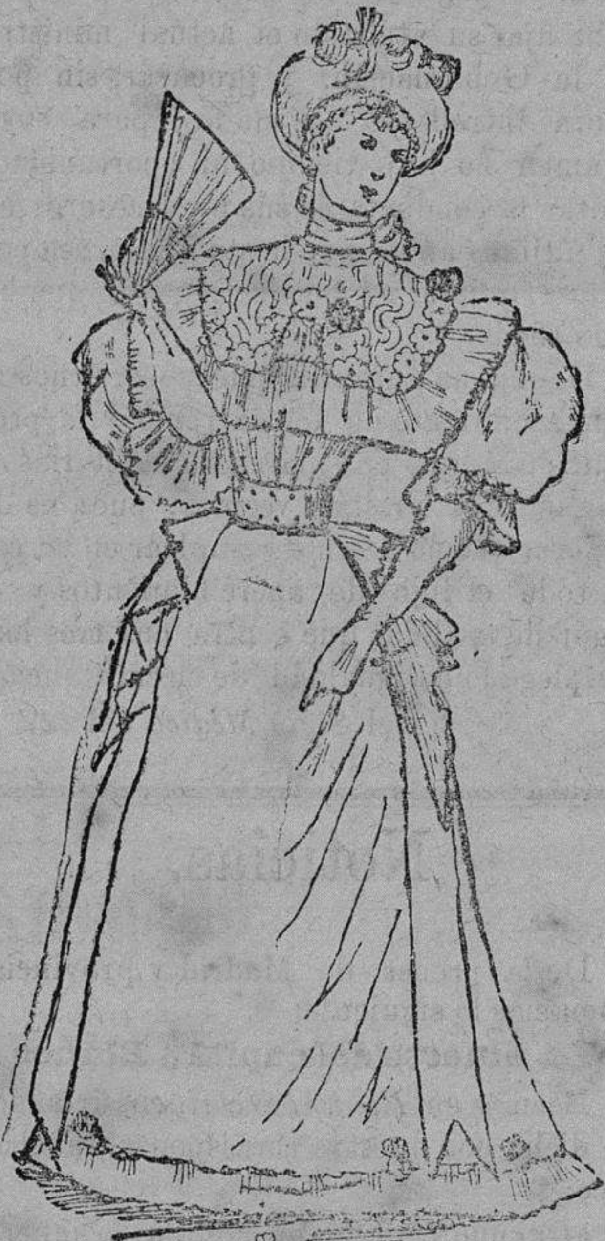
Trage de primavera para señorita.

Es de crespón rosa adornado de encage crema y cintas de moiré granate. Cuerpo fruncido de crespón; canesú cuadrado de encage rodeado de un volante también de crespón plegado á acordeón. Se suprime el cuello recto poniendo en su lugar una cinta granate haciendo un gran lazo detrás, esto es: atado al cuello. El canesú está salpicado de escarapitas de cinta granate; cinturón de moiré de los llamados Robespierre , de color granate como las escarapitas, el cual se cierra ó abrocha con una gran hebilla. Manga muy ancha y terminada en el codo con un volante plegado de igual modo que el que rodea al canesú. Del mismo volante lleva unas pequeñas quillas en las caderas.