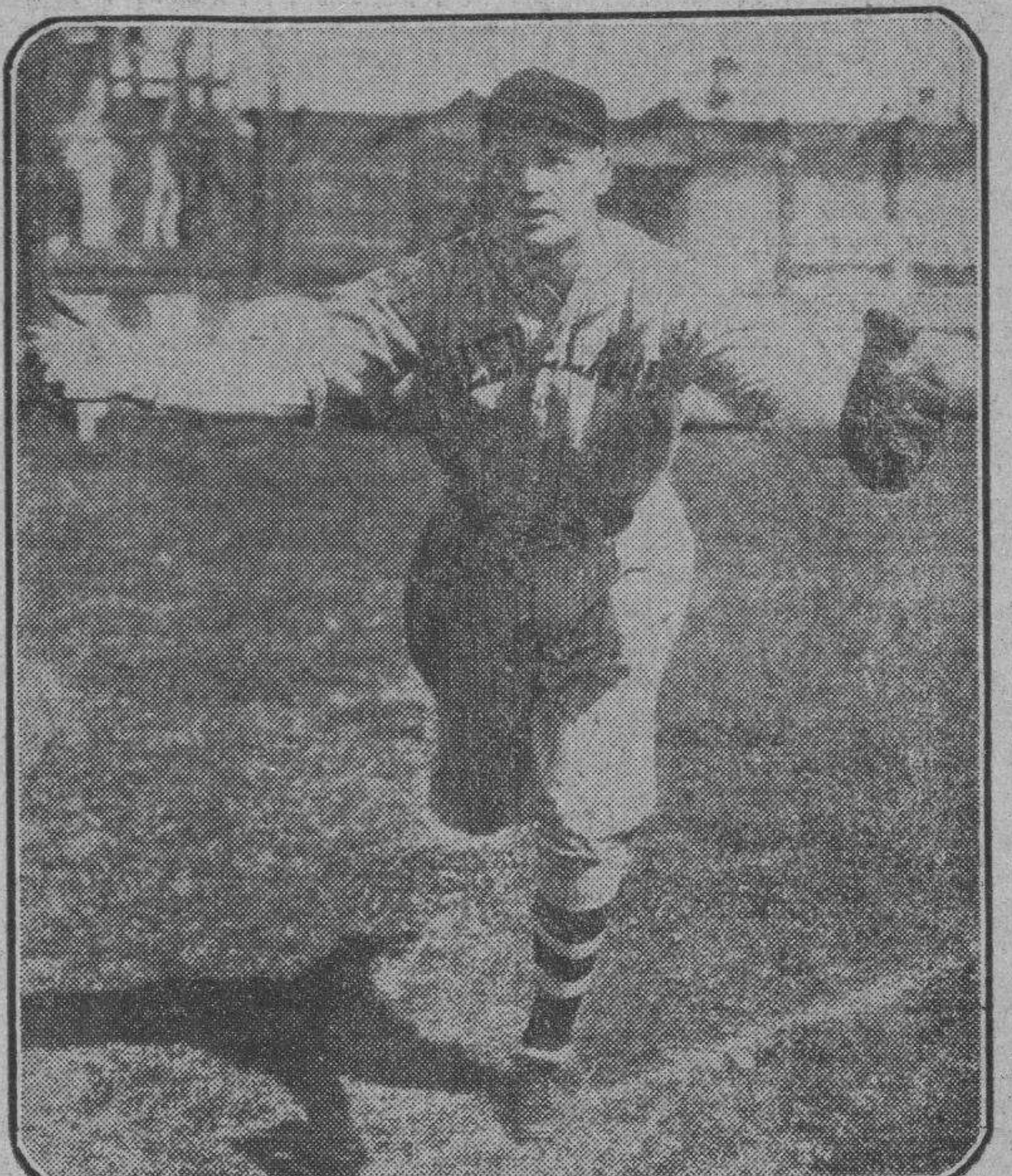
Cleveland tuvo su Napoleón Lajoie, su Tris Speaker y su Stanley Coveleski, pero ahora tienen a un Joe Vosmik que les hace olvidar a sus estrellas de antaño. El muchacho, procedente de los plácemes, ingresó en las filas de los Indians, lo ha venido haciendo muy bien. Tiene solo veinte años y se le considera el mejor novato de las dos Grandes Ligas.