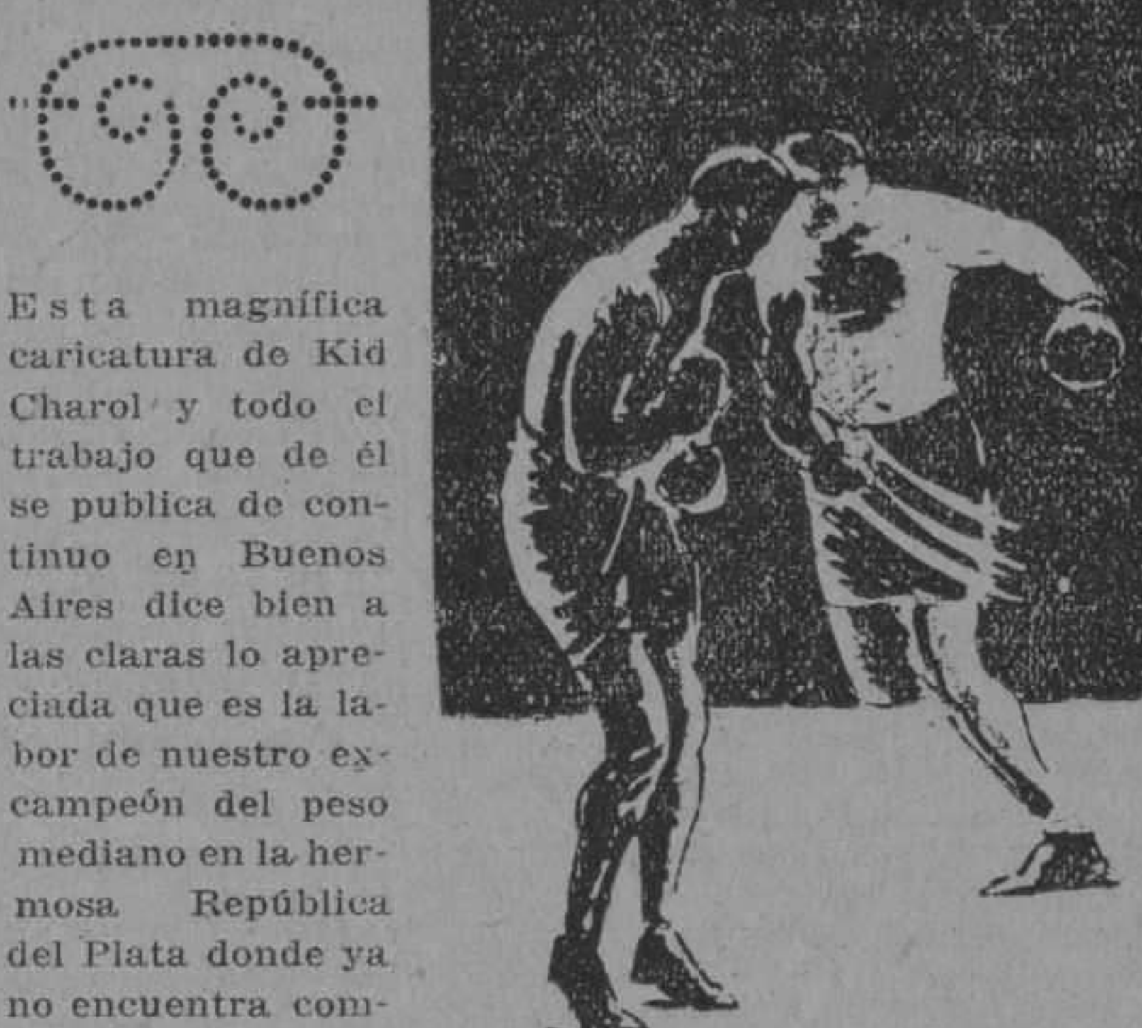
UNA POSE DEL GRAN CHAROL

Este hombre de voz, ese compás del gesto, esa actitud imperturbable, serena y dominante, esa memoria perfecta, esa dicción clara y fluida, todo eso que en presencia del orador nos arrebatamos de entusiasmo, que nos lleva a nos mismos y nos apropiamos convulsivamente en óvil arcilla a la voz del alfiler mágico que con un acento nos infunde sus emociones, todo eso ¿cómo puede ser?