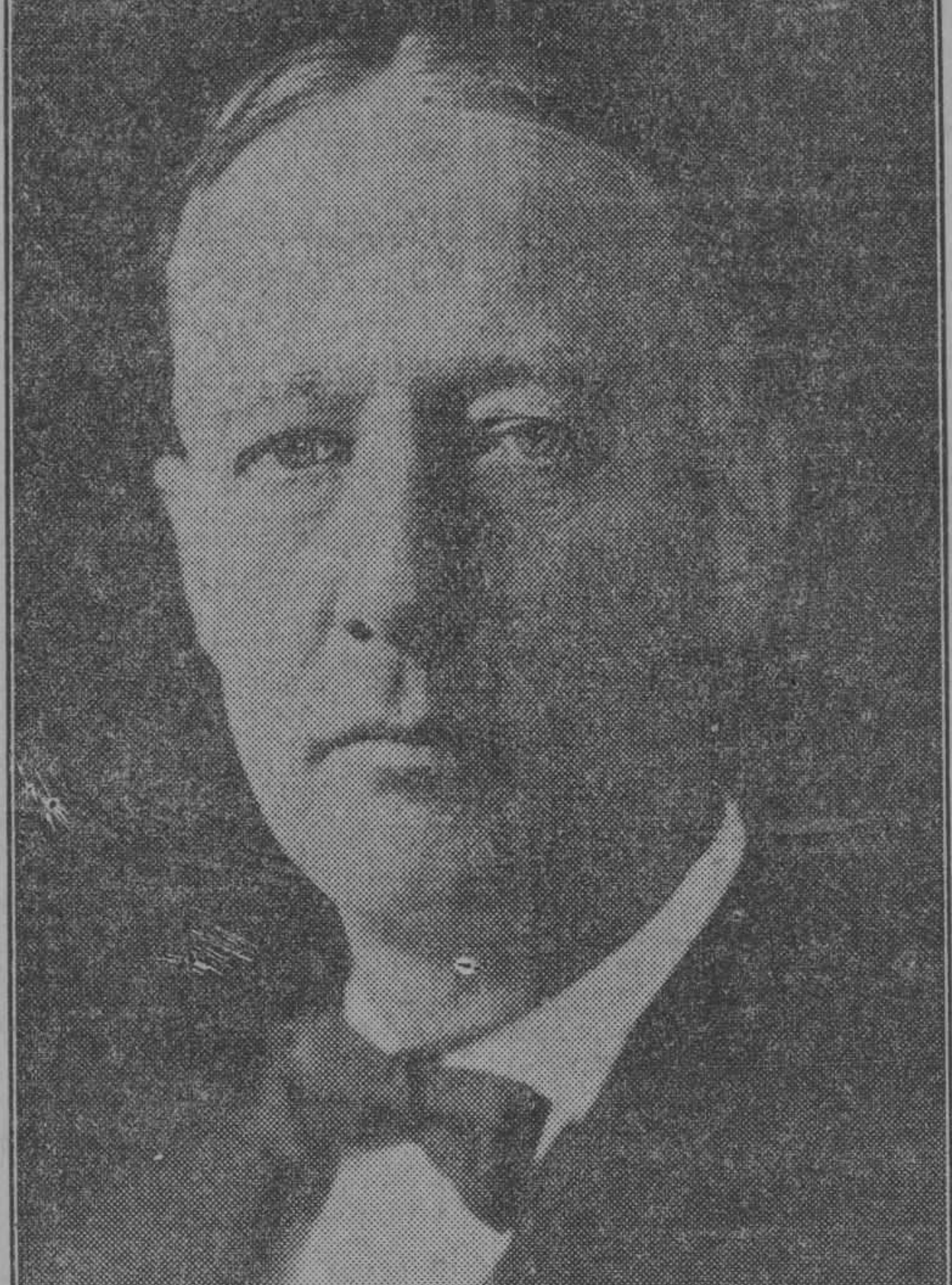
Alfred Emanuel Smith