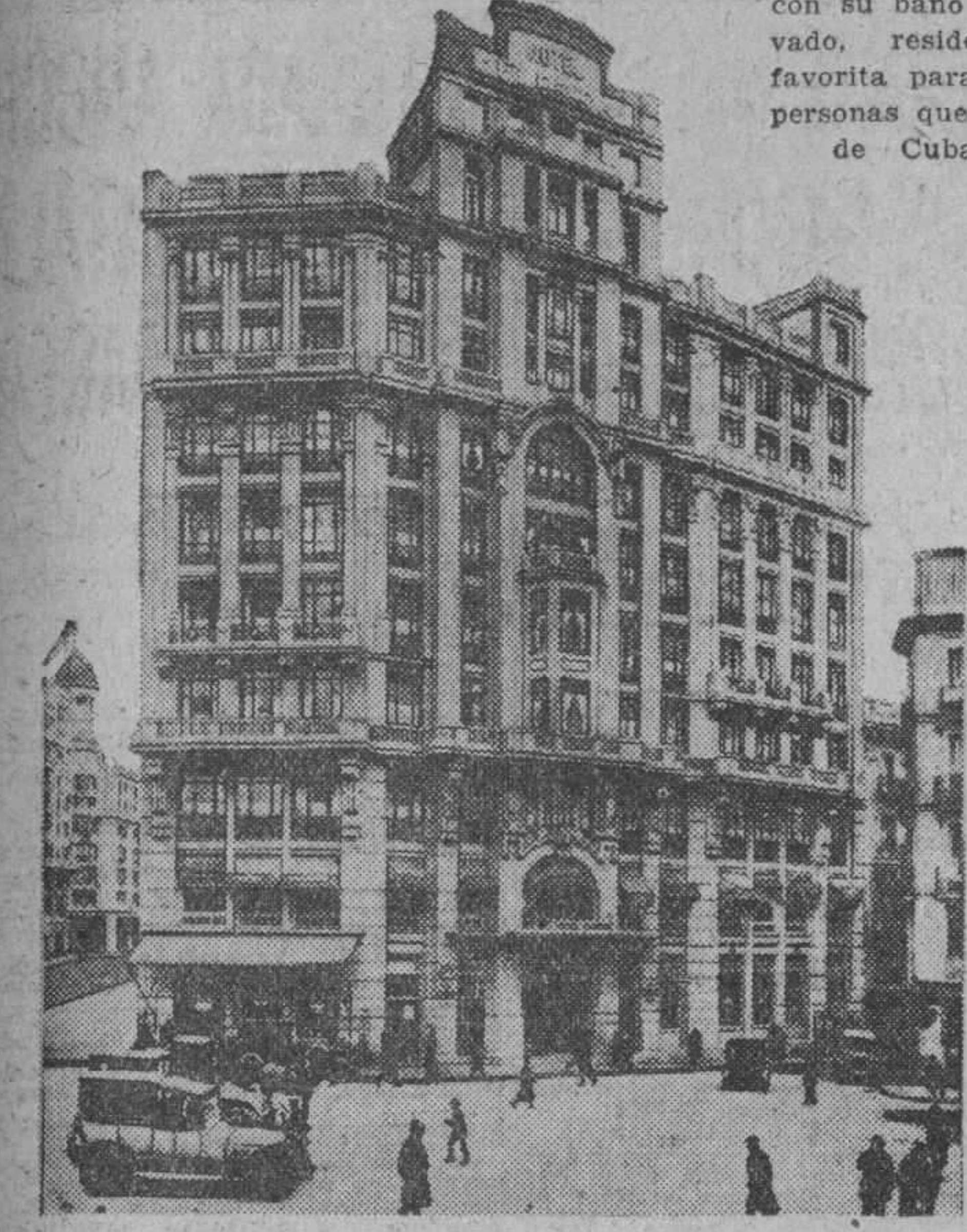
Situado en la parte más amplia de la célebre Gran Vía, cerca de todos los espectáculos y establecimientos de lujo.

200 habitaciones con su baño privado, residencia favorita para las personas que van de Cuba