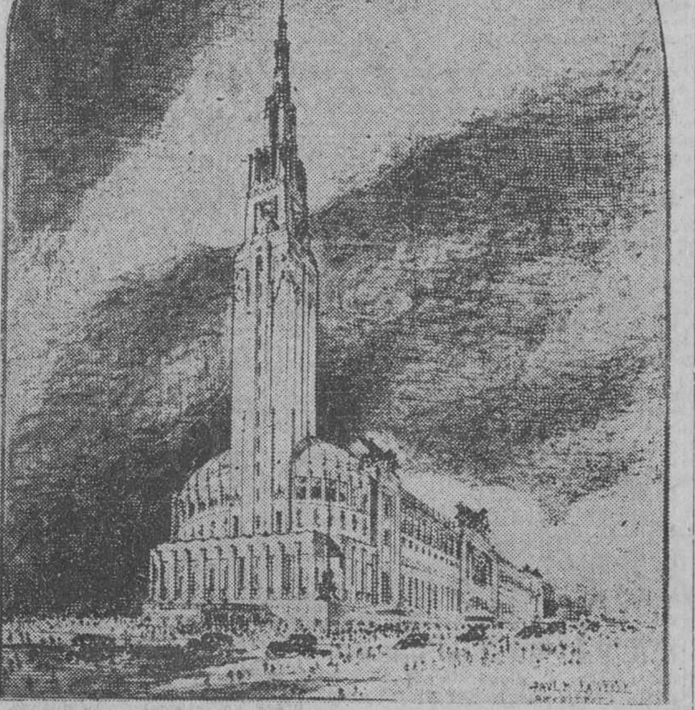
Aquí nos muestra el arquitecto que ha ideado la grandiosa obra de la nueva Arena que se levantará en Brooklyn, New York, cómo ha de ser el edificio...

Acuerdo núm. 38: Aceptar el balance del mes de diciembre presentado por el Tesorero del Comité Ejecutivo.