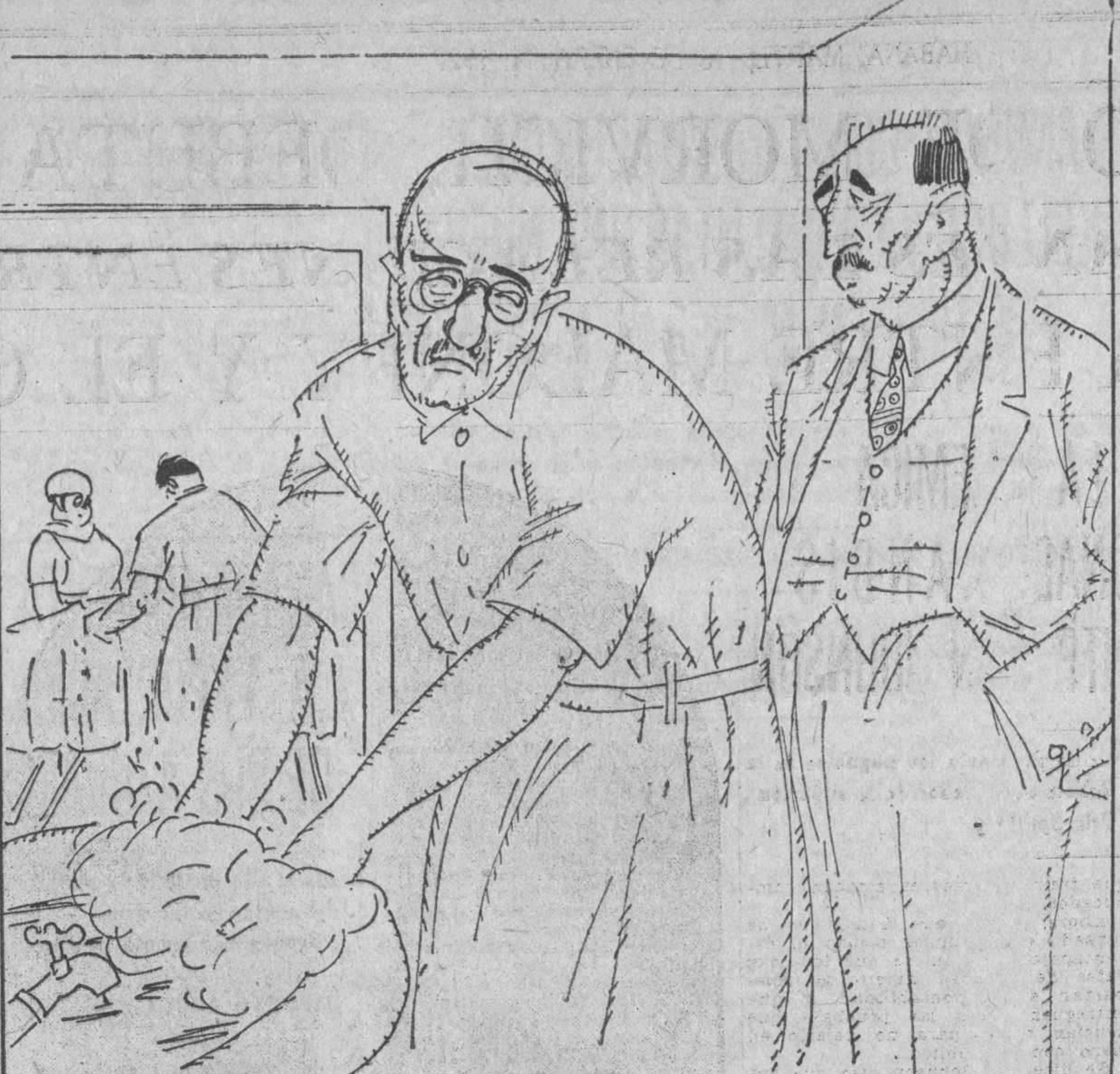
El profano.—"La apendicis" es un órgano inútil ¿verdad doctor...? El cirujano.—Antes existía esa creencia, pero después los médicos hemos descubierto que no es tan inútil como parece...