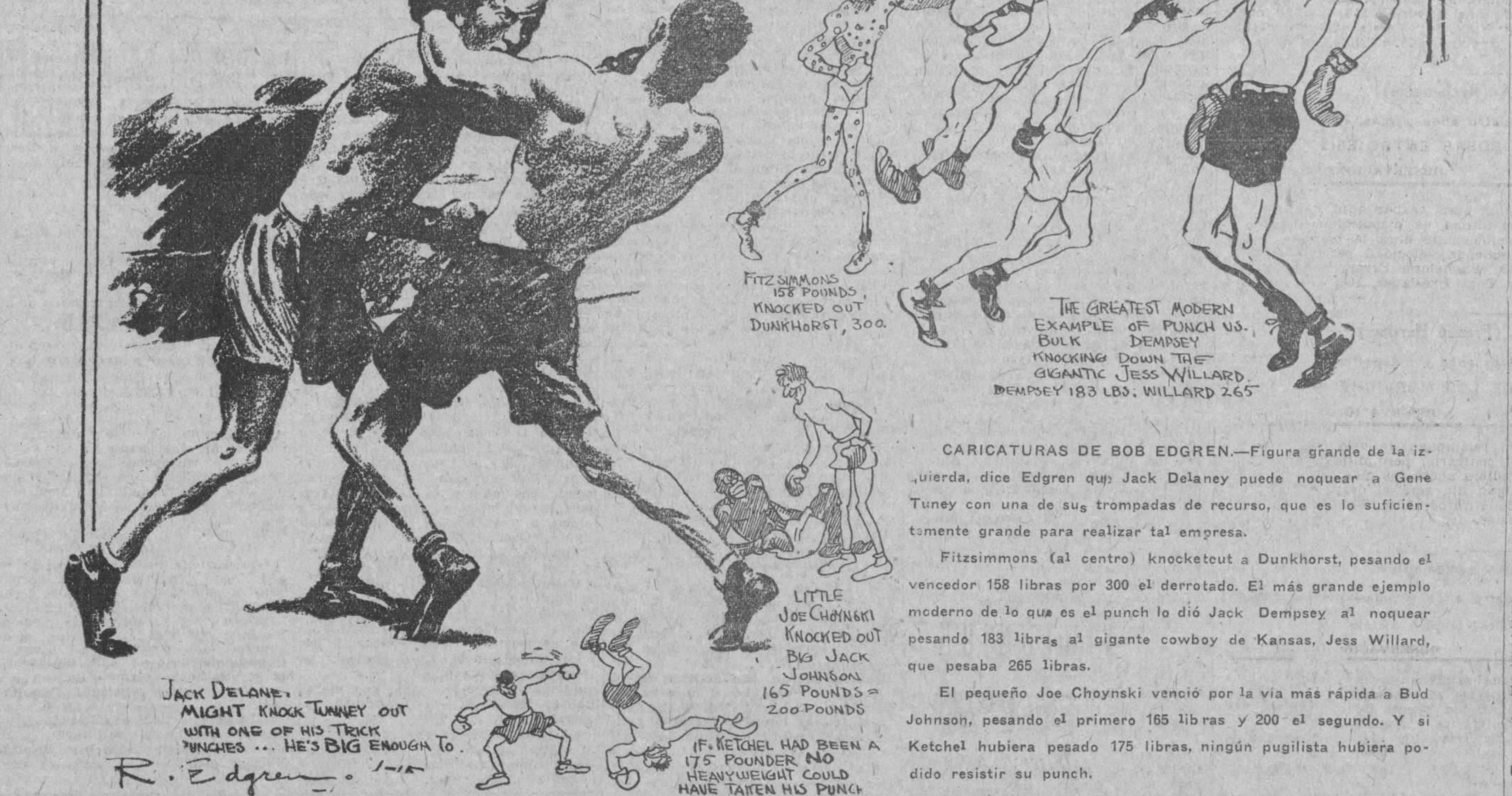
Jack Delaney, might knock Tunney out with one of his trick punches... He's big enough to... Little Joe Choyinski knocked out Big Jack Johnson... Burns, campeón con 164 libras