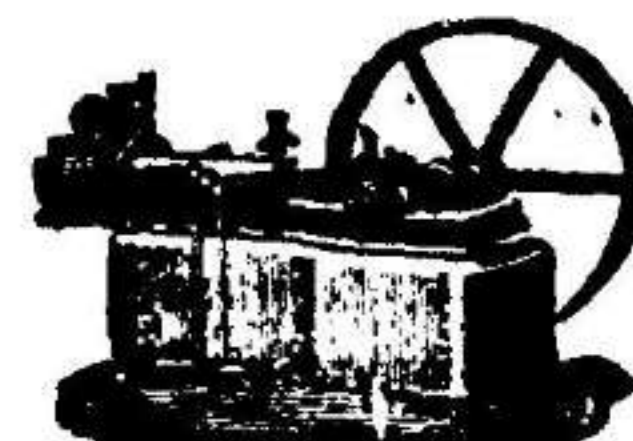
Máquina de vapor horizontal.

Aparatos para hacer gaseosas y toda clase de maquinaria.