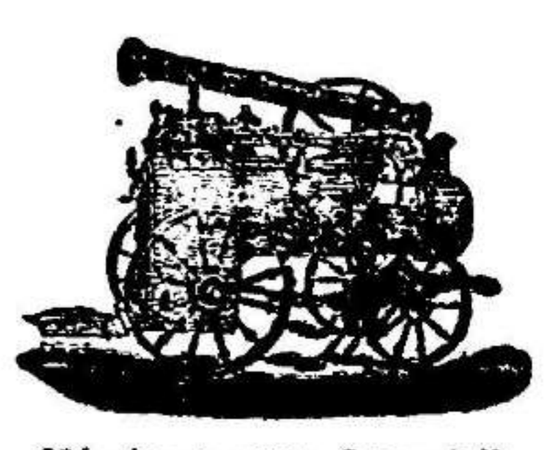
Máquina de vapor. Locomóvil.

SUCURSAL EN VALLADOLID, ACEBA DE RECOLETOS, 6.