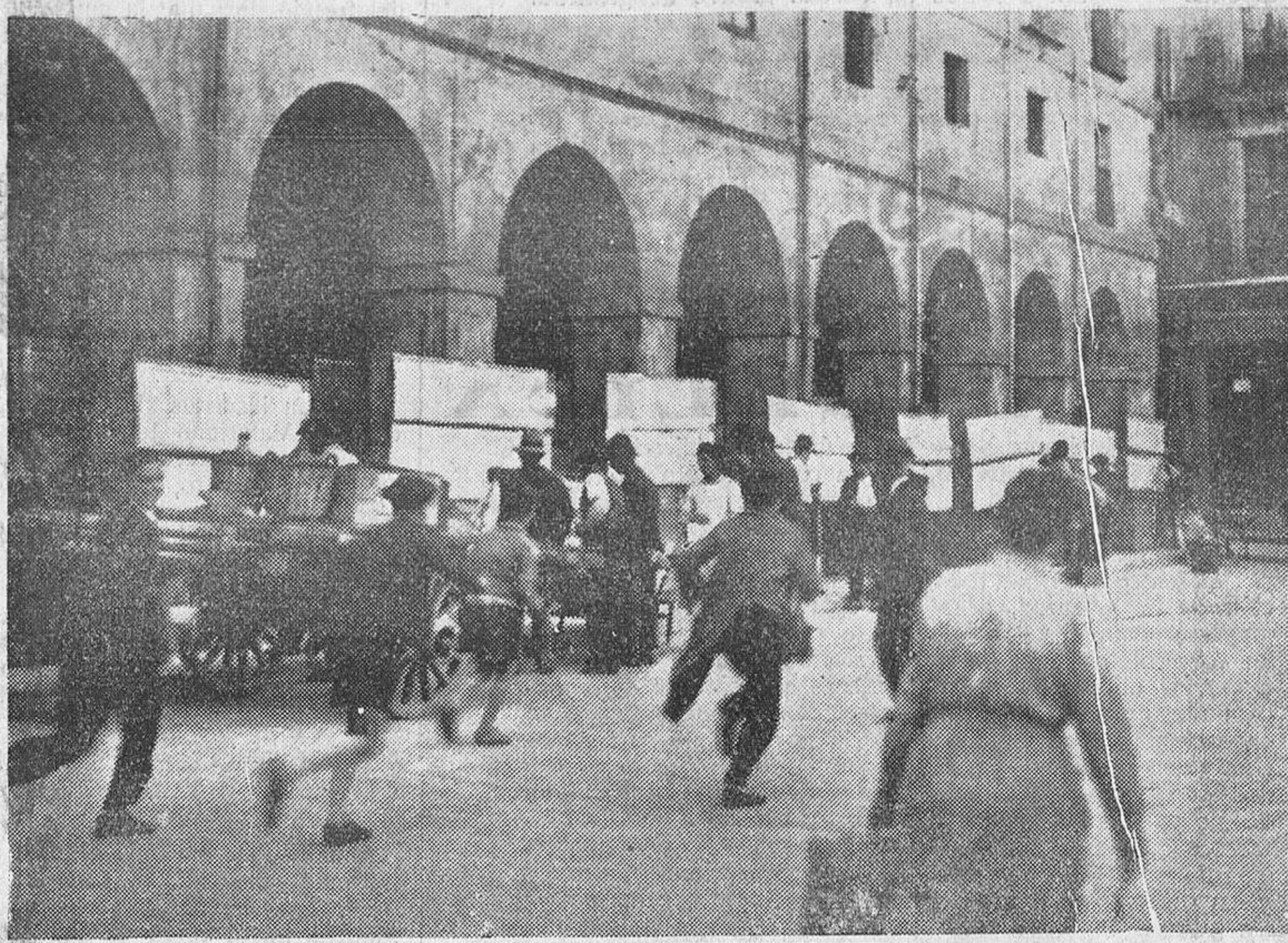
He aquí un aspecto de la diaria visita que electoras y electores hacen a las listas del Censo, expuestas en los típicos portales de San Antonio, de la Plaza del Mercado, para comprobar si sus nombres figuran entre los que ha de ejercitar el derecho y cumplir el deber de votar, cuando el Gobierno de la República lo disponga