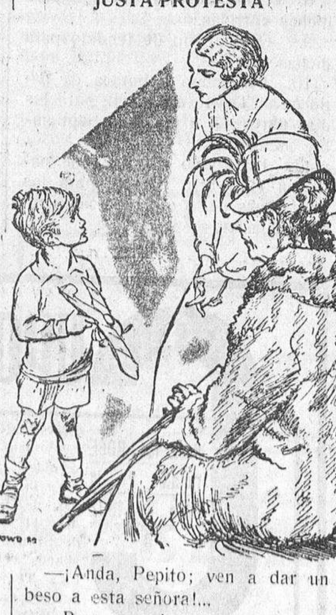
—¡Anda, Pepito; ven a dar un beso a esta señora!... —Pero, mamá, ¡si yo no he hecho nada malo!...

LOS CALDERONES PRECIOS BARATISIMOS: SOMBRA, 2,50 pesetas. SOL, 1,50 pesetas.