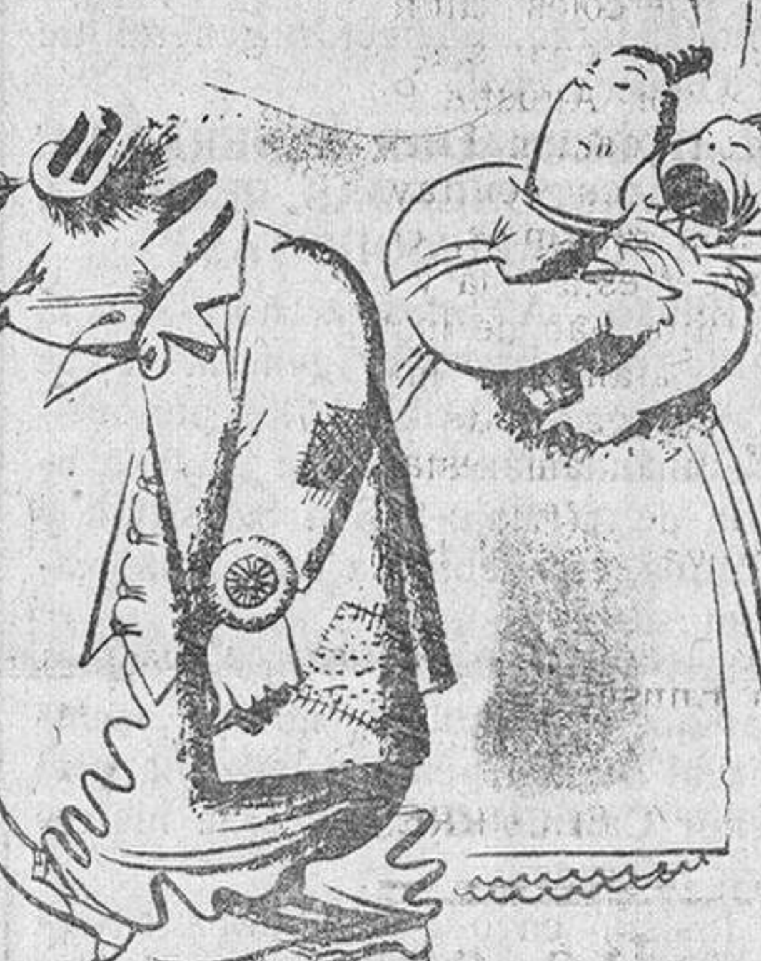
El célebre clown, que ha hecho reír a carcajadas al mariscal Hindenburg, fracasa lamentablemente con su propio hijo...