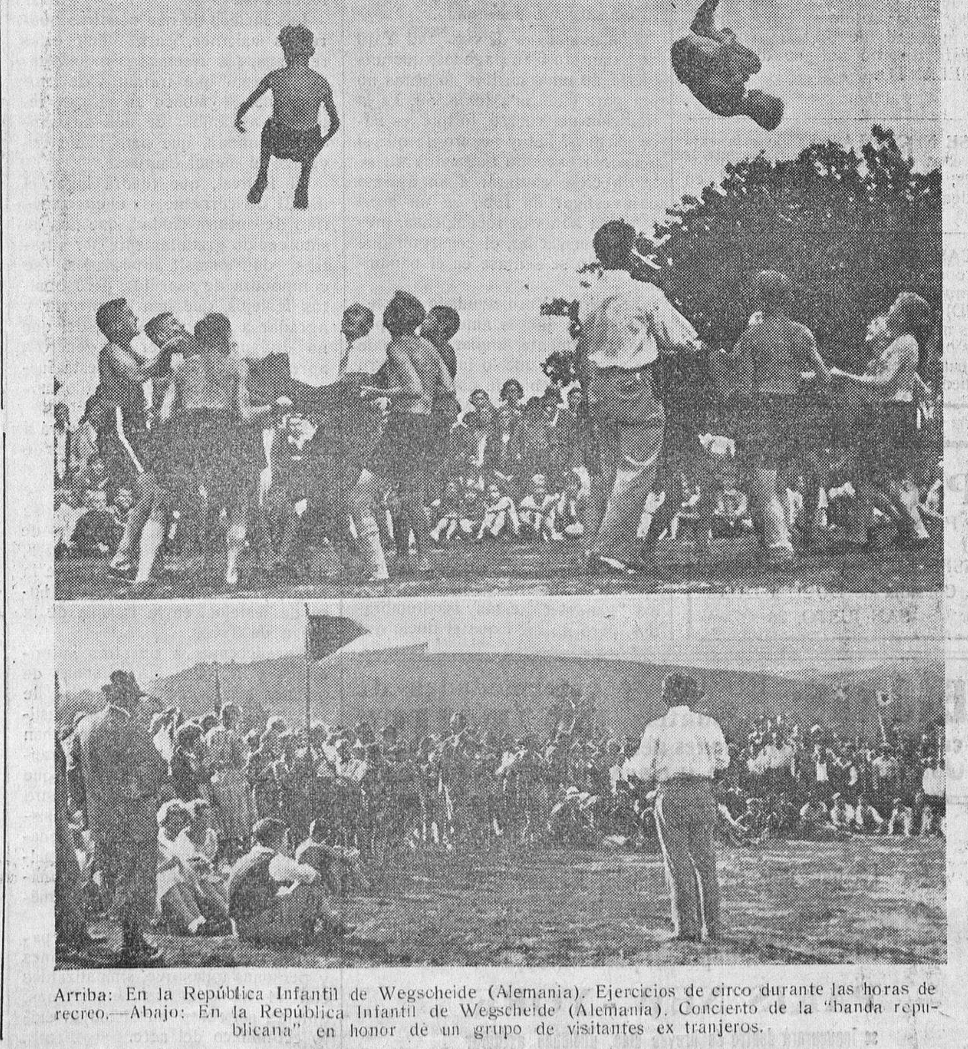
Arriba: En la República Infantil de Wegscheide (Alemania). Ejercicios de circo durante las horas de recreo.—Abajo: En la República Infantil de Wegscheide (Alemania). Concierto de la "banda republicana" en honor de un grupo de visitantes extranjeros.