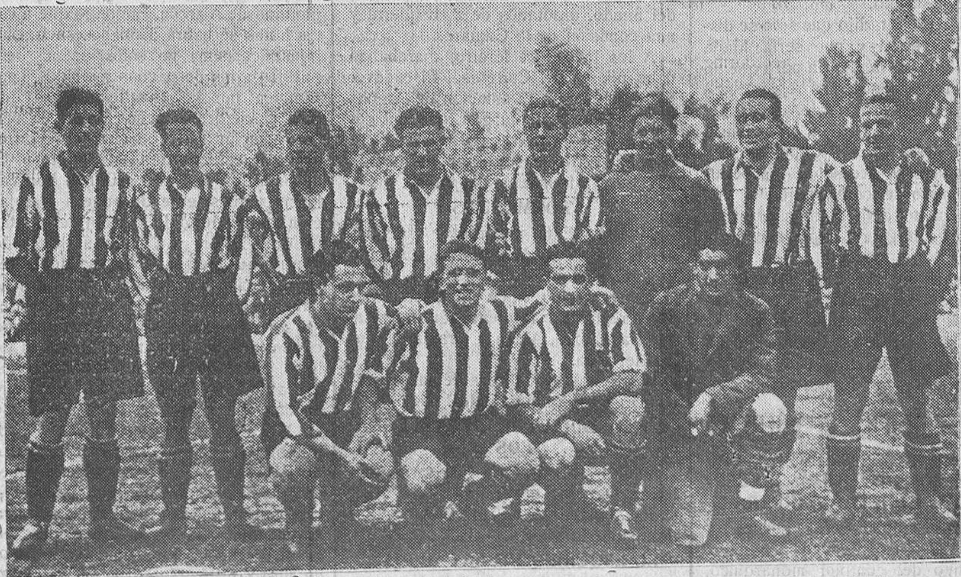
El equipo vencedor del Athletic de Bilbao