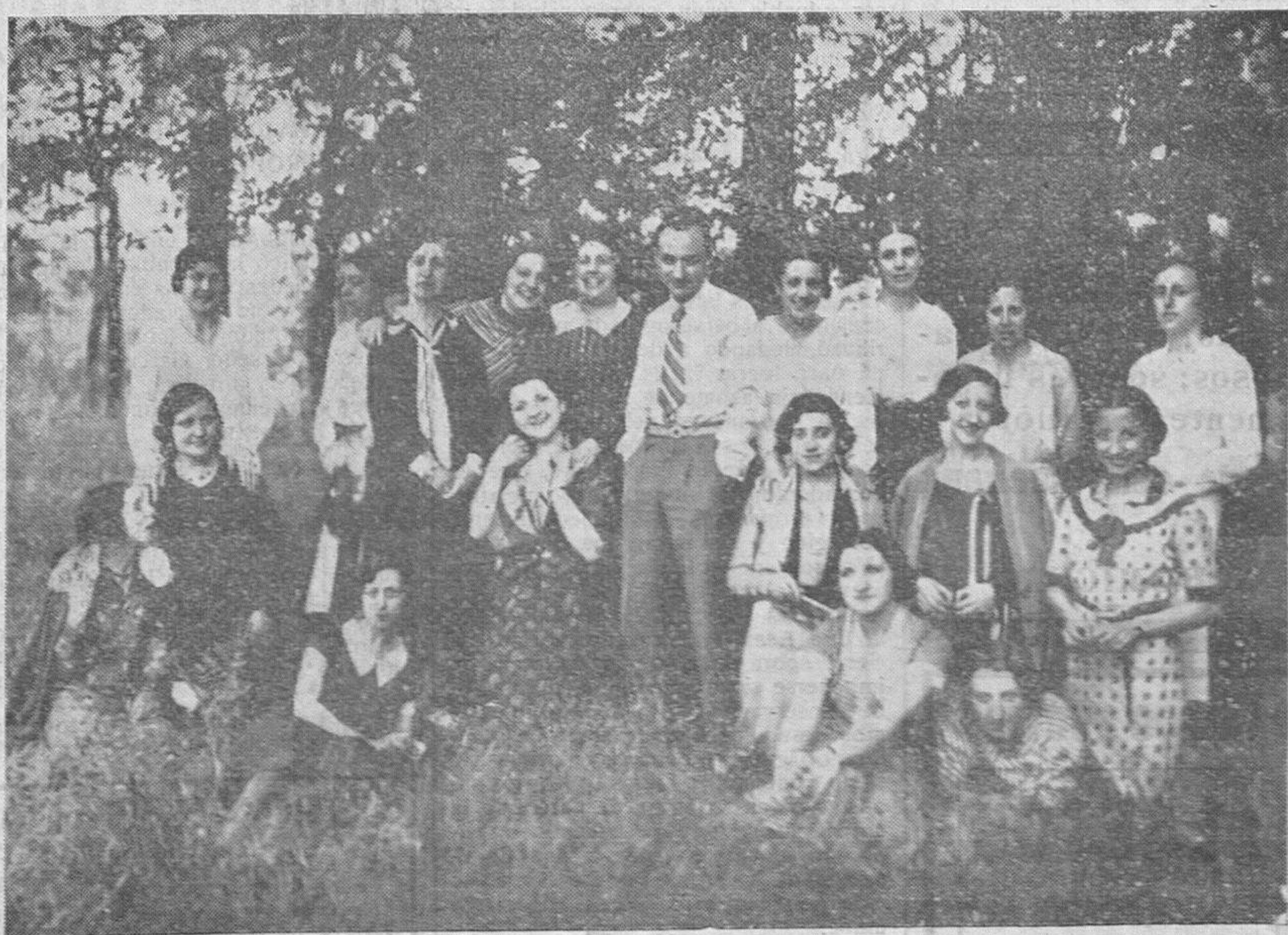
Grupo de señoritas, obtenido en la pintoresca isla de "La Flecha", adonde realizaron el domingo una excursión para festejar la feliz terminación de sus exámenes de enfermeras