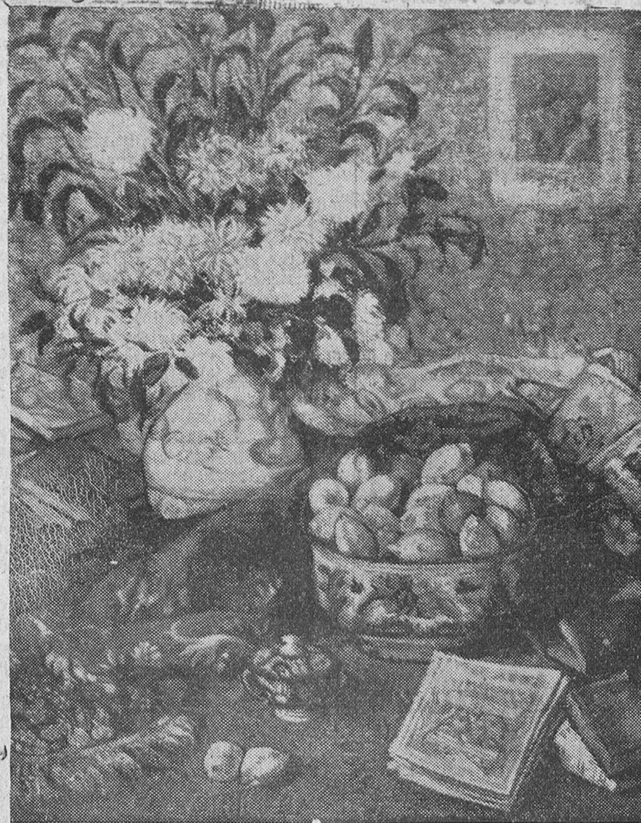
"Naturaleza muerta", por Juan de Echevarría

No puede ser olvidado, y aun mucho menos sus obras, sus intere-