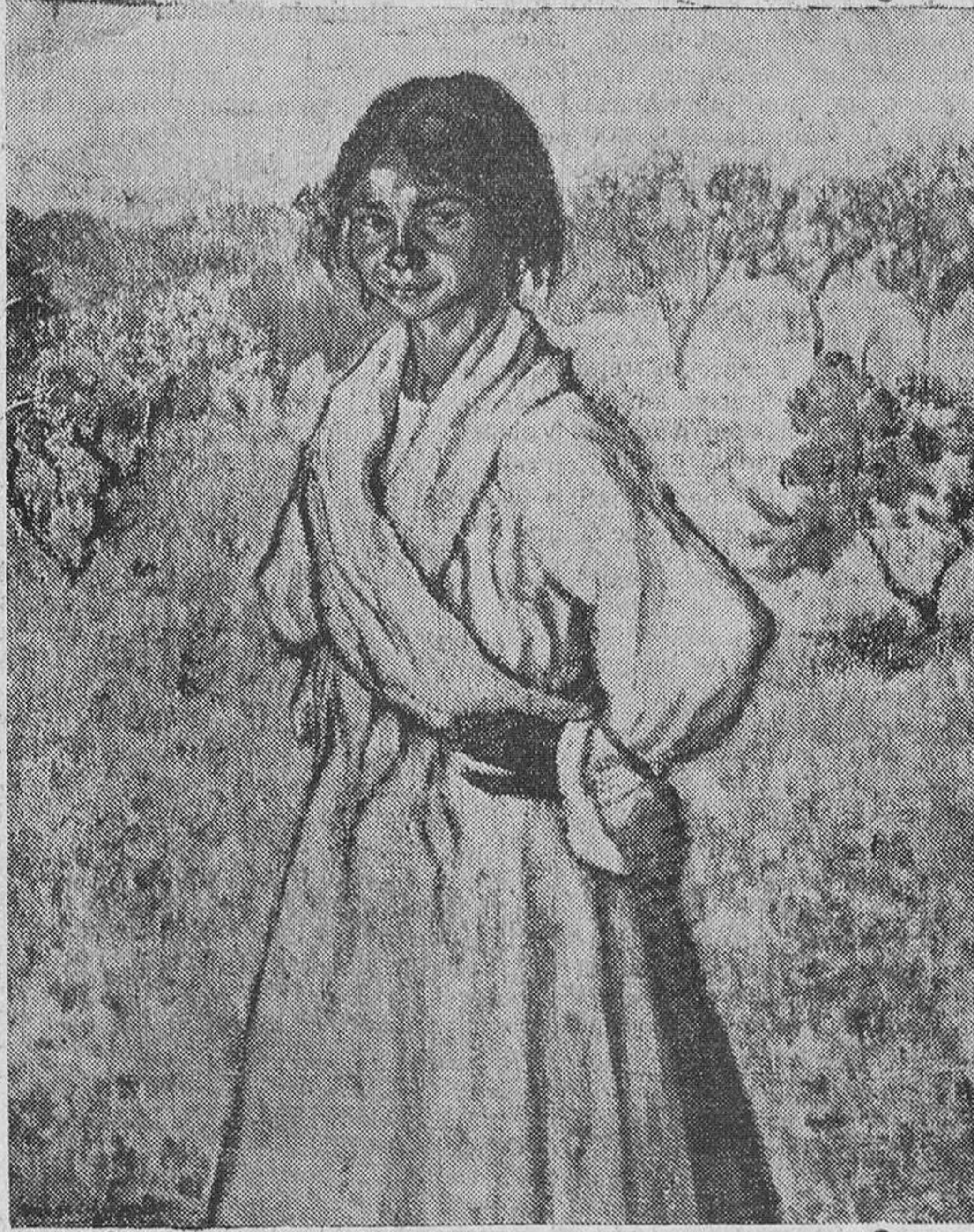
"Gitanilla", por Juan de Echevarría

Hace pocos meses, muy pocos, de tan fatal desgracia, y el mago creador de esos lienzos maravillosos de técnica y de colorido, de esas flores, por nadie espiritualizadas mejor, y de esos retratos, de la más aguda penetración psicológica, empieza a ser olvidado por los más.