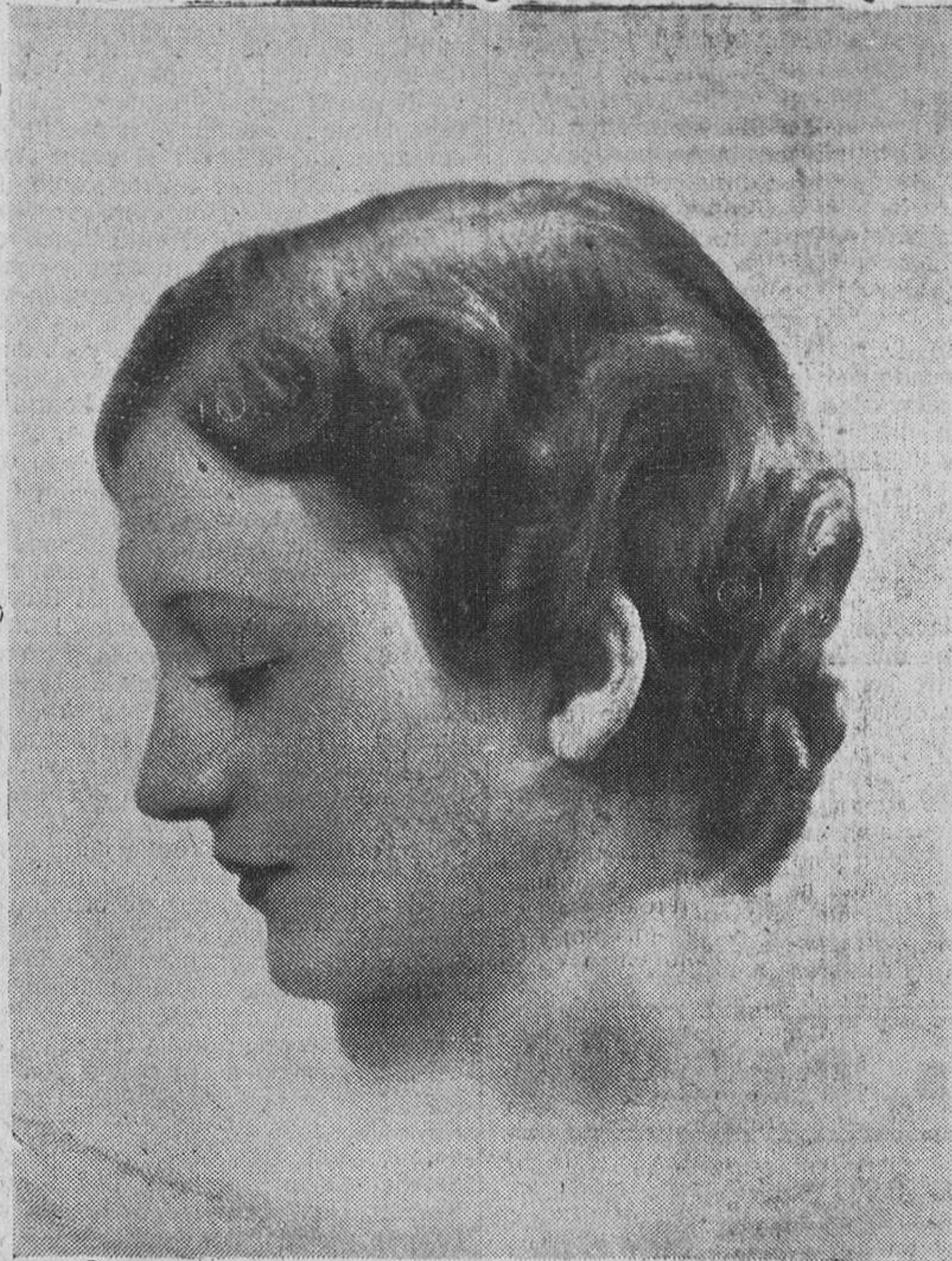
Inderrizable "Fuva". Modelo de "Isabey" Boulevard des Capucines. Paris